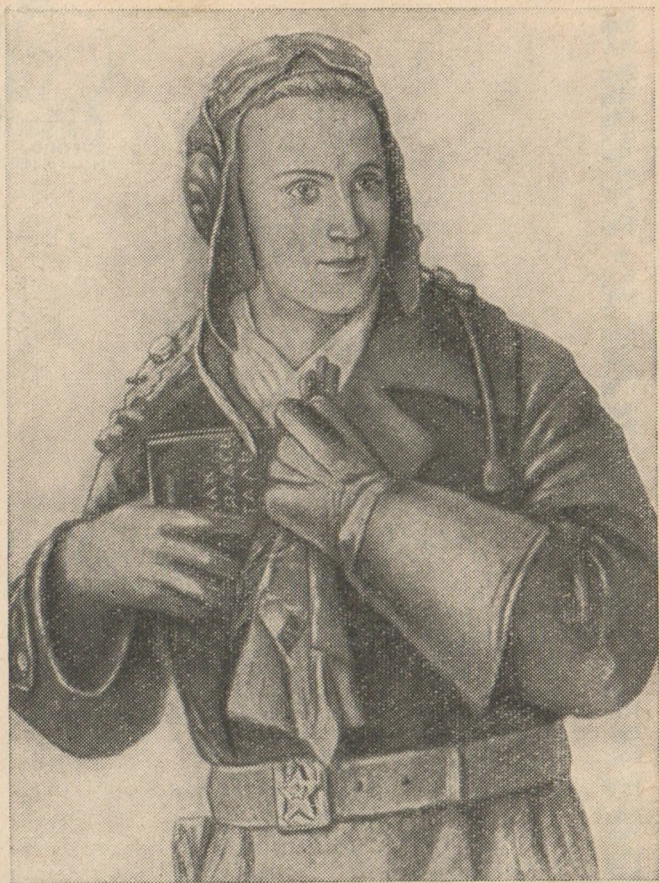
Рисунок художника Н. Пильщикова