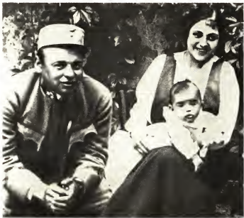
Бела Кун с женой и дочерью в Трансильвании, 1915 г.