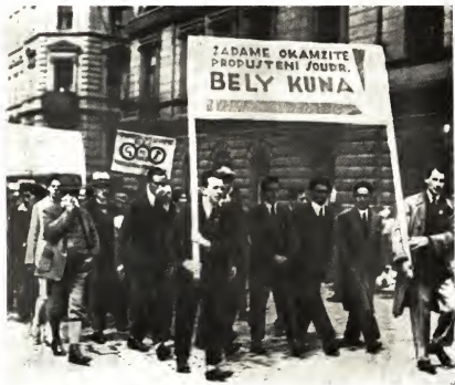
Демонстрация протеста против ареста Бела Куна. Прага, 1928 г.