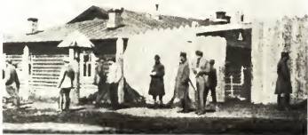
Томский лагерь военнопленных.