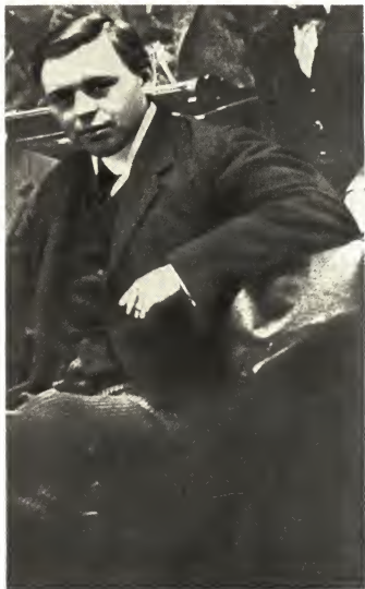
На XX съезде Венгерской социал-демократической партии, 1913 г.