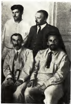
На V конгрессе Коминтерна, 1924 г. Сидят: Н. Скрипник и С. Лозовский, стоит Бела Кун.