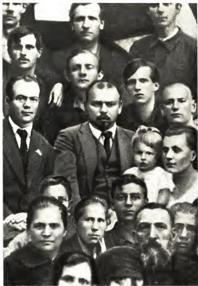
Среди рабочих фабрики имени Бела Куна в Ленинграде, 1924 г.