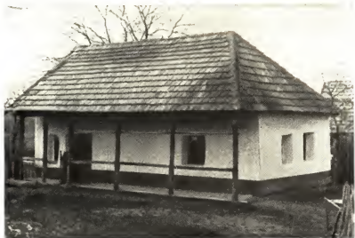
Дом в деревне Леле, где родился Бела Кун.