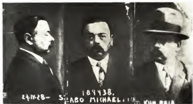
Бела Кун в венской тюрьме, 1928 г.