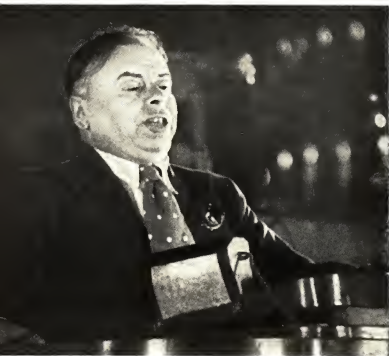
Речь на VII конгрессе Коминтерна, 1935 г.