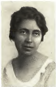
Гал Иоганна (Ханика).

Речь при освобождении города Кашши, 1919 г.