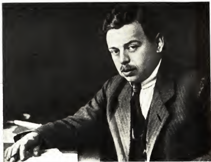
Бела Кун, 1921 г.