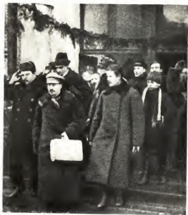
Вместе с делегатами IV конгресса Коминтер- на Бела Кун приезжает в Петроград, ноябрь 1922 г. Рядом с Бела Куном А. В. Луначар- ский.