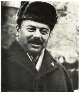
На трибуне Красной площади, 7 ноября 1922 г.