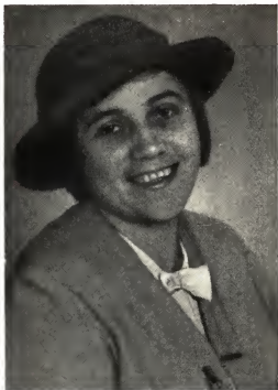
Среди рабочих Днепропетровска, 1928 г.