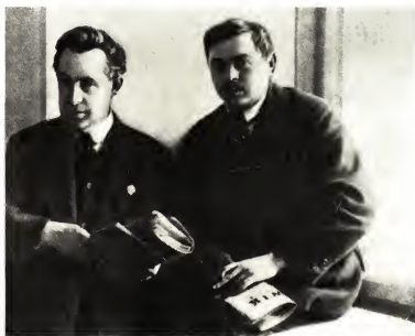
Бела Кун и Деже Бокани на III конгрессе Коминтерна, 1921 г.