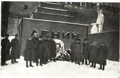
У первого ленинского Мавзолея, 1924 г.