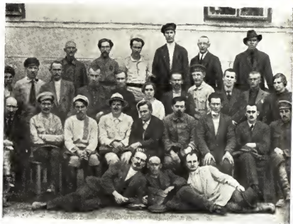
На пленуме Пермского губкома ВКП(б), 22 ию- ня 1922 г.