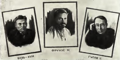
Члены Реввоенсовета Южного фронта, 1920 г.