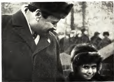
Бела Кун с дочерью.