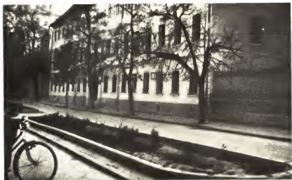
Коложвар. Реформатская коллегия, где он получил среднее образование.