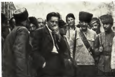
В Баку на съезде наро- дов Востока, 1920 г.