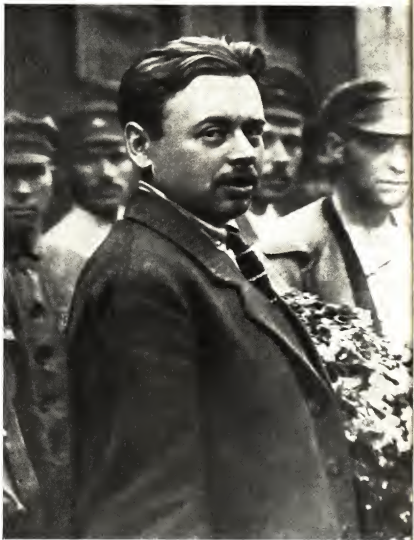
Бела Кун в Баку на съезде народов Востока, 1920 г.