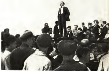
На митинге в Ростове, 1920 г. Третий справа от Бела Куна сидит Джон Рид.