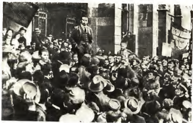
Бела Кун произносит речь перед парламентом. Будапешт, 1919 г.