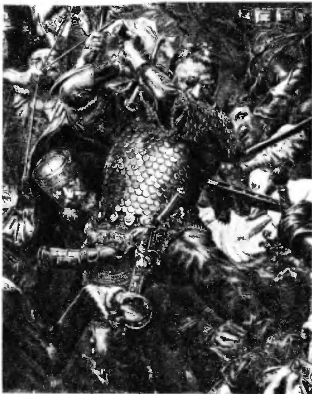
Ян Жижка в битве под Грюнвальдом (фрагмент картины Яна Матейко)

Гроссмейстер понял, что его план королем Ягайло разгадан и что ему не удастся поставить польское войско в неблагоприятные условия. Поэтому Юнгинген решил нанести удар по более слабому звену противника — по войску Великого княжества Литовского, разбить его, а затем расправиться со своим главным противником — польским войском.