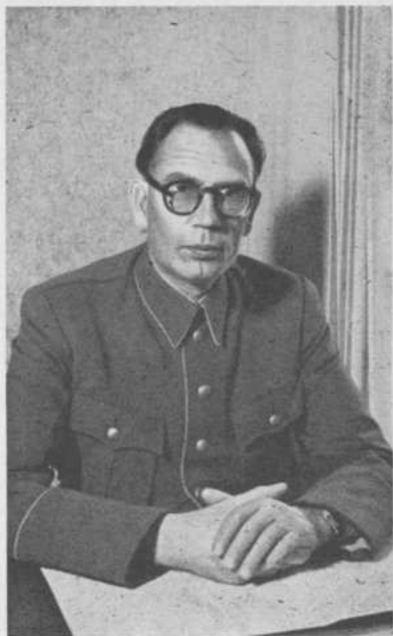
Генерал Андрей Андреевич Власов.