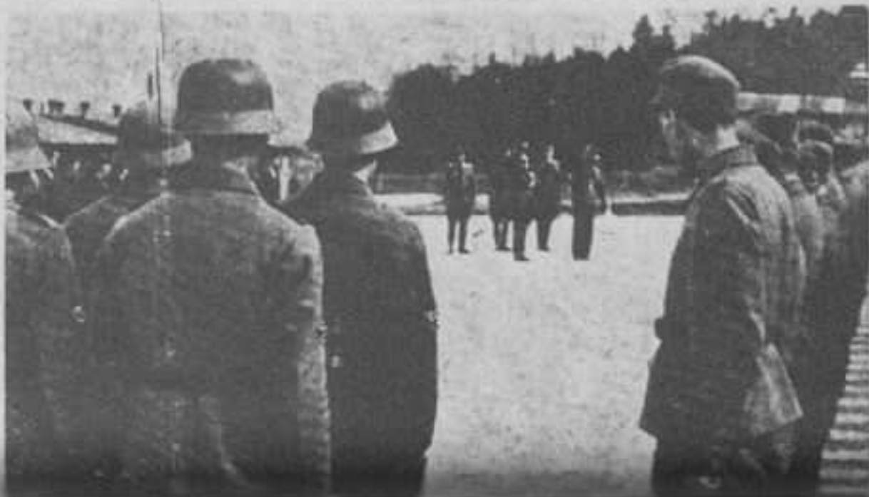
Слева направо: перед строем в лагере военнопленных.