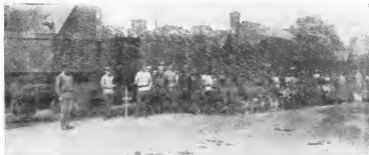
Один из бронепоездов, участвовавших в боях на Восточном фронте. Такие бронепоезда сыграли большую роль в борьбе с врагами революции

щего весьма важное военное значение, как ближайшая база снабжения всем необходимым войск, действующих на Восточном фронте.