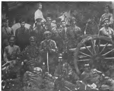
Артиллеристы Троицкой батареи

дубовцы предприняли ряд атак. Однако все их попытки ворваться в Троицк окончились неудачно: атаки были отбиты артиллерией и пулеметами. Солдаты 17-го Сибирского полка держались стойко. На помощь им уже спешили красногвардейцы Челябинска, Перми, Екатеринбурга.