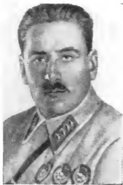
Василий Константинович Блюхер — начальник 30-й стрелковой дивизии

Верхнеуральского, Белорецкого и Троицкого. В Троицкий отряд был влит Стерлитамакский отряд, уже обстрелянный в боях с белочехами, и отряд рудокопов с Баймакских золотых приисков. Пехота этих отрядов вошла в 17-й Уральский полк, кавалерия — в 1-й Оренбургский полк имени Степана Разина.