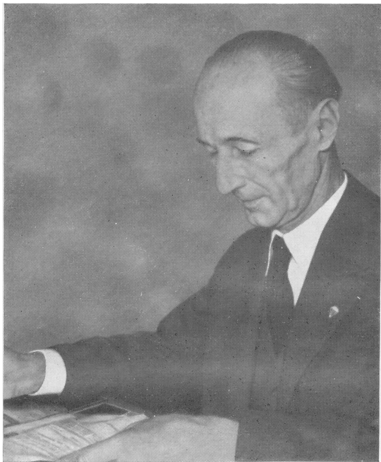
Гюнтер Гереке — президент Центрального ведомства коневодства ГДР.