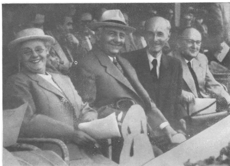
На бегах в Хошепартене. Второй слева — Президент ГДР Вильгельм Пик, рядом — Гюнтер Герреке, крайний справа — Отто Винцер.