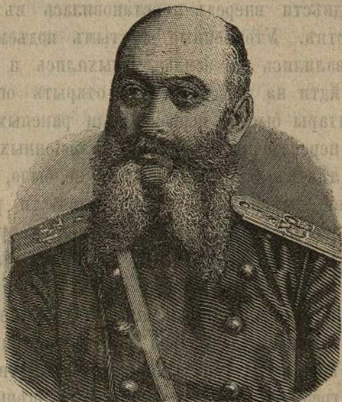
Маіоръ, князь Макаевъ.

Было около 11-ти часовъ. День стоялъ тихій и ясный. Солнце неумолимо жарило сквозь густой пороховой дымъ, окутавшій шумную вершину Гелляверды. Князь Макаевъ и я лежали за цѣпью, надъ оврагомъ,