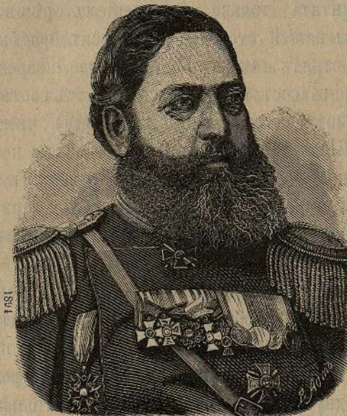
Капитанъ (подполковникъ) Чердилери.

ней, такъ и съ тыльной стороны; на вершинѣ выстроены прочныя батареи съ закрытіями для прислуги; между батареями громоздилась большая бесѣдка съ шелевчатымъ навѣсомъ, для предохраненія отдохавшихъ отъ солнечныхъ лучей; съ тыльной стороны поднималась крутыми зигзагами шоссированная дорога.