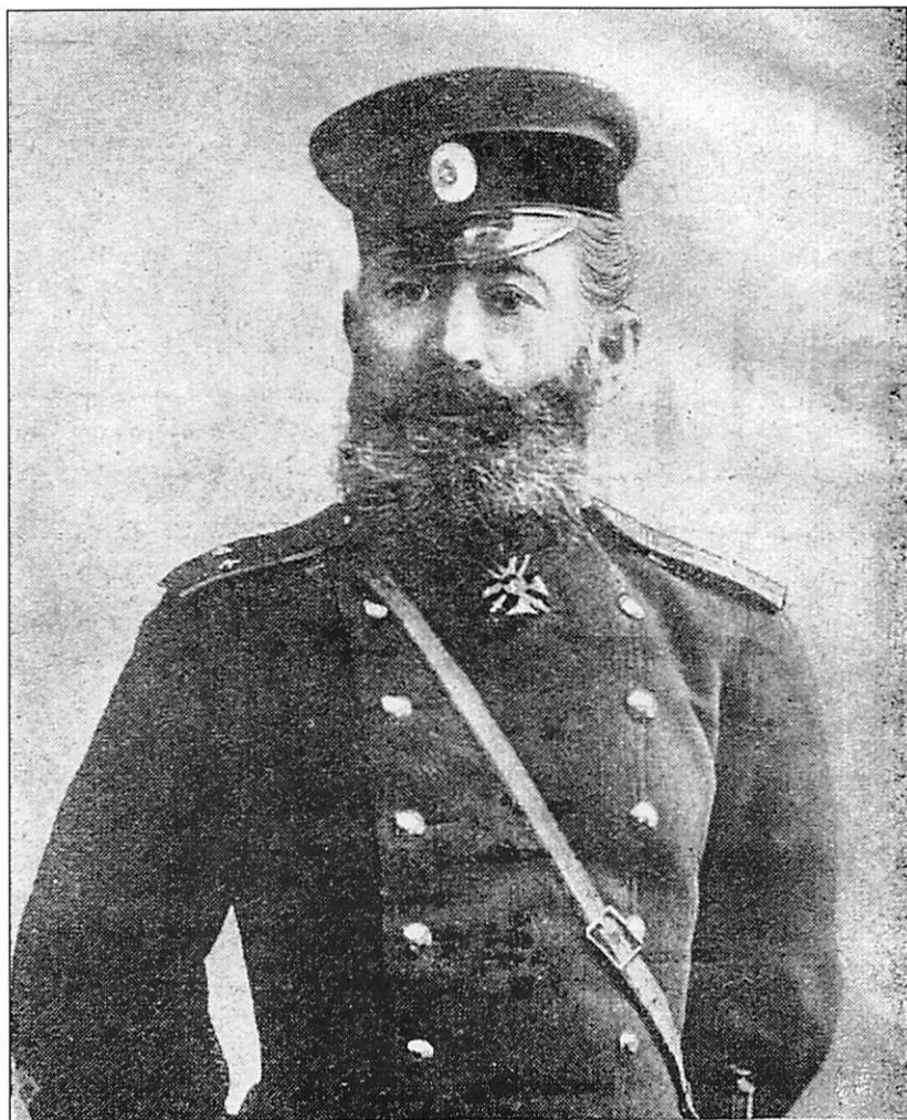
Генералъ-маіоръ САМЕДЪ-БЕКЪ-САДЫКЪ-БЕКЪ-МЕХМАНДАРОВЪ, командиръ 7-й Вост.-Сиб. стр. артилерійской бри- гады. За отличія во время осады Портъ-Артура онъ былъ награжденъ орденомъ св. Георгія 4-й ст.

Иллюстрированное приложение к газете «Новое время». 8 января 1905 г. № 10367