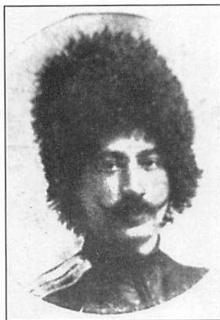
Фазулла-Мирза Каджар в чине подъесаула 2-го Дагестанскаго коннаго полка Еженедельник «Нива». 1905 г. № 18

Иллюстрированное приложение к газете «Новое время». 9 февраля 1905 г. № 10392