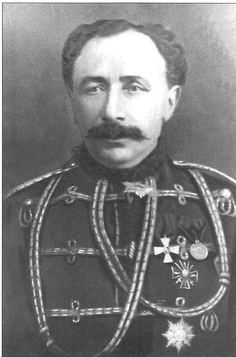
Келбали-хан Нахичеванский (Калбалай-Хан-Эксан-Хан-Оглы) в чине полковника, кавалер ордена Св. Георгия 4-й степени и Золотой сабли, украшенной алмазами, с надписью «за храбрость» Фото периода 1864 – 1871 гг.