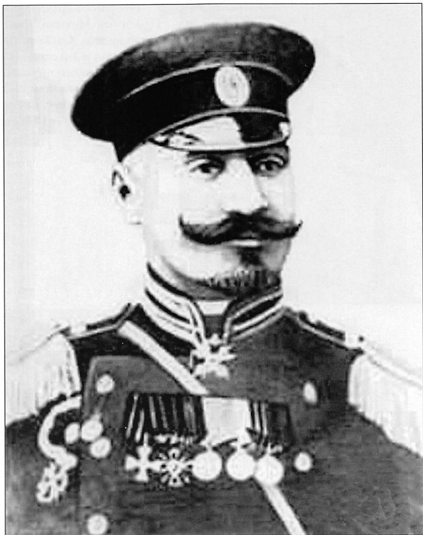
Генерал Али-ага Шихлинский, кавалер ордена Св. Георгия 4-й степени и Золотого оружия с надписью «за храбрость» Фото 1913 г.