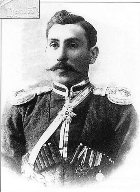
Дараб-Мирза Каджар (Шах-Рух-Дараб-Мирза) Фото периода 1901 – 1908 гг.