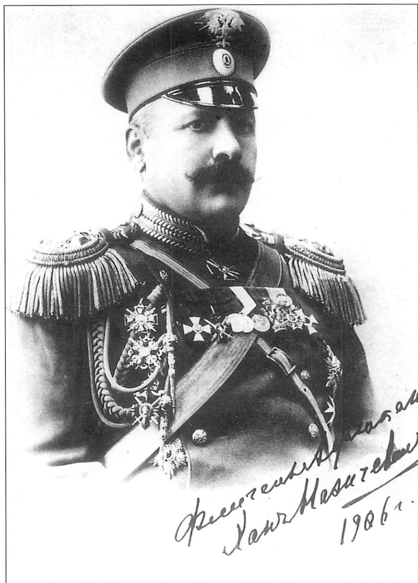
Гусейн-хан Нахичеванский в чине полковника, кавалер ордена Св. Георгия 4-й степени и Золотого оружия с надписью «за храбрость» Фото 1906 г.