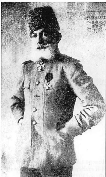
Военный министр Азербайджанской Республики генерал от артиллерии Самед-бек Мехмандаров Фото периода 1919 – 1920 гг.