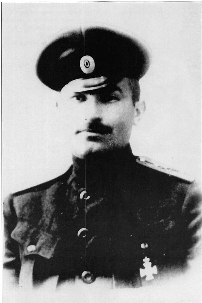
Фаррух-ага Гаибов Фото периода 1913 – 1916 гг.