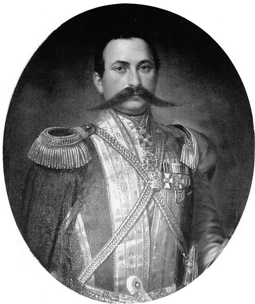
Гасан-бек Агаларов (Гассан-Бек-Агаларов) в чине полковника, кавалер ордена Св. Георгия 4-й степени Холст. Масло. Портрет периода 1853 – 1856 гг. Музей истории Азербайджана