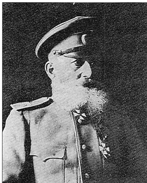
Генерал от артиллерии Самед-бек Мехмандаров, кавалер ордена Св. Георгия 4-й и 3-й степеней и Георгиевского оружия, украшенного бриллиантами Фото периода 1915 – 1916 гг.