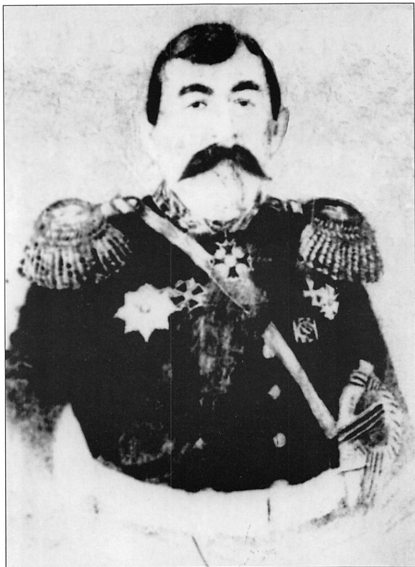
Генерал Джафар-Кули-ага Бакиханов, кавалер ордена Св. Георгия 4-й степени и Золотой сабли с надписью «за храбрость» Фото периода 1856 – 1861 гг.