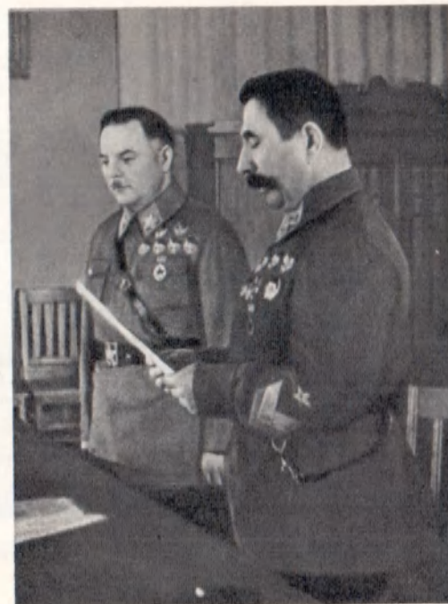
С. М. Буденный принимает новую военную присягу. Москва, 22 февраля 1939 г.