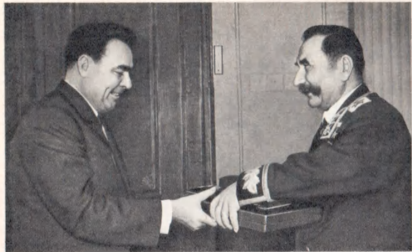
Председатель Президиума Верховного Совета СССР Л. И. Брежнев вручает С. М. Буденному вторую Золотую Звезду Героя Советского Союза. Апрель 1963 г.