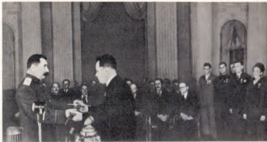
С. М. Буденный передает представителям трудящихся Сталинграда меч — дар короля Великобритании Георга VI. Москва, 2 февраля 1944 г.