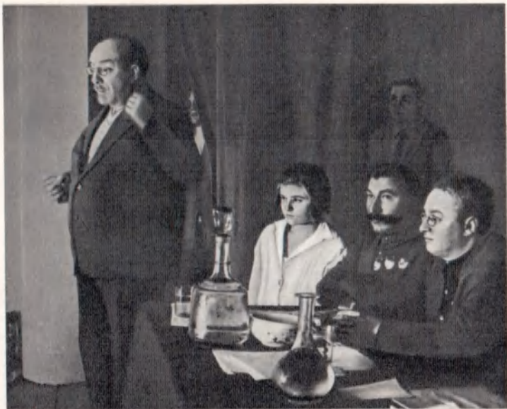
Торжественное собрание, посвященное 5-летию газеты «Батрак». Выступает нарком просвещения СССР А. В. Луначарский. Москва, 1929 г.