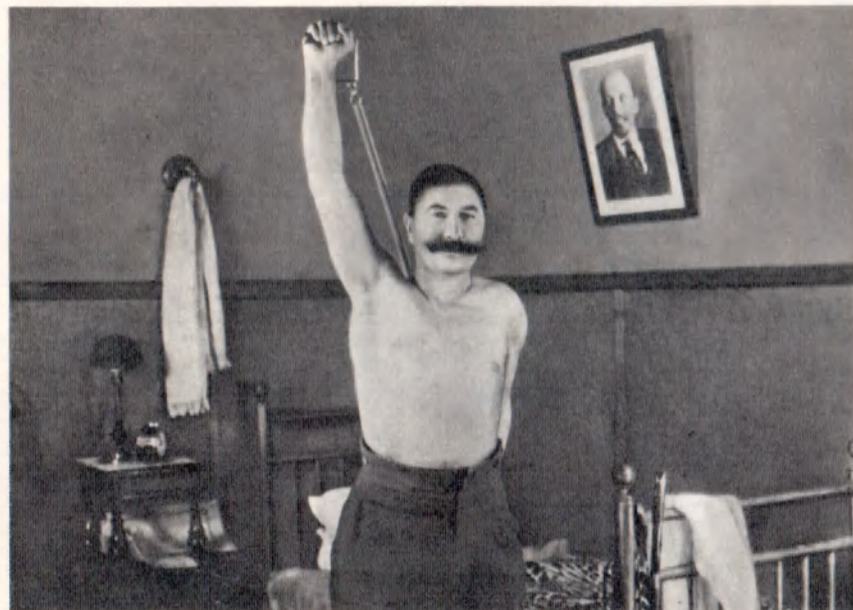
Утренняя зарядка. 1931 г.