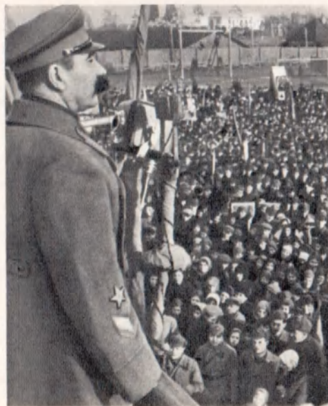
Встреча с избирателями. Шепетовка, март 1938 г.