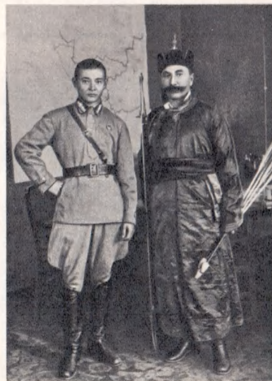
Главком монгольской Народно-революционной армии Х. Чойбалсан и С. М. Буденный. Москва, июнь 1926 г.