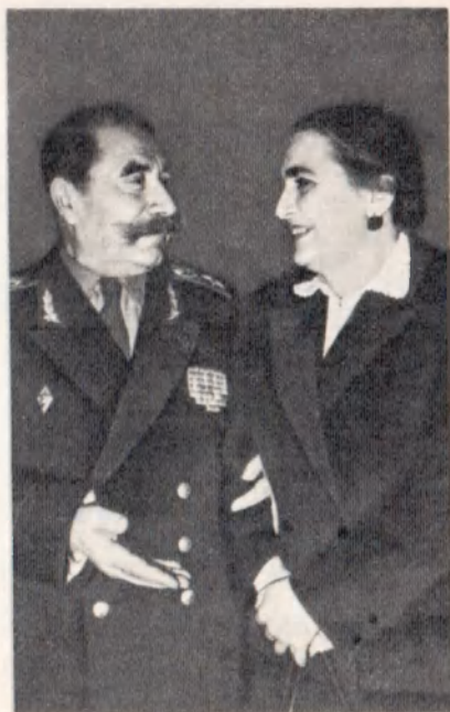
Е. Н. Гоголева и С. М. Буденный.