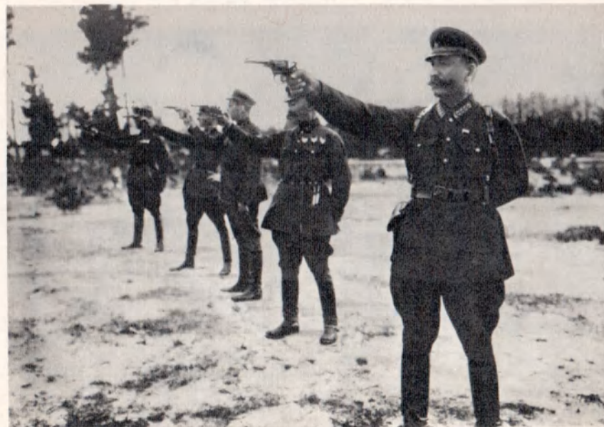
На стрельбище. 1931 г.