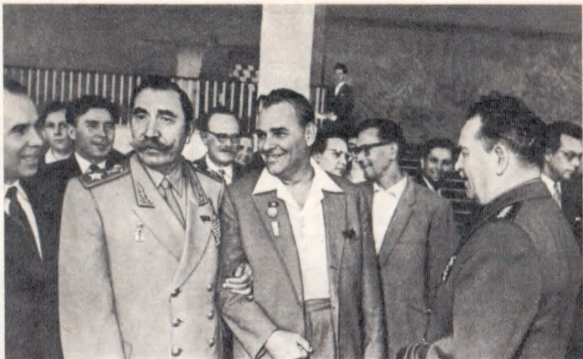
С. М. Буденный и Е. В. Вучетич — делегаты Всемирного конгресса за всеобщее разоружение и мир. Москва, 1962 г.