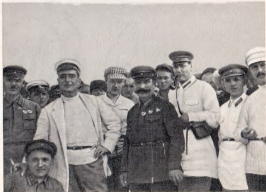
В. В. Куйбышев и С. М. Буденный на конном заводе в Ростовской области. 1930 г.