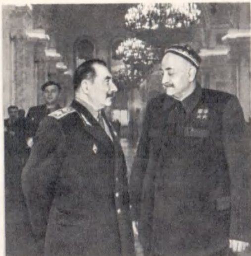
С. М. Буденный и бывший проводник командарма председатель колхоза «Шарк Юлдуз» Янгиюльского района Ташкентской области Х. Турсункулов в перерыве между заседаниями XX съезда КПСС.

С. М. Буденный и игравший роль командарма в пьесе Вс. Вишневского «Первая Конная армия» артист А. Г. Вовси после спектакля. Москва, 1957 г.