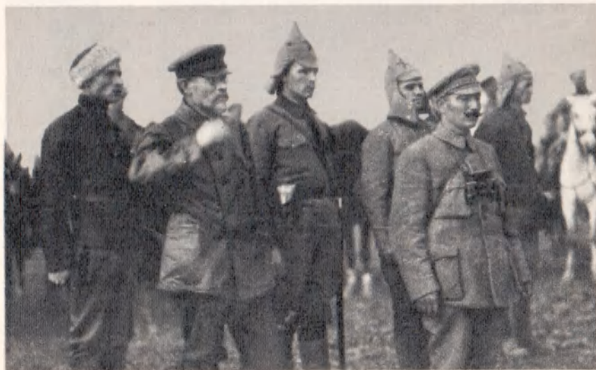
Председатель ВЦИК М. И. Калинин и С. М. Буденный принимают парад частей Первой Конной армии. Май 1920 г.