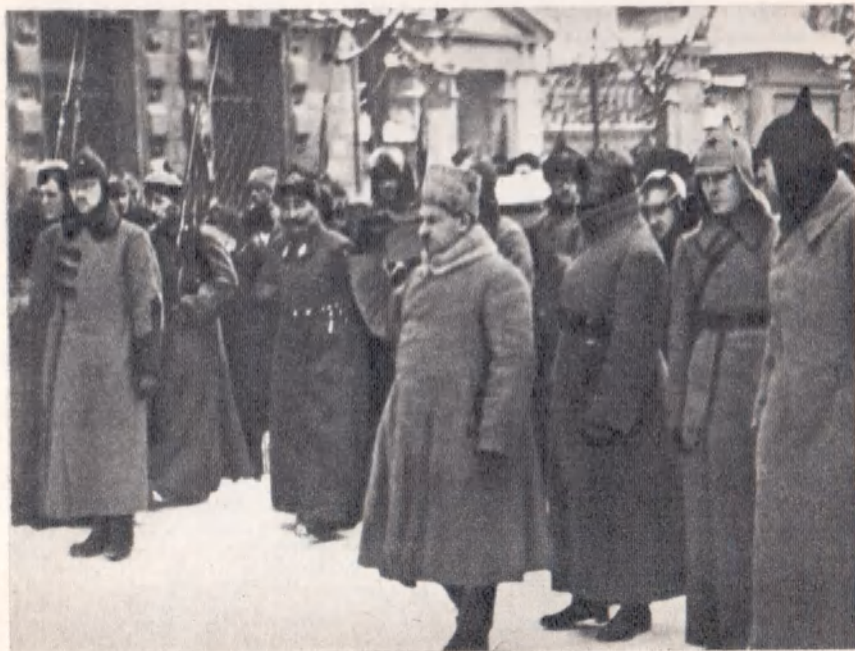
Похороны В. И. Ленина. Москва, январь 1924 г.