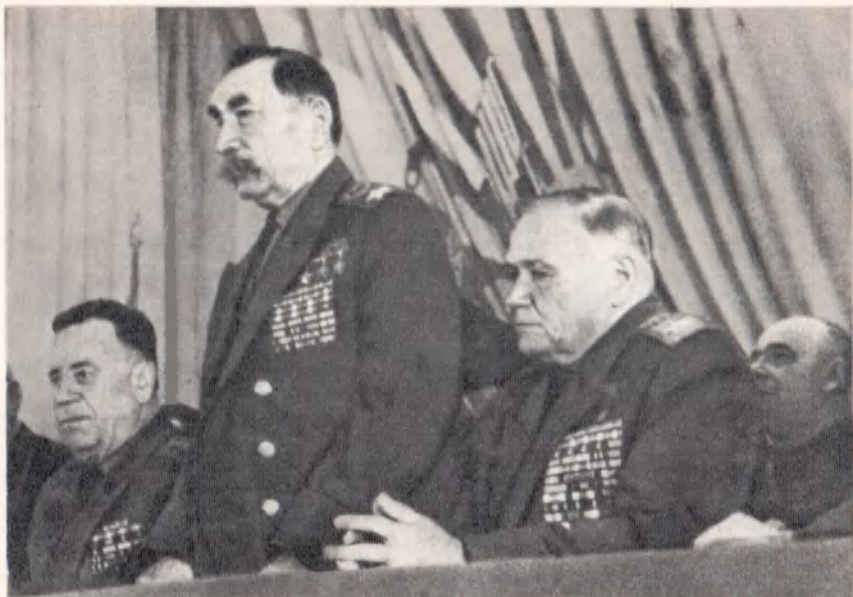
В президиуме торжественного собрания, посвященного 50-летию Первой Конной армии. Слева направо: начальник Главного политического управления СА и ВМФ А. А. Епишев, С. М. Буденный и А. И. Еременко. Ноябрь 1969 г.