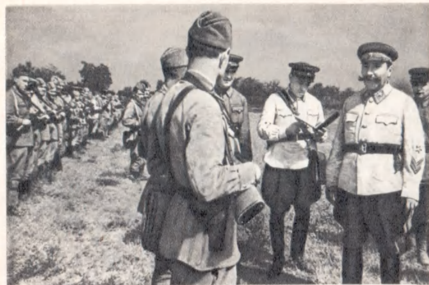
В войсках Северо-Кавказского направления.