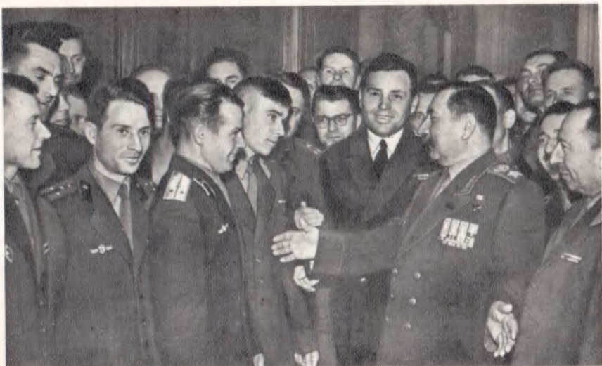
Беседа с офицерами — участниками Всеармейского совещания секретарей первичных партийных организаций. Москва, май 1960 г.