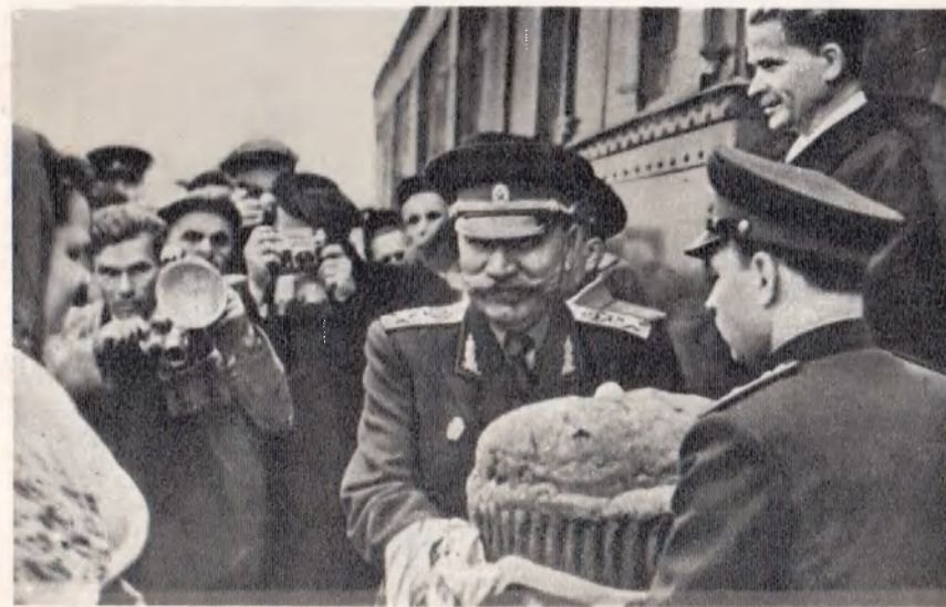
Встреча в Каховке. Сентябрь 1957 г.