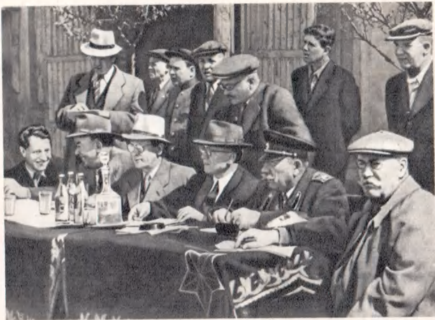
Комиссия на выводке лошадей. Москва, 1952 г.

Командующий кавалерией Советской Армии Маршал Советского Союза С. М. Буденный на учениях кавалерийских частей. Северо-Кавказский военный округ, 1948 г.