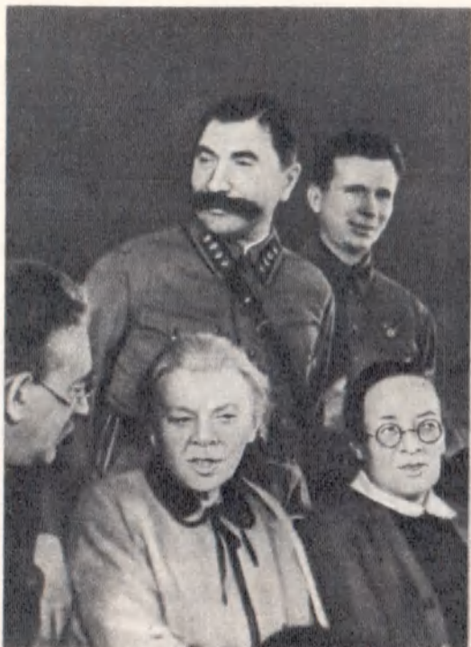
С. М. Буденный, Е. М. Ярославский, М. И. Ульянова, Р. С. Землячка. Москва, 1933 г.

Первые Маршалы Советского Союза: М. Н. Тухачевский, С. М. Буденный, К. Е. Ворошилов, В. К. Блюхер, А. И. Егоров. Москва, 1935 г.