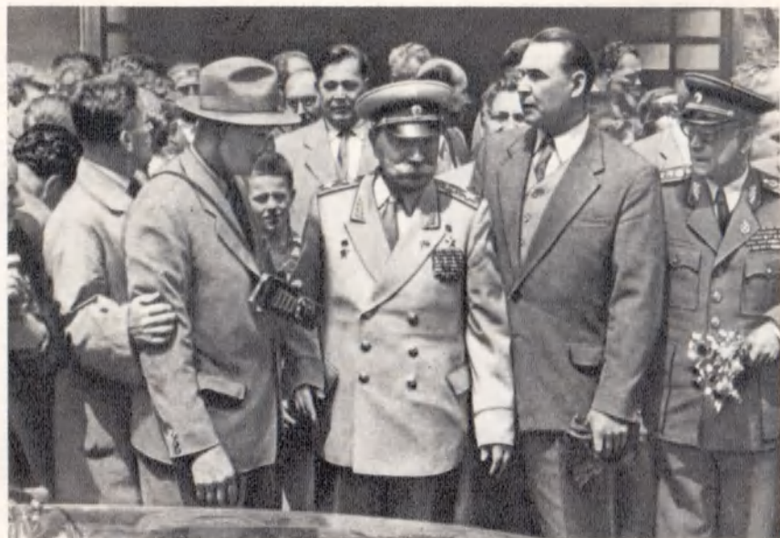
Среди пражан. 1960 г.