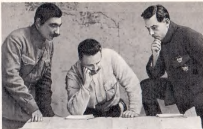
С. М. Буденный, М. В. Фрунзе и К. Е. Ворошилов. Южный фронт, 1920 г.

Участники 1-го съезда красноармейцев, командиров и политработников Первой Конной армии. Екатеринослав (Днепропетровск), декабрь 1920 г.