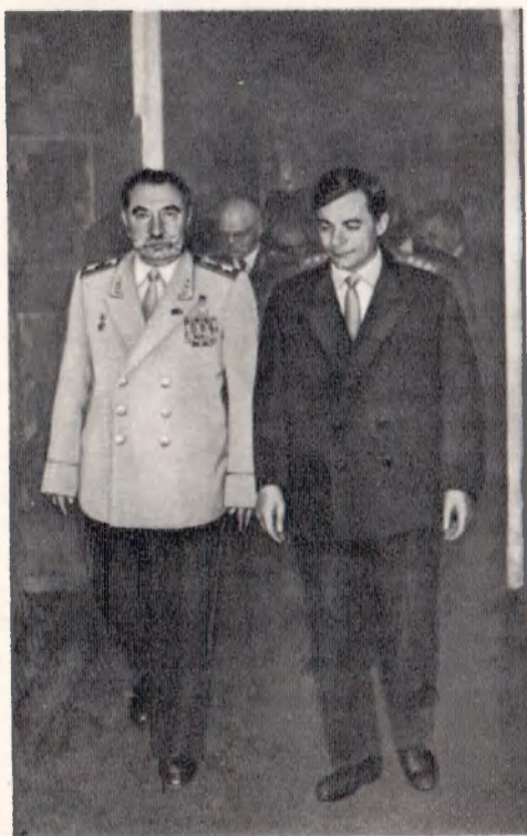
С. М. Буденный и Чрезвычайный и Полномочный посол Советского Союза в Чехословакии М. В. Зиянин. Прага, июнь 1960 г.