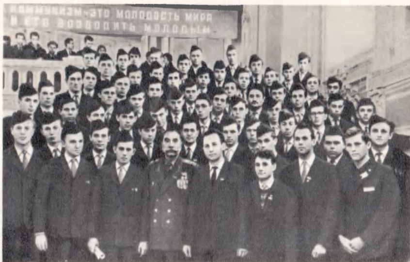
Среди делегатов XVI Московской городской конференции ВЛКСМ. Февраль 1964 г.