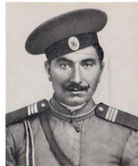
Старший унтер-офицер Приморского драгунского полка С. М. Буденный. Владивосток, 1912 г.

Немецко-фашистские войска продолжали расширять прорыв в направлении Бердичев, Белая Церковь, охватывая правый фланг 6-й армии. Одновременно обозначился прорыв на стыке Юго-Западного и Южного фронтов. Это создало угрозу окружения 12-й и 18-й армий. Чтобы не допустить этого, главком обратился в Ставку за разрешением отвести 6-ю и 12-ю армии на рубеж Белая Церковь, Гайсин, а 18-ю армию — на рубеж Тро-