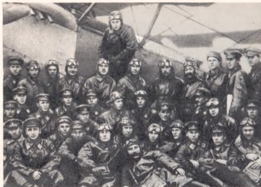
Слушатель Военной академии имени М. В. Фрунзе С. М. Буденный на летной стажировке. Лагерь Московского военного округа, 1931 г.