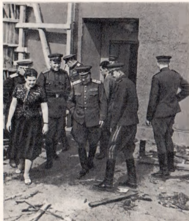
Берлин, май 1945 г.

стянец, Каменка. Разрешение было получено, и отход осуществлен. Вскоре, однако, положение опять обострилось. Маршал был вынужден вновь просить Ставку разрешить отход войск на рубеж Звенигородка, Рошково. И на этот раз был получен положительный ответ. Для обеспечения отхода главком потребовал, как и в предыдущих случаях, чтобы отходящие армии провели контратаки и контрудары по обходящим группировкам врага*.