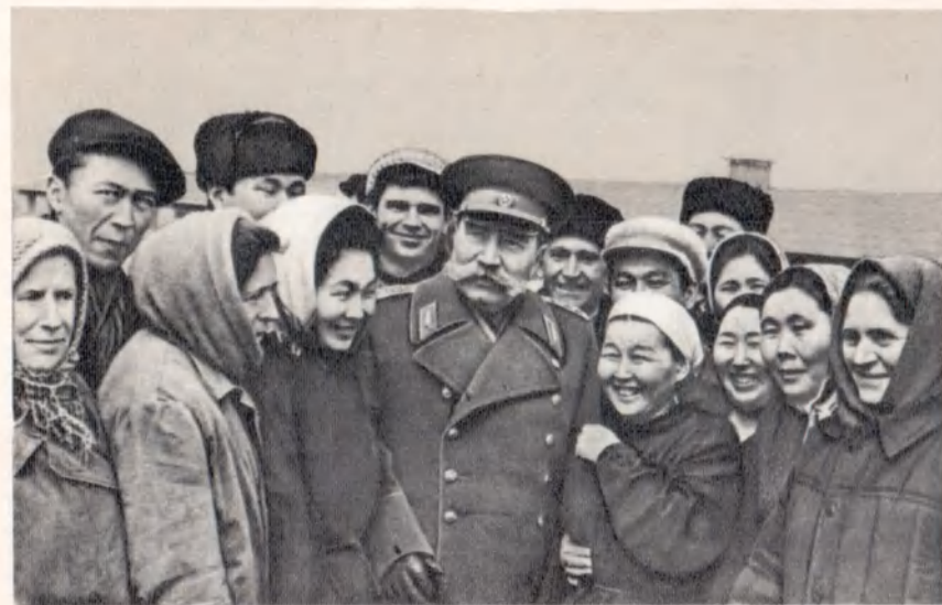
В совхозе села Вознесенка Целинного района Калмыцкой АССР. 1965 г.