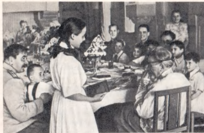
М. И. Калинин и С. М. Буденный среди артековцев. Май 1946 г.