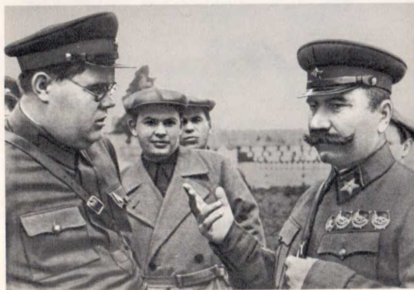
На открытии одного из лагерей Московского военного округа. Слева секретарь МГК ВКП (б), член Военного совета округа А. С. Щербаков. Май 1939 г.