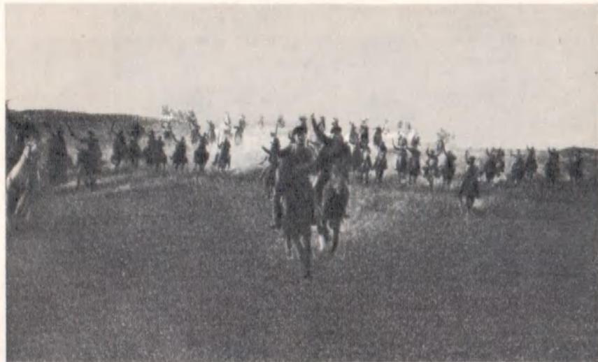
Кавалерийский эскадрон в атаке. Польский фронт, 1920 г.