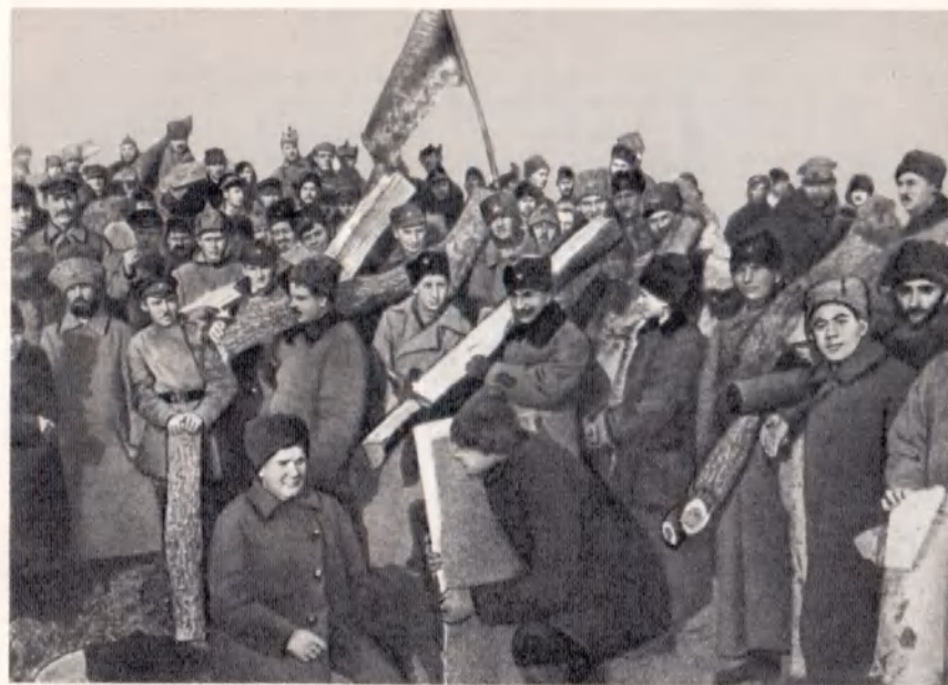
С. М. Буденный, А. С. Бубнов и К. Е. Ворошилов на коммунистическом субботнике. Новомосковск Днепропетровской области, 1921 г.

С. М. Буденный с командирами и политработниками Особой кавалерийской бригады. Кубань, станица Ново-Величковская, март 1922 г.