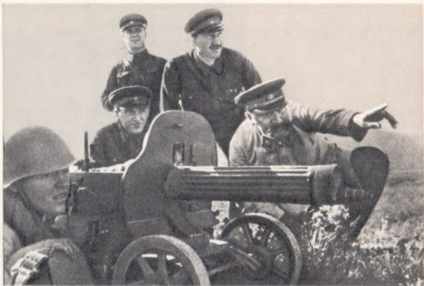
На учениях войск Московского военного округа. Сентябрь 1940 г.