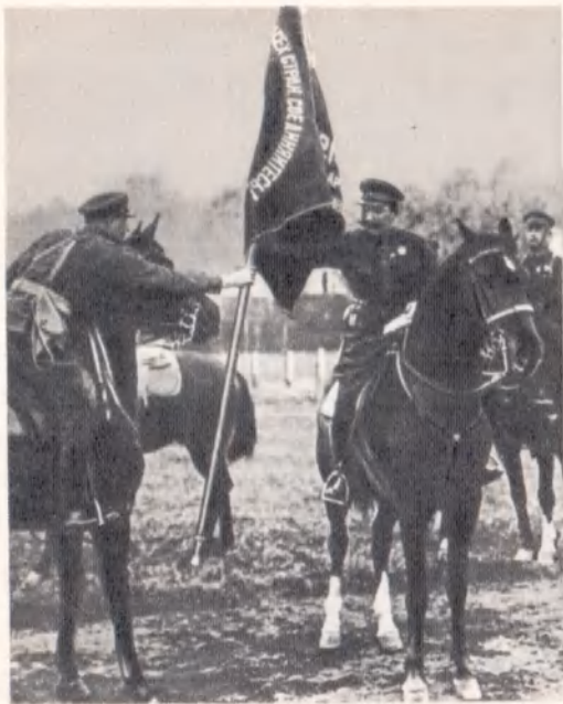
С. М. Буденный передает знаменосцу Красное знамя ВЦИК, врученное М. И. Калининым Первой Конной армии. Кубань, станица Лабинская, май 1923 г.