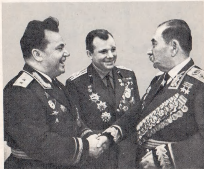
И. Н. Кожедуб и Ю. А. Гагарин поздравляют С. М. Буденного в связи с вручением ему третьей Золотой Звезды Героя Советского Союза. Март 1968 г.