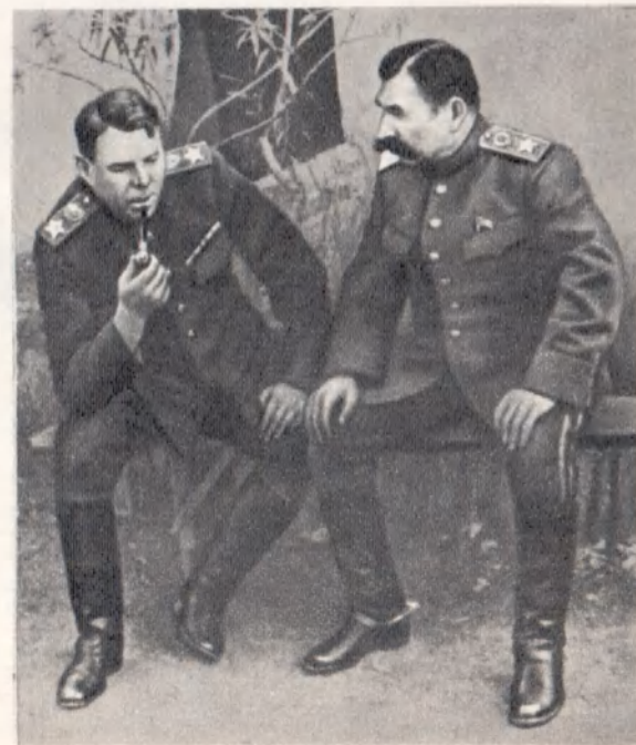
А. М. Василевский и С. М. Буденный на Южном фронте. Сентябрь 1943 г.