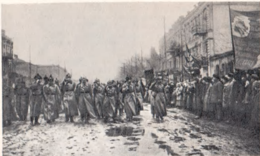
Парад частей Первой Конной армии в Ростове-на-Дону.