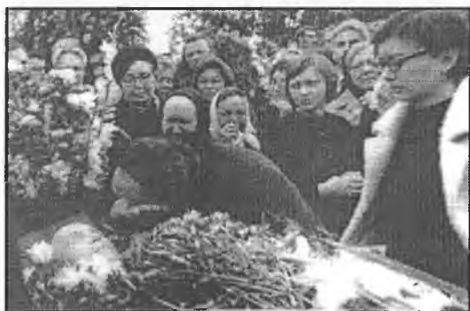
В последний путь