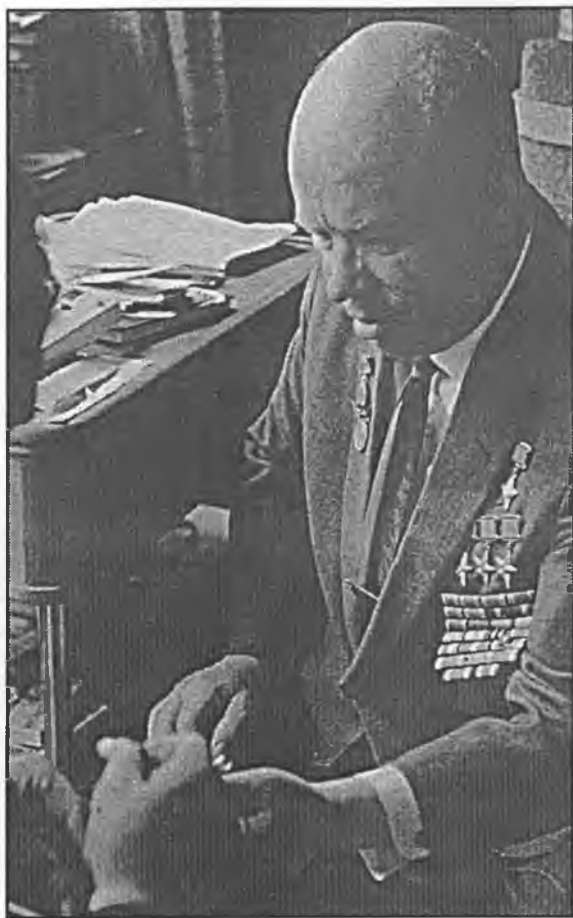
В начале 60-х годов