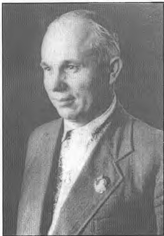
30-е годы: первый коммунист Москвы