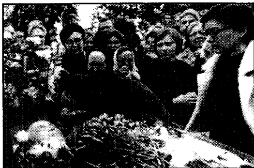
В последний путь