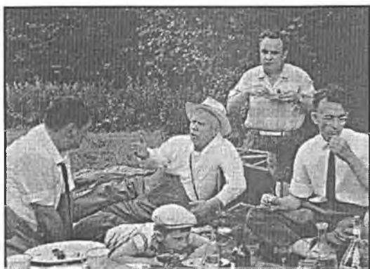
С друзьями на пикнике