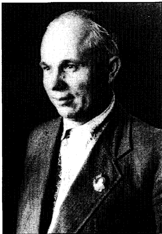
30-е годы: первый коммунист Москвы