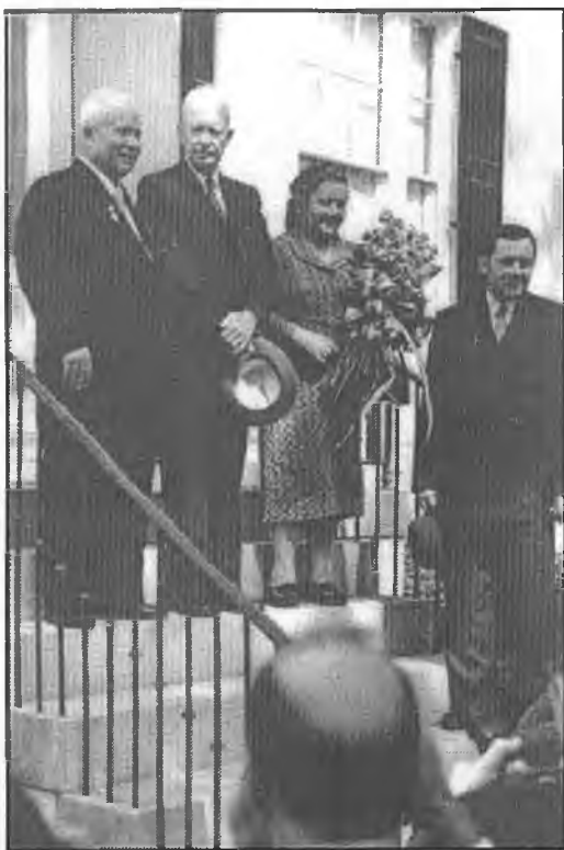
Хрущев доволен визитом в США. В мире повеяло разрядкой