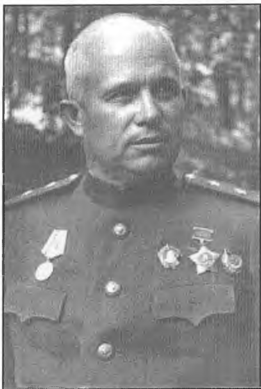
Хрущев в годы войны