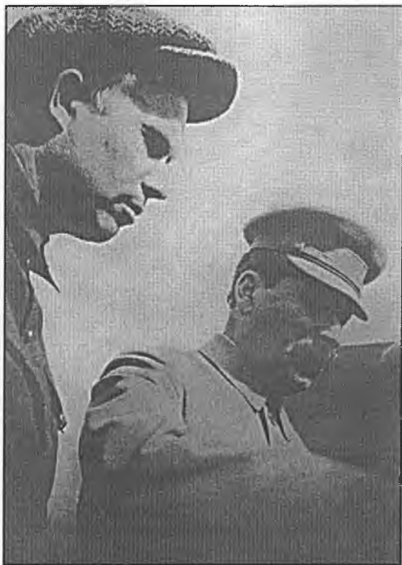
Со Сталиным на Первомайской демонстрации в Москве. 1932 г.