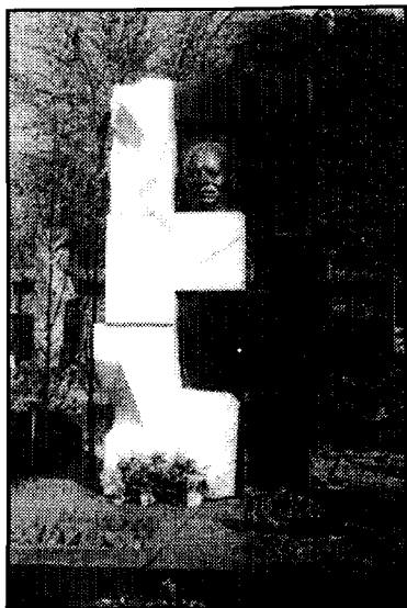
Надгробный памятник на Новодевичьем кладбище работы Эрнста Неизвестного

Центральный Комитет КПСС и Совет Министров СССР с прискорбием извещают, что 11 сентября 1971 года после тяжелой, продолжительной болезни на 78 году жизни скончался бывший первый секретарь ЦК КПСС и председатель Совета Министров СССР, персональный пенсионер Никита Сергеевич Хрущев.