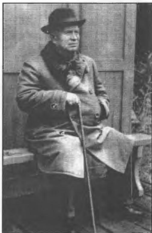
Последний год жизни