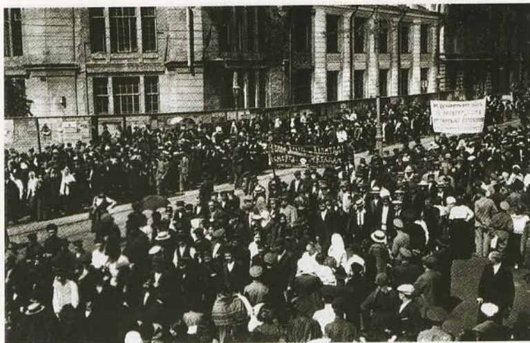
Июльская демонстрация в Петрограде. 1917.

Верные правительству части, вызванные в июле 1917 года с фронта для подавления беспорядков.