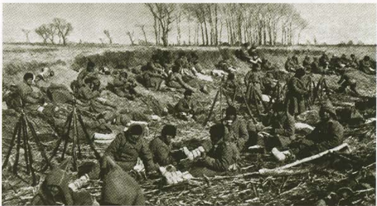
Отдых русских солдат в Маньчжурии. 1904.