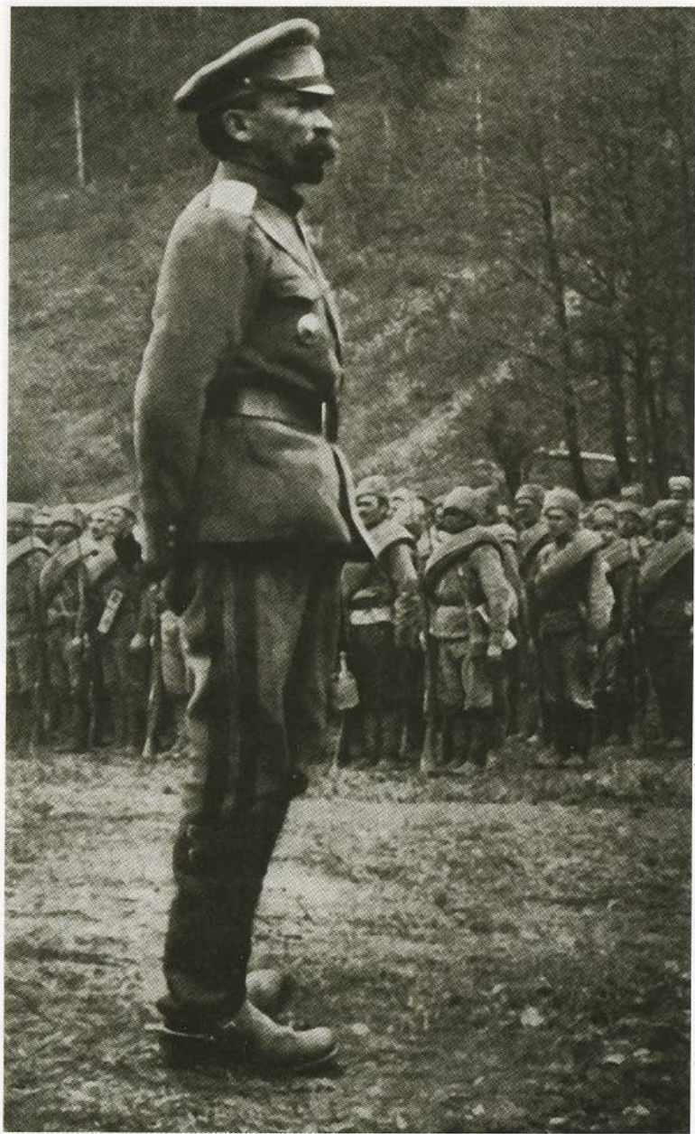
Главнокомандующий Л. Г. Корнилов перед строем солдат. 1917.