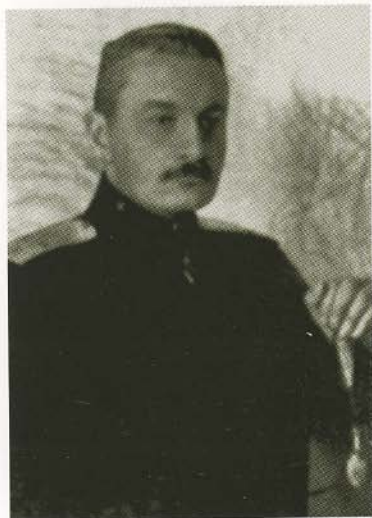
Генерал-лейтенант И. П. Романовский.