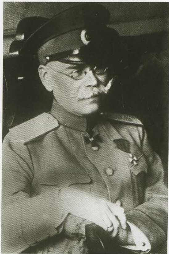
Верховный руководитель Добровольческой армии генерал от инфантерии М. В. Алексеев.