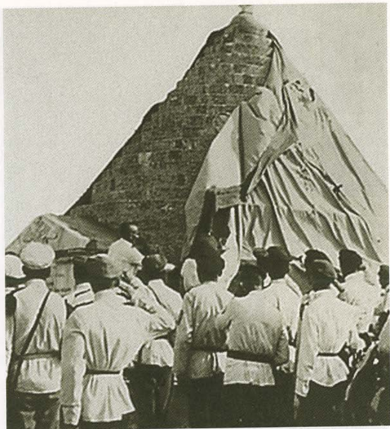
Открытие памятника Белому движению в Галлиполи. 1921.