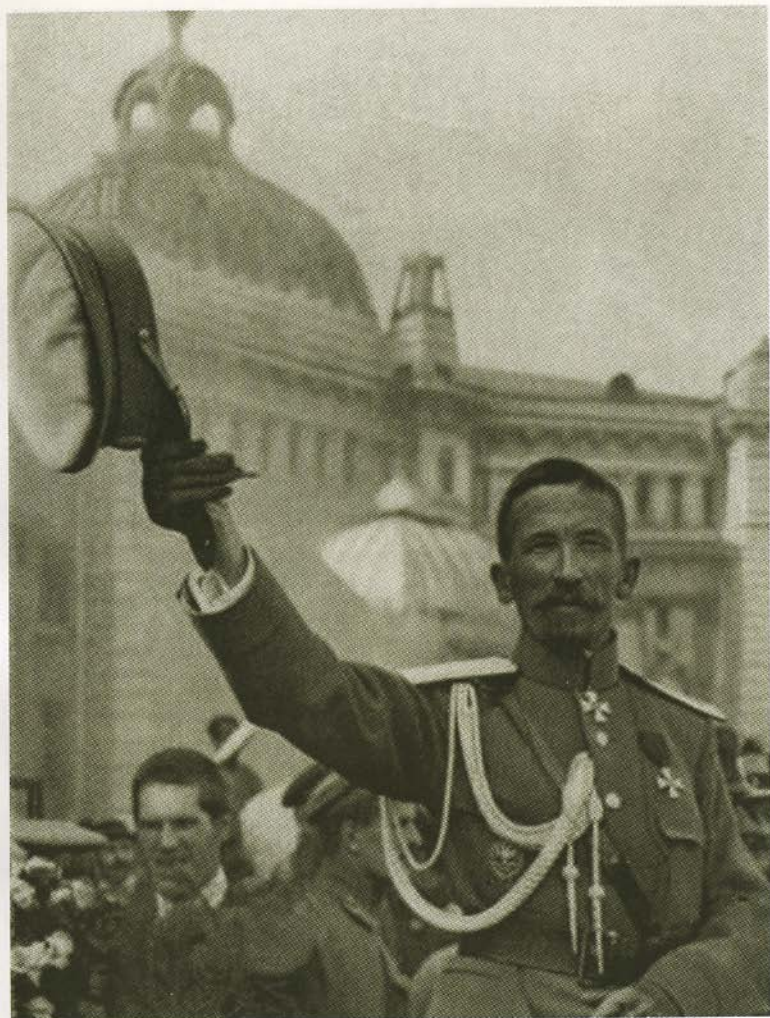
Лавр Георгиевич Корнилов в 1917 году.