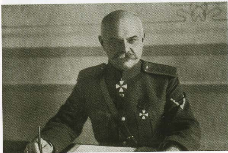
Генерал от кавалерии А. М. Драгомиров.