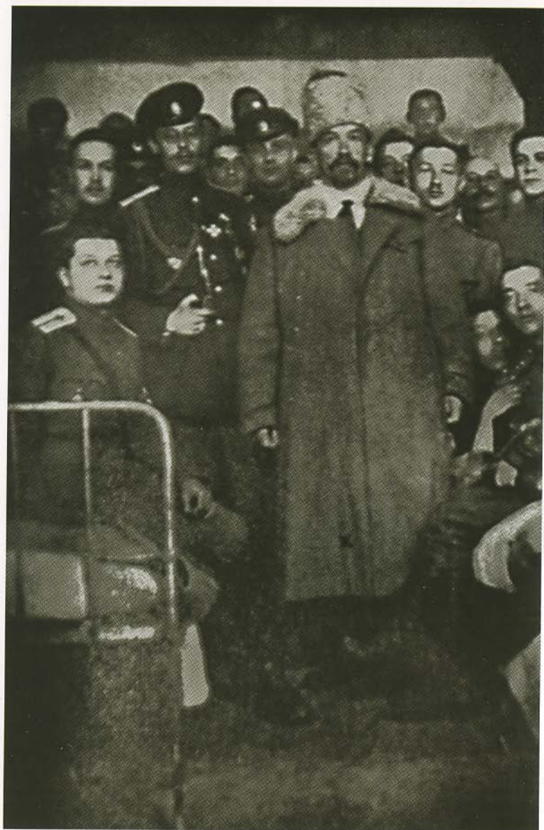
Л. Г. Корнилов в офицерской казарме в Ростове-на-Дону. Слева от него — подполковник М. О. Неженцев. Январь 1918 г.