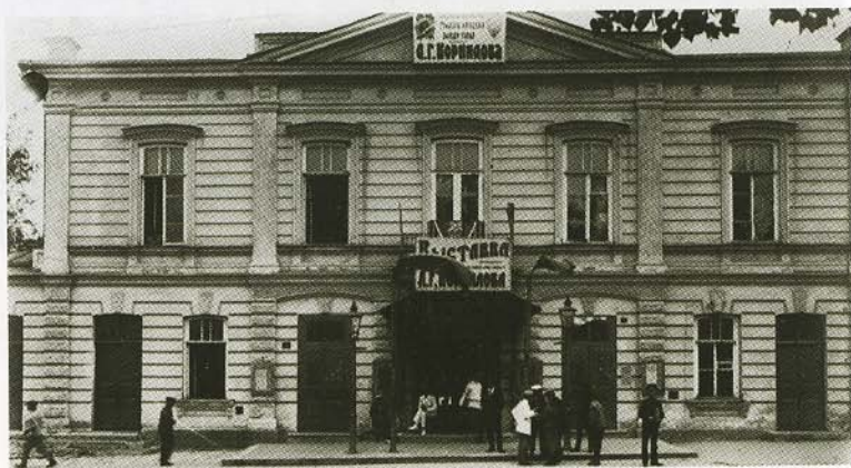
Здание в Таганроге, в котором летом 1919 года проходила выставка, посвященная памяти Л. Г. Корнилова. Публикуется впервые.