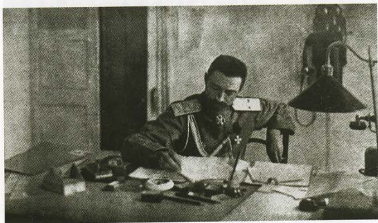
Генерал-лейтенант С. Л. Марков.