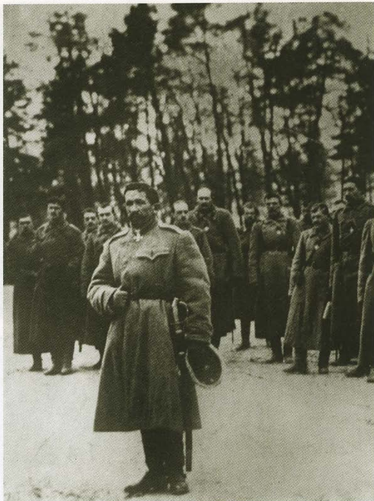
Молитва о России. Л. Г. Корнилов перед строем 25-го армейского корпуса. 1916.