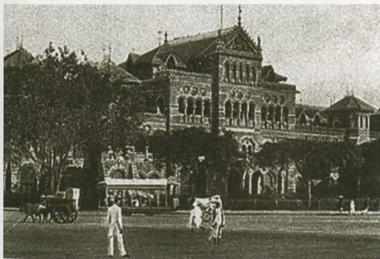
Административное здание в Бомбее. Английская открытка начала XX в.