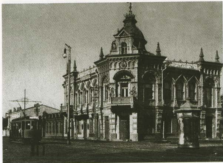
Екатеринодар. Открытка начала XX в.