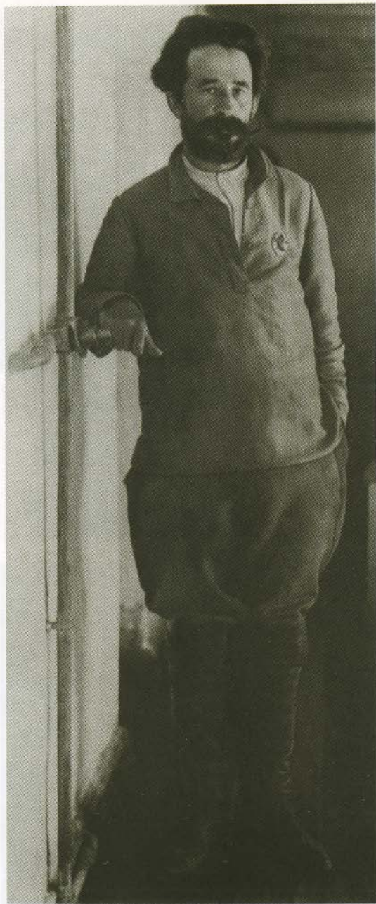
Командующий красным Донским корпусом Филипп Миронов в Балашовской тюрьме в ожидании расстрела. Революция начинает пожирать своих героев. 1919.