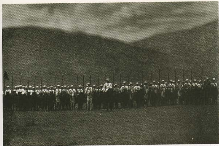
Сибирские казаки в походе. Фото конца XIX в.