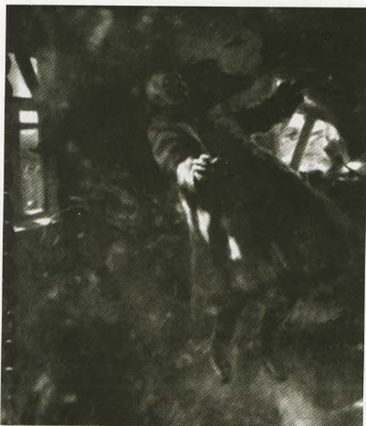
Смерть генерала Корнилова. Картина неизвестного художника, составлявшая центр экспозиции передвижной выставки, посвященной памяти Л. Г. Корнилова. 1919.