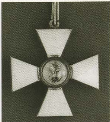
Награды Корнилова: знак ордена Святого Георгия III степени, Золотое оружие «За храбрость».