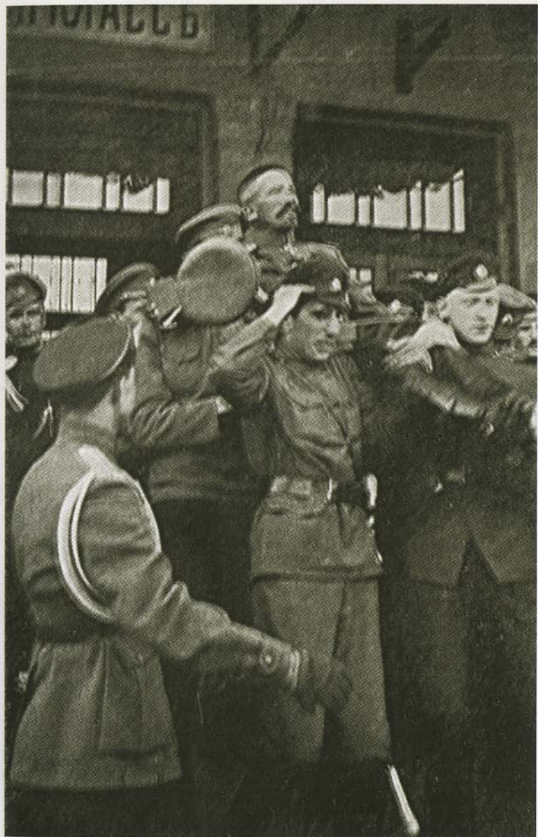
Встреча Л. Г. Корнилова на Александровском (ныне Белорусском) вокзале в Москве.