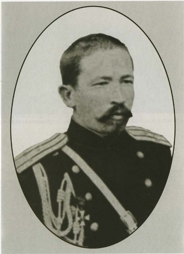
Подполковник Генерального штаба Л. Г. Корнилов, штаб-офицер при управлении 1-й стрелковой бригады. 1905.