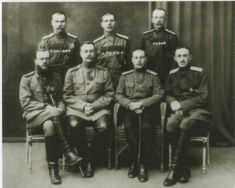
Группа георгиевских кавалеров.