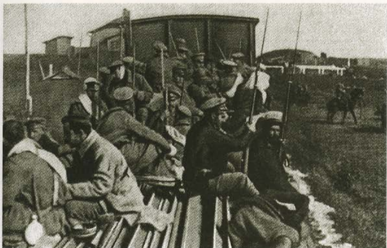
Бегство солдат с фронта. 1917.

Глава Временного правительства А. Ф. Керенский (второй справа) с ближайшими помощниками в бывшей царской библиотеке Зимнего дворца (третий слева — Б. В. Савинков).