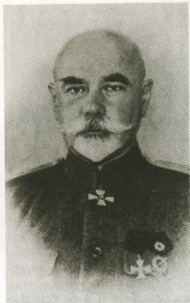
Преемник Корнилова на посту командующего генерал-лейтенант А. И. Деникин. 1918.