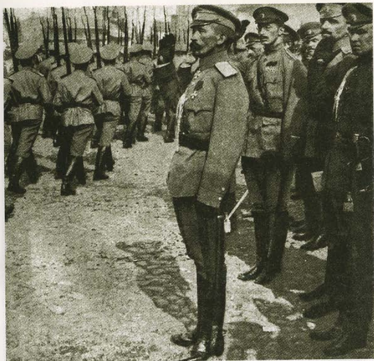
Генерал от инфантерии Л. Г. Корнилов принимает парад юнкеров Александровского военного училища 13 августа 1917 года в Москве.

Вокзал Могилева, через который шло сообщение Ставки главнокомандующего русской армией в 1917 году. Открытка начала XX в.