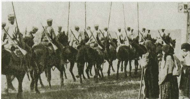
Русская кавалерия пересекает границу австрийской Галиции в 1916 году.