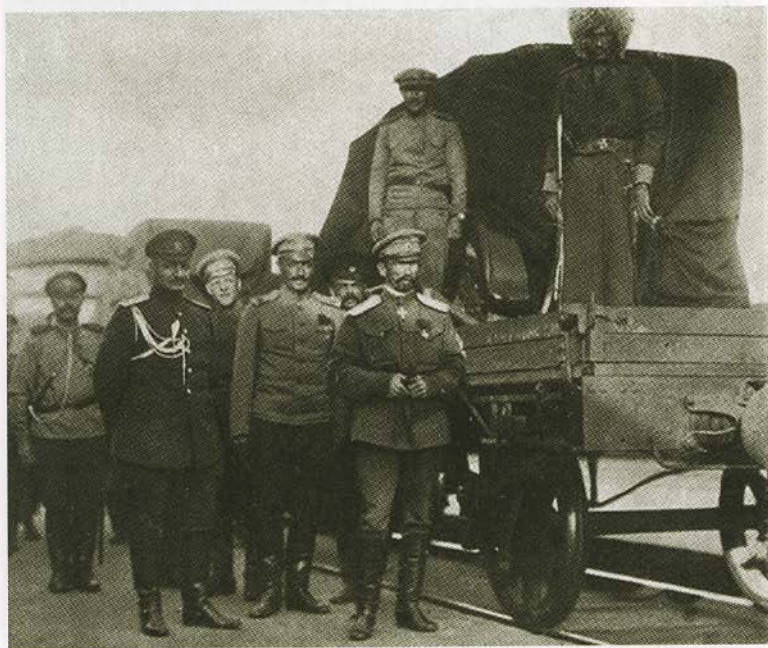
Корнилов в Москве в августе 1917 года.