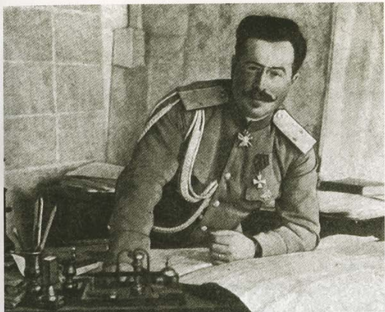
Последний Верховный главнокомандующий русской армией генерал-лейтенант Н. Н. Духонин.

Здание в Быхове, где содержались под стражей участники корниловского выступления. Сентябрь 1917 г.