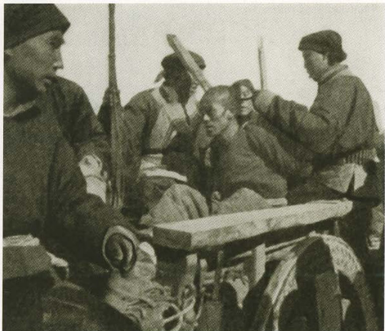
Пленные китайские хунхузы.