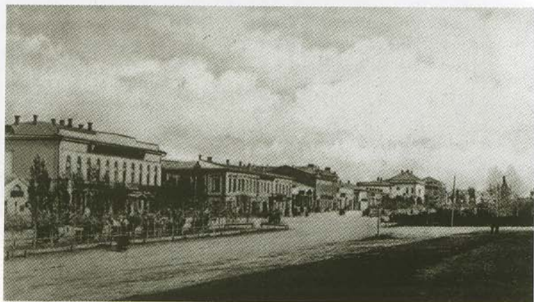
Новочеркасск. Открытка начала XX в.