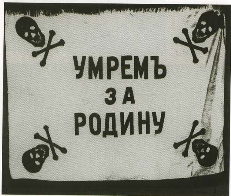
Знамя одного из «полков смерти». 1917—1918 гг.