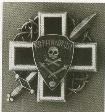
Знак Корниловского ударного полка. Утвержден председателем Русского общевойскового союза 12 июля 1931 года в Париже.