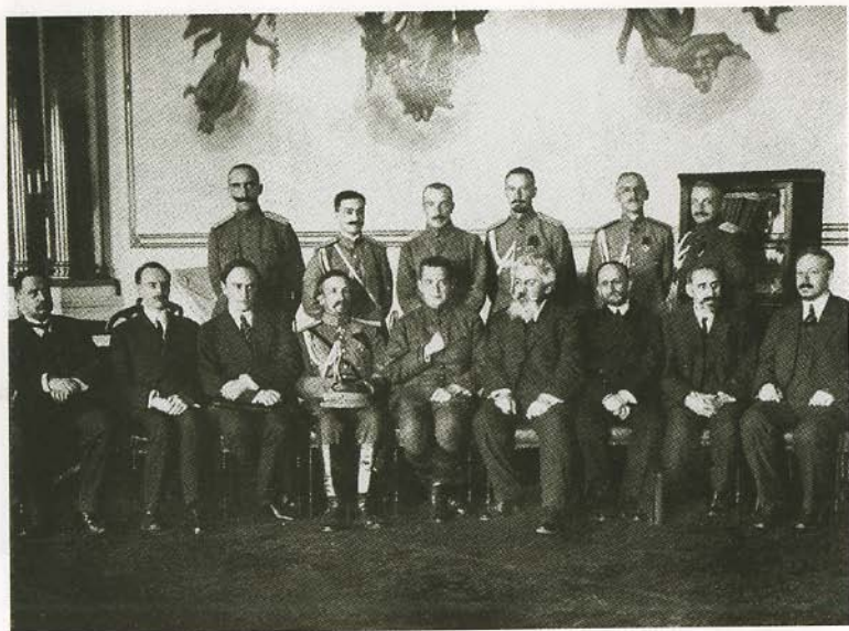
Временное правительство чествует генерала Корнилова. 3 августа 1917 года.

Здание Большого театра в Москве, в котором в августе 1917 года проходило Государственное совещание.