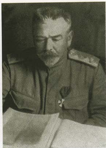
Генерал-лейтенант А. С. Лукомский.