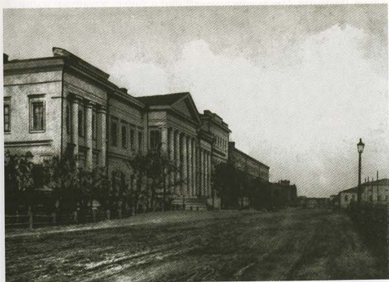
Сибирский кадетский корпус в Омске. Открытка конца XIX в.