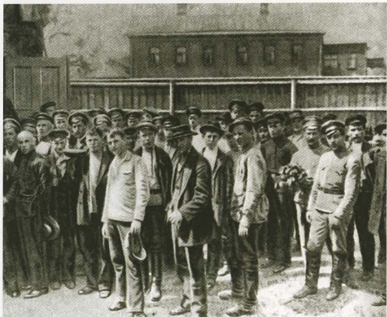
Мобилизация рабочих для отпора Корнилову в августе 1917 года.