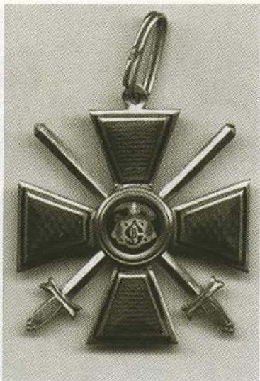
Знак ордена Святого Владимира III степени с мечами.