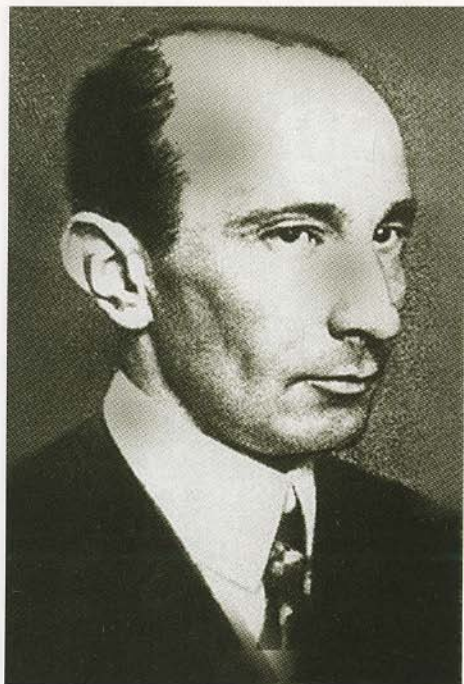
Б. В. Савинков.

Командующий Петроградским военным округом генерал П. А. Половцов проводит смотр частей женского батальона М. Л. Бочкаревой.