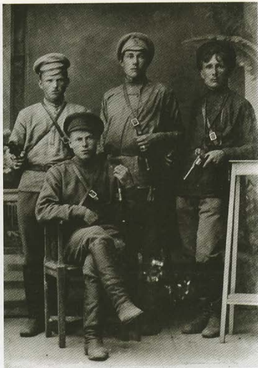
Группа командиров частей Красной гвардии на Дону. Декабрь 1917 г.