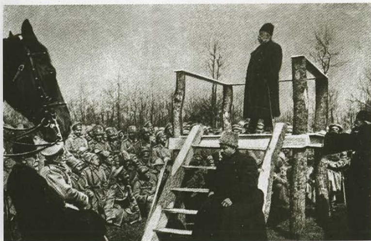
Выступление одного из комиссаров Временного правительства в действующей армии в марте-апреле 1917 года.