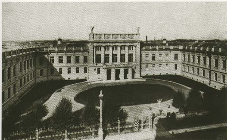
Николаевская Академия Генерального штаба. Открытка начала XX в.