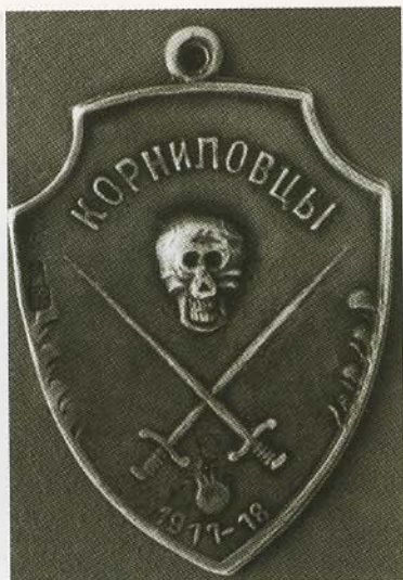
Памятный жетон, продававшийся на передвижной выставке, посвященной памяти Л. Г. Корнилова.