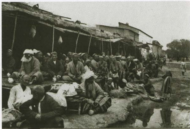
Улица Ташкента. Открытка начала XX в.