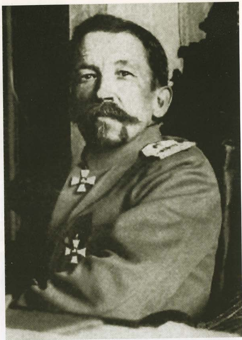
Первый командующий Добровольческой армией генерал от инфантерии Л. Г. Корнилов.