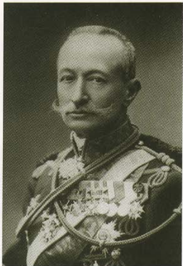
Командующий Юго-Западным фронтом генерал от кавалерии А. А. Брусилов.