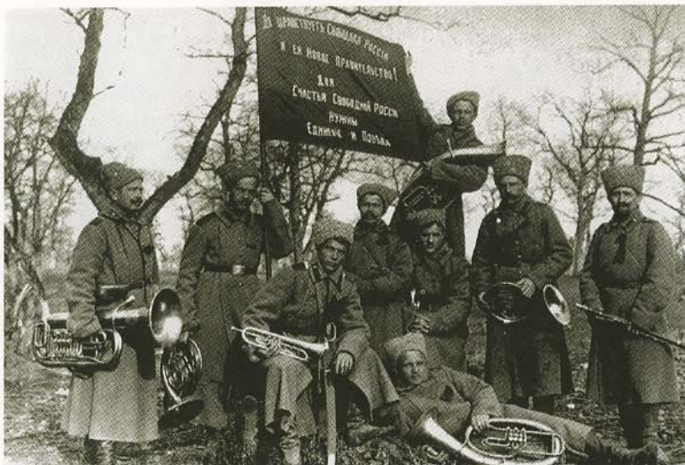
Так встречали Февральскую революцию на фронте.

Главнокомандующий Петроградским военным округом генерал-лейтенант Л. Г. Корнилов принимает в марте 1917 года парад юнкеров на Дворцовой площади Петрограда.