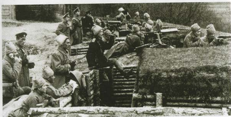
В окопах позиционной войны летом 1917 года.