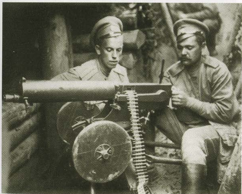
Русские пулеметчики на передовой позиции.