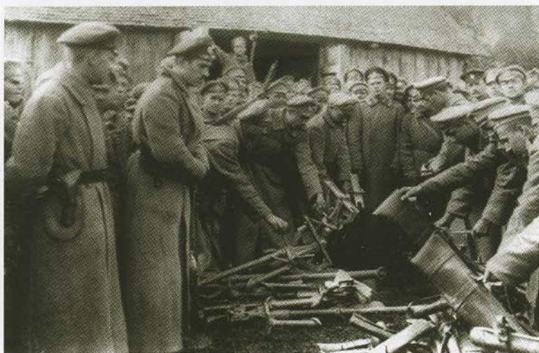
Разоружение мятежных корниловцев. Конец августа 1917 г.