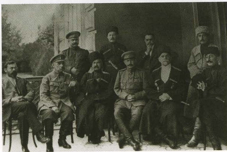
Руководители казачьих государственных образований. 1919.