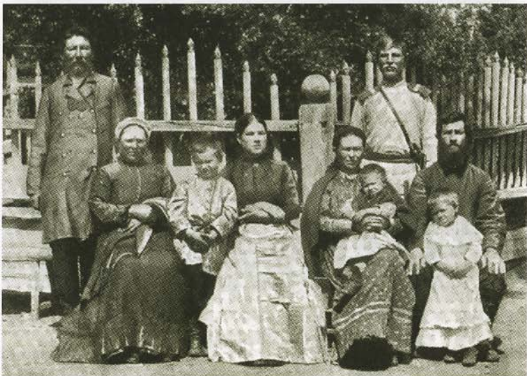
Семья сибирских казаков. Фото конца XIX в.