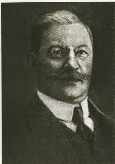
Министры Временного правительства: военный министр А. И. Гучков, министр иностранных дел и лидер кадетов П. Н. Милуков.