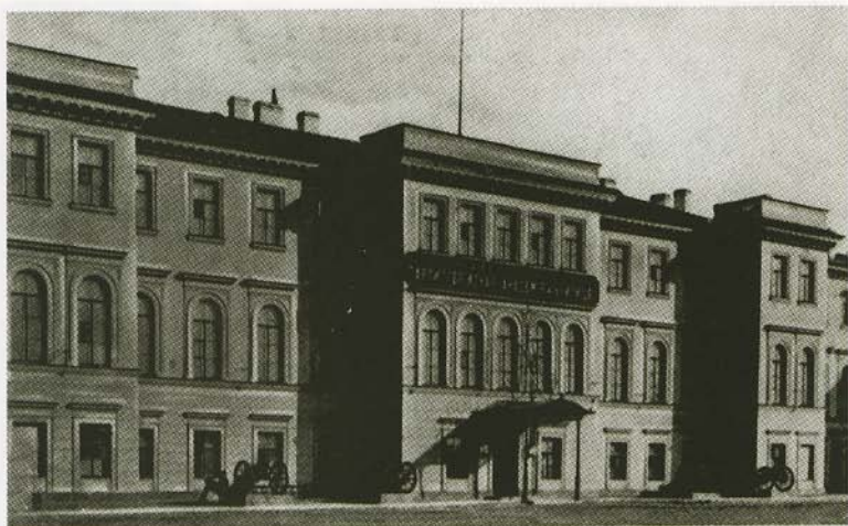
Михайловское артиллерийское училище в Петербурге. Открытка конца XIX в.