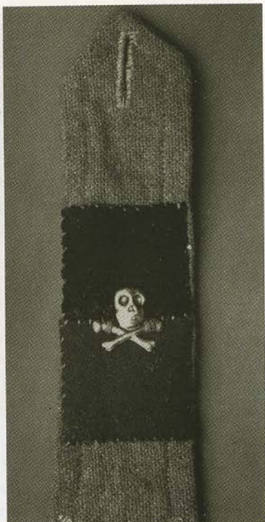
Самодельный погон рядового Корниловского полка.