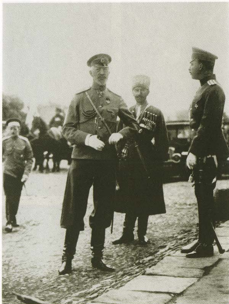
Главнокомандующий русской армией великий князь Николай Николаевич (слева). 1914.