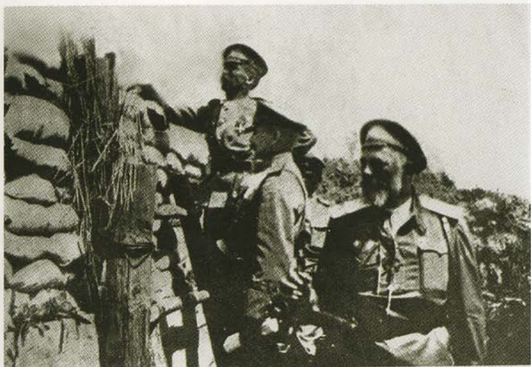
Генерал-лейтенант Л. Г. Корнилов на наблюдательном пункте. 1916.

Русская артиллерия встречает австрийскую пехоту.