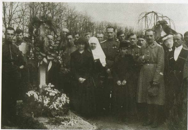
Восстановленное захоронение Л. Г. Корнилова. 1919.