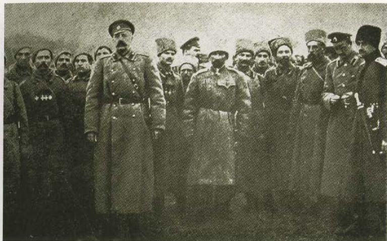
Генерал-лейтенант Л. Г. Корнилов (в центре) среди солдат и офицеров 25-го армейского корпуса. 1916.