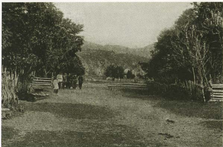
Улица Зайсана. Фото конца XIX в.