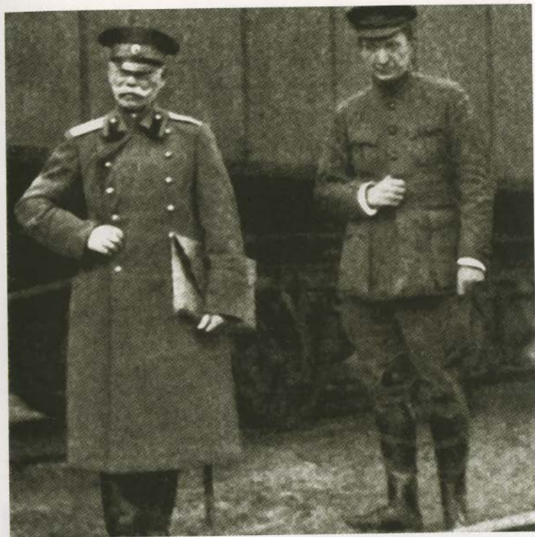
Начальник Генерального штаба М. В. Алексеев и А. Ф. Керенский летом 1917 года.