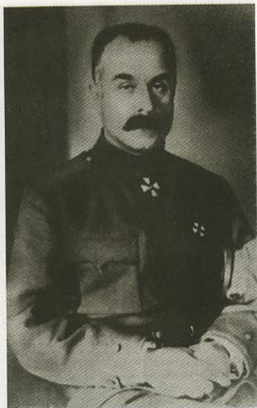
Донской атаман генерал от кавалерии А. М. Каледин.