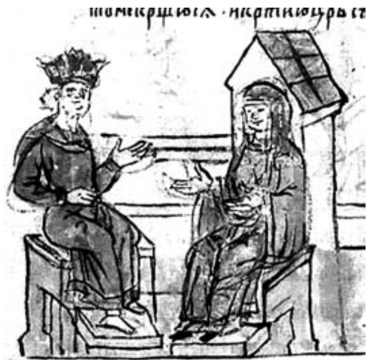
Княгиня Ольга ведет переговоры с византийским императором

В русском народном эпосе хорошо запомнилась эта черта в политическом строе Киевской Руси: