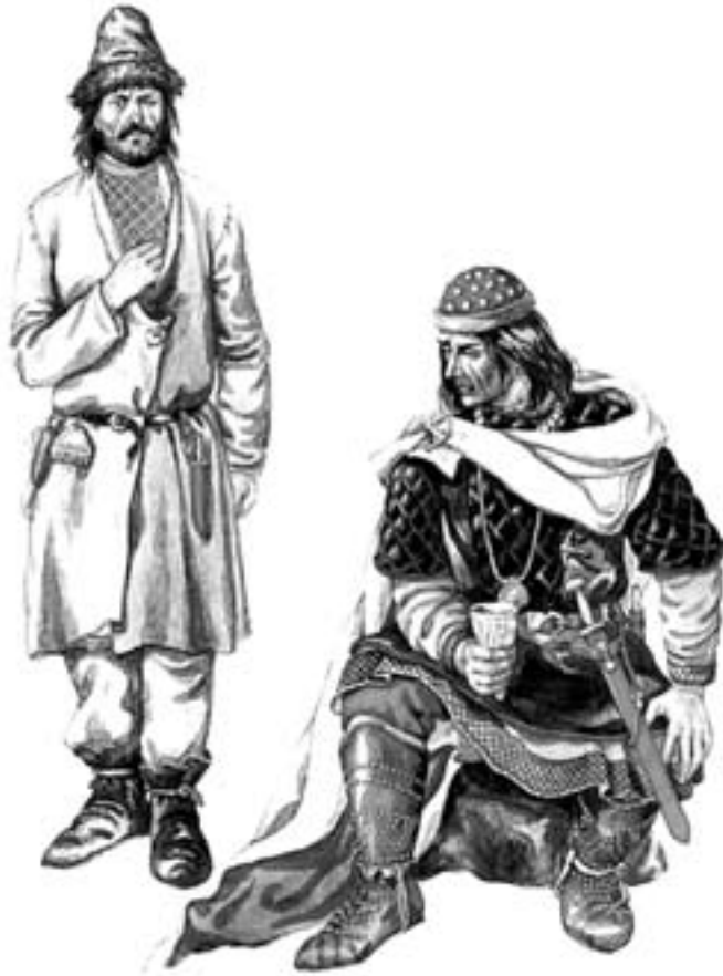
Смерд и боярин