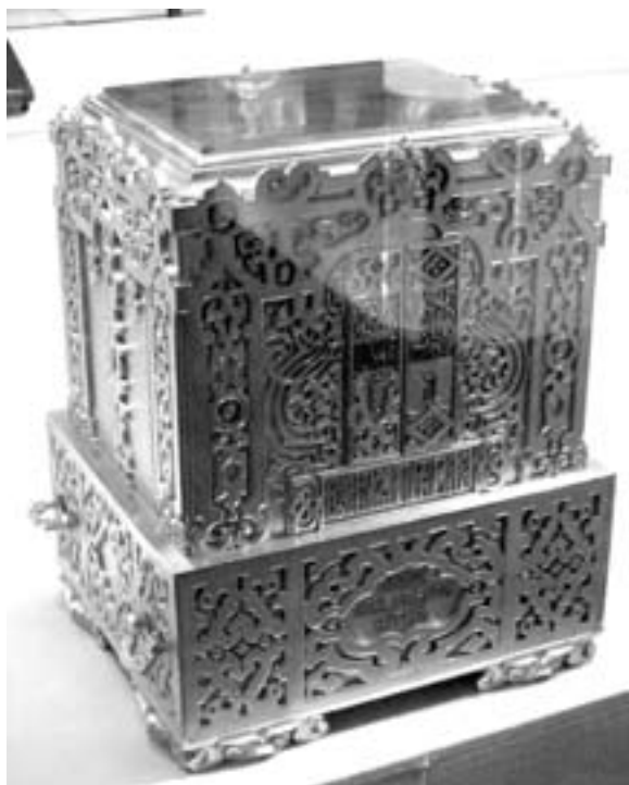
Золотой ковчег для хранения «Русской Правды»

Об изгое речь будет ниже. Что касается словенина, то расшифровать этот термин очень нелегко. Несомненно, кроме национального признака, ему присущи и социальные черты. Иначе трудно понять вообще весь перечень, и в частности сопоставление словенина с изгоем. В Лаврентьевской летописи под 907 годом говорится о походе Олега на Царьград. После благополучного окончания предприятия Олег с дружиной возвращался домой. «И вспяша русь парусы паволочиты, а словене кропивны». Здесь подчеркивается не только национальный, но и социальный признак: русь по сравнению со славянином стоит на первом месте. Но все-таки термин «словенин», поставленный в «Правде» рядом с «изгоем», этим сравнением с процитированным текстом летописи не разрешается. Мы не можем точно ответить на вопрос, кто такой «словенин» «Правды Русской». Не разумеется ли под словенином представитель массы, населяющей деревню, т.е. смерд, член соседской общины?