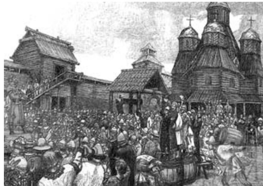
Васнецов В. Вече во Пскове

ци бо изначала и смольняне, и кыяне, и полочане, и вся власти якоже на думу на вече сходятся...») и на другие места летописей, он делает решительное заключение: «Итак, по мнению начального летописца и позднейшего, жившего в конце XII века, вече было всегда». И дальше, пытаясь доказать этот в сущности уже принятый им тезис фактами, он продолжает: «Но мы можем привести и официальные документы X века, свидетельствующие об участии народа в общественных делах того времени. Это договоры Олега и Игоря с греками. Первый договор заключен был не только от имени князей, но «и ото всех иже суть под рукою его сущих Руси» (911 г.). Для заключения второго договора послы были отправлены «и от всех людей Русския земли» 1 . Выше он выражается по этому предмету не менее решительно: «Вече как явление обычного права существует с незапамятных времен» и приводит в доказательство как слова Лаврентьевской летописи об «изначальности» этого обычая, так и факты о полянах, сдумавших дать хазарам от дыма меч, о поведении древлян в переговорах с кн. Ольгой, об осаде Белгорода печенегами и др.