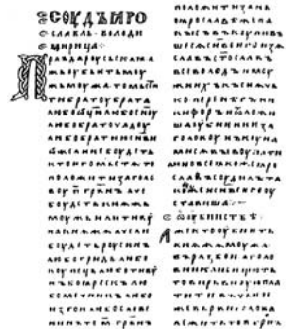
Страница из краткой редакции «Русской Правды».

щихся из Киева новгородцев, помогших ему овладеть Киевским столом, всем им обещая право на 40-гривенную виру, т.е. равное право защиты жизни судом.