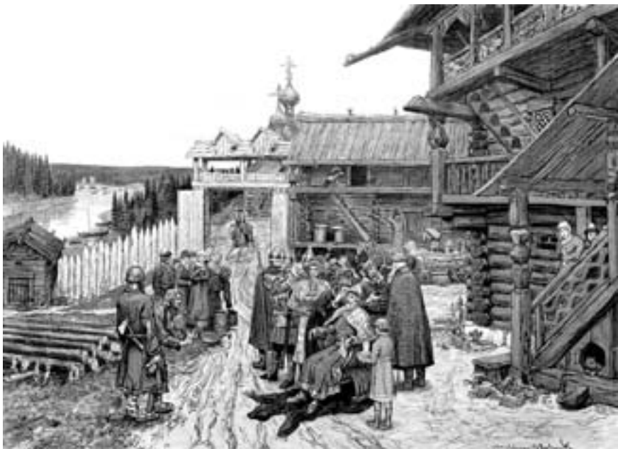
На княжеском дворе

В процессе феодализации наступающей и побеждающей силой является землевладелец (князь, дружинник, церковь), осваивающий землю, подчиняющий себе путем экономического и внеэкономического принуждения свободного общинника-смерда. Жертвы и итоги этого процесса мы видели. Это — закупы, изгои, рядовичи, сироты, попавшие в непосредственную зависимость от феодалов смерды, нищие, бедные люди, привлекаемые на работу к хозяевам через выдачу им вперед хлеба и денег. Все эти категории зависимого населения выхвачены из рядов свободного крестьянства или рекрутируются из вольноотпущенников.