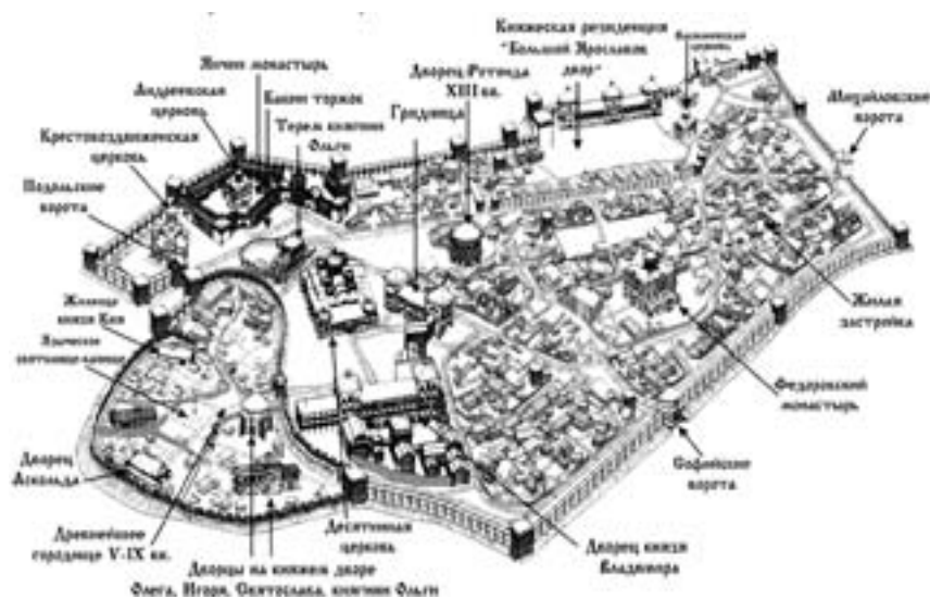
Киевский детинец. VIII—XIII вв.

зывает Киев соперником Константинополя. Митрополит Киевский Иларион в своем знаменитом «Слове» называет Киев городом, «блистающим величием», Лаврентьевская летопись под 1124 г. говорит, что в Киеве был грандиозный пожар, причем «церквий единых изгоре близ 600». Весьма вероятно, что здесь кое-что и преувеличено, но, несомненно, во всяком случае, что Киев в XI в. — один из больших городов европейского масштаба. Не случайно ему так много внимания уделяют западноевропейские хронисты. Двор киевского князя хорошо известен во всем тогдашнем мире, так как киевский князь в международных отношениях к этому времени успел занять весьма определенное место.