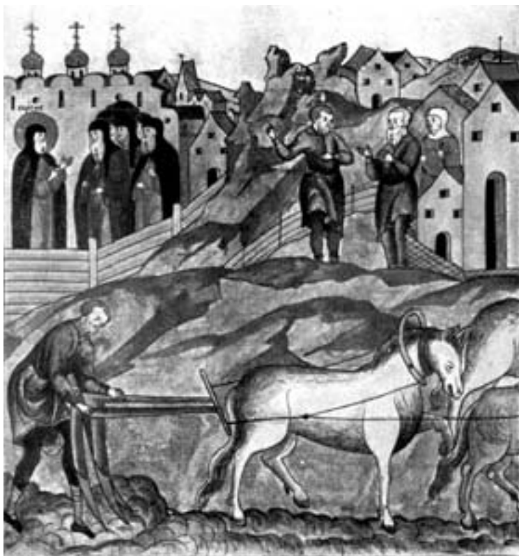
Пахота в Древней Руси. Миниатюра из Лицевого свода

Теоретически рассуждая и исходя из положения, что рабство предшествует крепостничеству, более чем вероятно, что рабовладелец, стремясь подчинить себе крестьянина, был мало склонен проводить какую-либо большую разницу в степени своей власти над рабом и крепостным, считая и того и другого своими людьми. Но наличие крестьянской общины, этого оплота крестьянской независимости, во всяком случае, должно было сыграть весьма определенную роль по отношению к массе свободных смердов, задерживая темпы процесса феодализации, с одной стороны, и с другой — смягчая формы крестьянской зависимости. Как конкретно протекал этот процесс в ранней своей стадии в обществе, занявшем территорию Восточной Европы, мы, к сожалению, ничего не можем сказать точно. Во всяком случае, приведенные уже выше факты говорят о том, что и этот свободный смерд путем