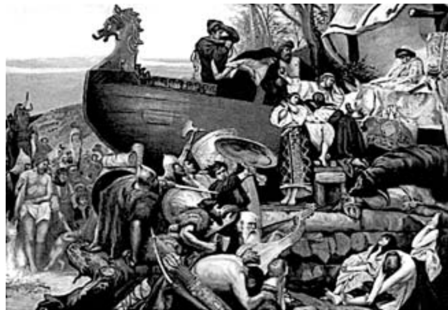
Генрих Семирадский. Похороны знатного руса. 1892. ГИМ

рабов. Между прочим, эти известия говорят о распространенном у славян обычае сжигать вместе со знатными покойниками жен, которые идут на смерть якобы добровольно. Об этом говорит Маврикий в своей «Стратегии», его повторяет в своей «Тактике» Лев Мудрый (886—911 гг.). О том же говорит и Майнский епископ Бонифаций (755 г.) относительно западных славян. Араб Аль-Джайхани (конец IX или нач. X в.) сообщает то же самое относительно Руси, но он указывает на то, что сжигались вместе с покойниками их рабыни и рабы. Это же подтверждают и Ибн-Фадлан, Аль-Истахри и др. Археологическое изучение могил говорит о том же. Этот обычай применяется только среди людей богатых и знатных. Несомненно, мы имеем здесь одно из следствий длительного существования рабства, так как подобных обычаев в родовом доклассовом обществе нет. По сообщению Ибн-Хаукаля и Аль-Истахри (оба пользовались одним источником), сжигание девушек делается «для блаженства их душ» 1 , так как они могут попасть в царство небесное только со своими господами.