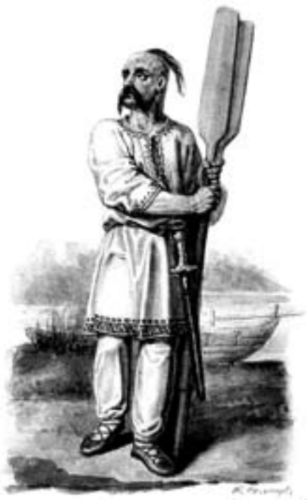
Киевский князь Святослав Игоревич

Не многим отличаются от этих мнений и суждения Владимирского-Буданова: «Происхождение княжеской власти доисторическое», «...власть принадлежит не лицу, а целому роду». «Члены княжеского рода или соправительствуют без раздела власти...» или «делят между собою власть территориально». «Этот последний порядок с конца X в. взял решительный перевес и создал так называемую удельную систему» 2 . И у него княжеская власть в ее историческом развитии полностью не изучена. Период Киевского государства не отделен от последующего удельного.