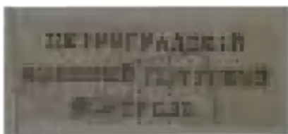
Бандероль Ил. Banderol_DSC_0112