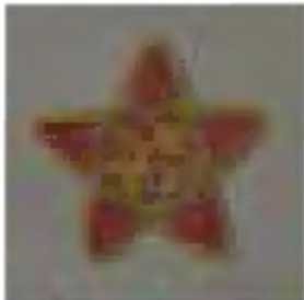
Красноармейская звезда. Рисунок Сиверса Ил. Zvezda_DSC_0106

Купил красноармейскую звезду — вчера в газетах был приказ об обязательном ношении их — надо прочесть, как там сказано точно по отношению к штатскому платью. Кажется, следует одевать в пятницу.