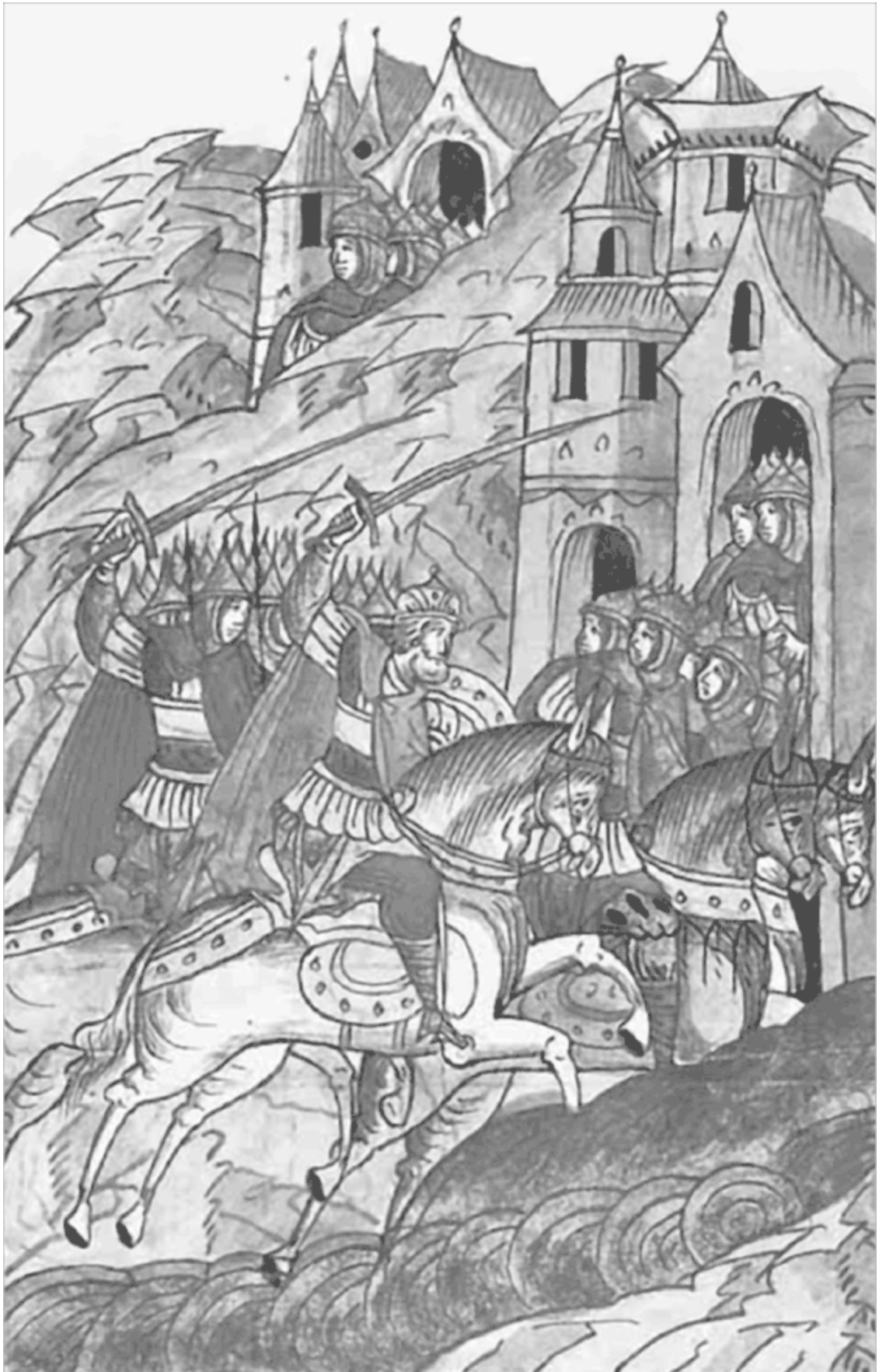
Битва на реке Омовже. Дружина Ярослава преследует крестоносцев Миниатюра Лицевого летописного свода XVI в.