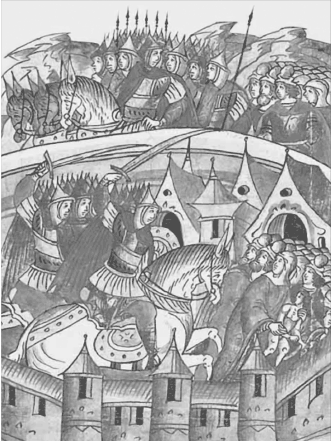
Взятие Великого города Миниатюра Лицевого летописного свода XVI в.

В лето 6744. Княжение. Сед в Киеве Ярослав Всеволодичь, а в Новеграде сын его Александр Невский».