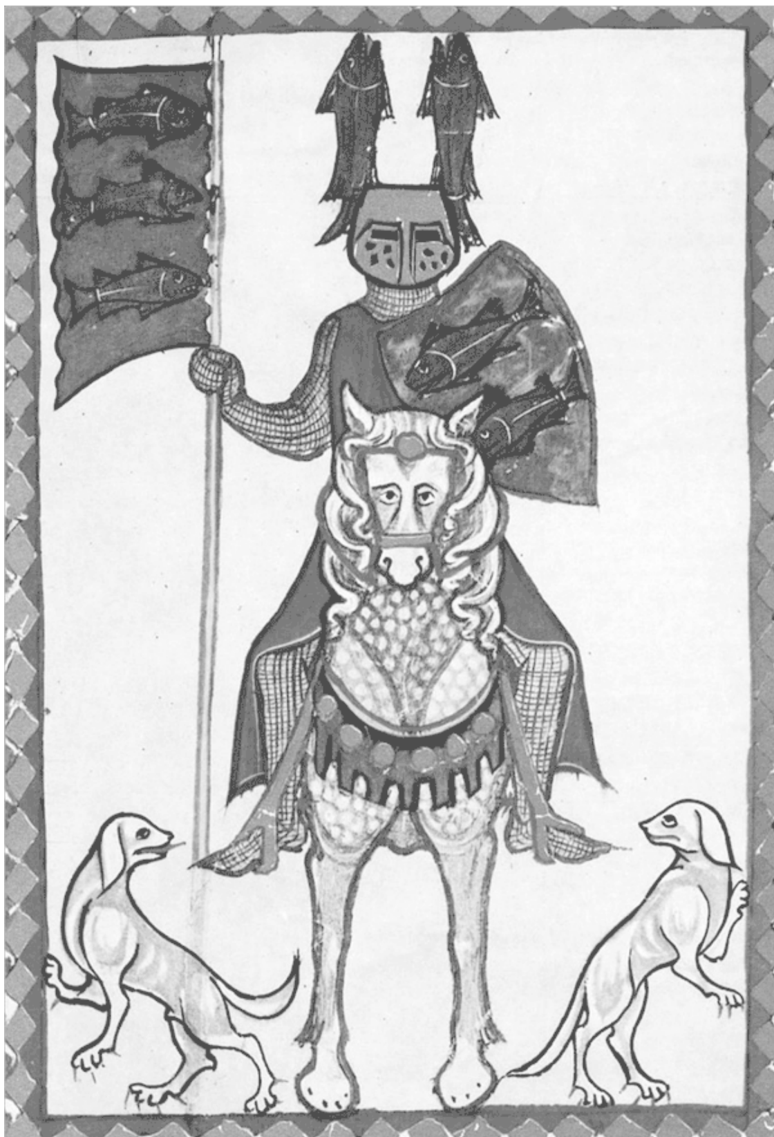
Снаряжение немецкого рыцаря XIII в. Миннезингер Ваксмут фон Кунзинген. Манесский кодекс

Неожиданно в дело вмешались эстонские старейшины. Исходя из своих местных интересов, они обратили внимание князя на то, что, двигаясь на Ригу, он оставляет у себя в