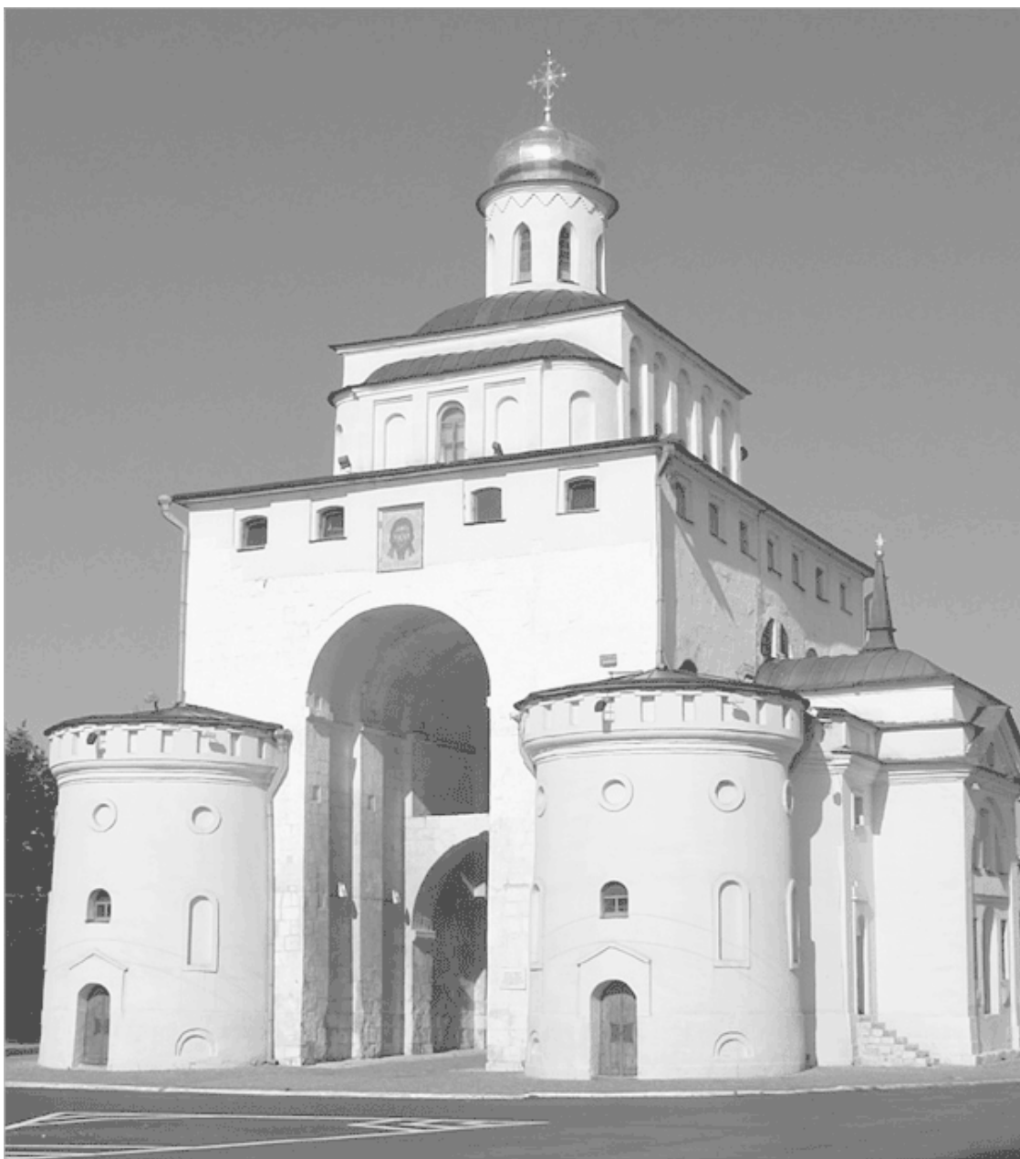
Золотые ворота – символ Владимиро-Суздальского княжества

Союзники снова выступили в поход, но когда до Владимира Рюриковича дошел слух, что половецкая орда стоит у Звенигорода, киевский князь запаниковал и объявил о том, что необходимо вернуться в Киев. Неожиданно его поддержал воевода Мирослав и тоже стал говорить об отводе войск. Таким образом, два главных инициатора войны с Изяславом неожиданно изменили свою позицию и стали в один голос говорить о необходимости отступления. Это взбесило Даниила, и он в бешенстве крикнул соратникам: «Не подобает ли воину, устремившемуся на битву, – или завоевать победу, или погибнуть в бою? Я удерживал вас. Теперь же вижу, что трусливую душу имеете. Не говорил ли я вам, что не следует усталым воинам идти против свежих? А теперь что смущаетесь? Выходите против них!» (Галицко-Волынская летопись).