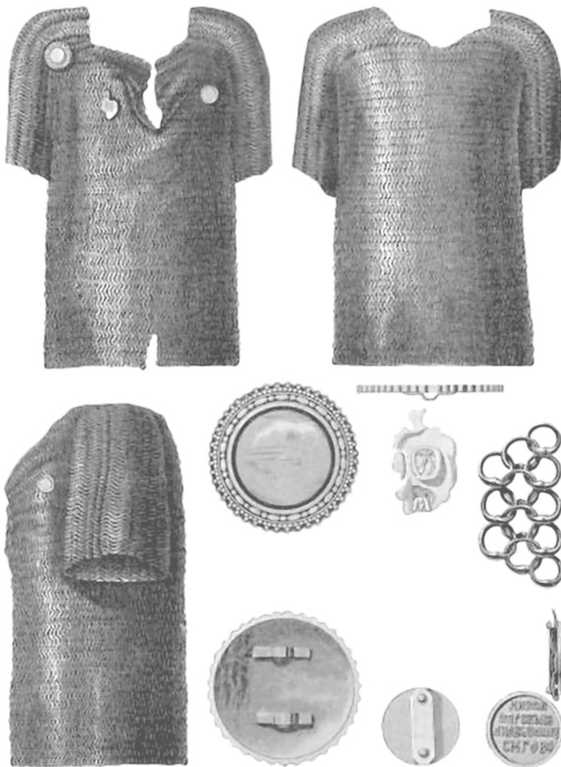
Кольчуга Худ. Солнцев Ф.

Избавившись от внешней угрозы, Даниил столкнулся с угрозой внутренней. Бояре составили против него очередной заговор, и в этот раз сумели привлечь на свою сторону Александра Белзского. Этот беспринципный и подлый человек был готов заключить союз с кем угодно, лишь бы избавиться от братьев Романовичей. Сколько раз Даниил щадил своего недостойного родственника, столько раз тот его и предавал. В этот раз белзский князь дей-