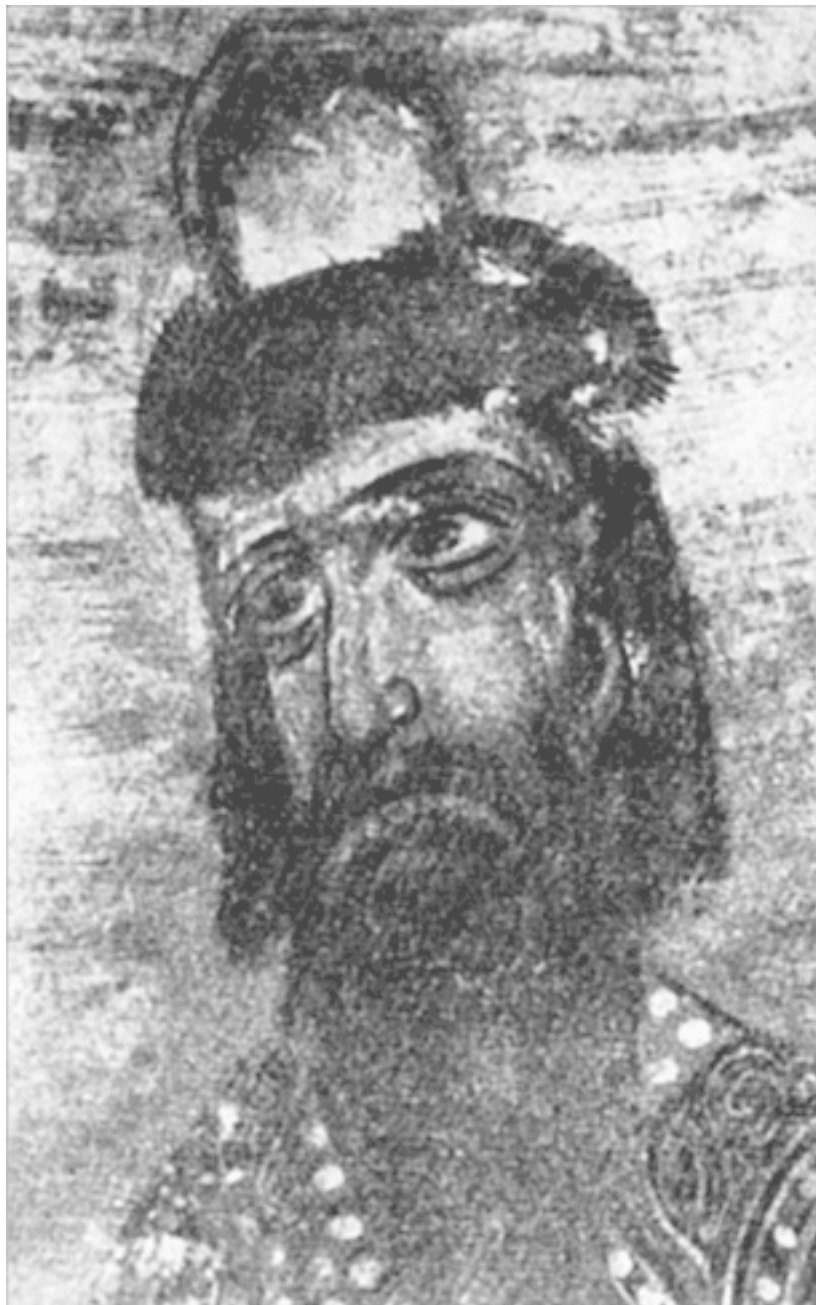
Князь Ярослав Всеволодович Фрагмент фрески церкви Спаса на Нередице

Одним из главных достоинств Ярослава Всеволодовича как правителя было то, что он умел делать выводы не только из своих ошибок, но и из чужих. В Переславле-Залесском у князя было время, чтобы обдумать причины неудач в Прибалтике и понять, почему русские в итоге потерпели там поражение. Проанализировав ситуацию, Ярослав пришел к выводу, что главной причиной неудачи стала бессистемная политика русских в регионе и полная пассивность новгородцев перед лицом встающих перед ними вызовов. Князь понял, что многочисленные походы в Прибалтику русских князей были не что иное, как набеги за добычей, которые не решали проблемы. А бестолковая попытка его тестя Мстислава Удатного крестить местное население закончилась полным крахом из-за той же лени и непоследовательности. Иное дело крестоносцы, которые одновременно несли меч и слово Божие. У них было чему