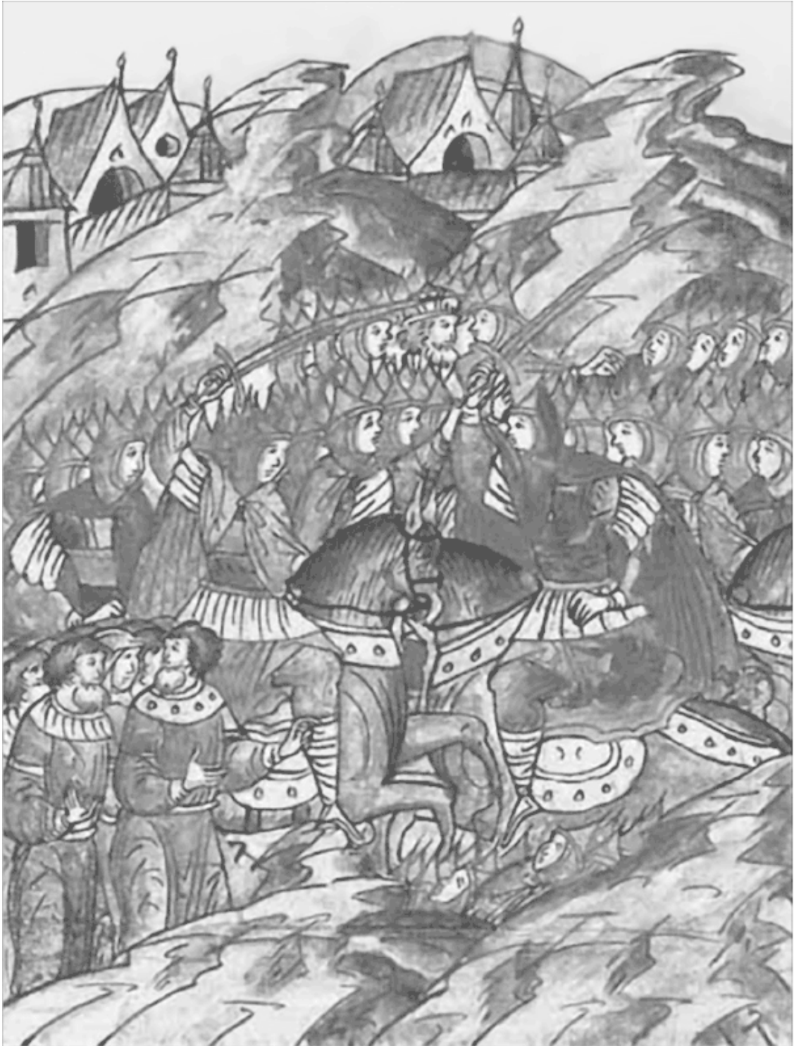
Битва под Усвятом Миниатюра Лицевого летописного свода XVI в.

Трудно сказать, насколько поражение под Старой Руссой повлияло на дальнейшее развитие событий. Но судя по всему, до новгородцев дошло, что в данной ситуации им нужен не малолетний князь, а опытный ратоборец, способный навести страх на агрессивных соседей. В городе началась смута, и Всеволод со своими людьми ночью убежал из Новгорода в Торжок. Наводить порядок на берега Волхова отправился сам великий князь. Вместе с ним выступили в поход брат Ярослав, племянник Василько и шурин Михаил Черниговский.