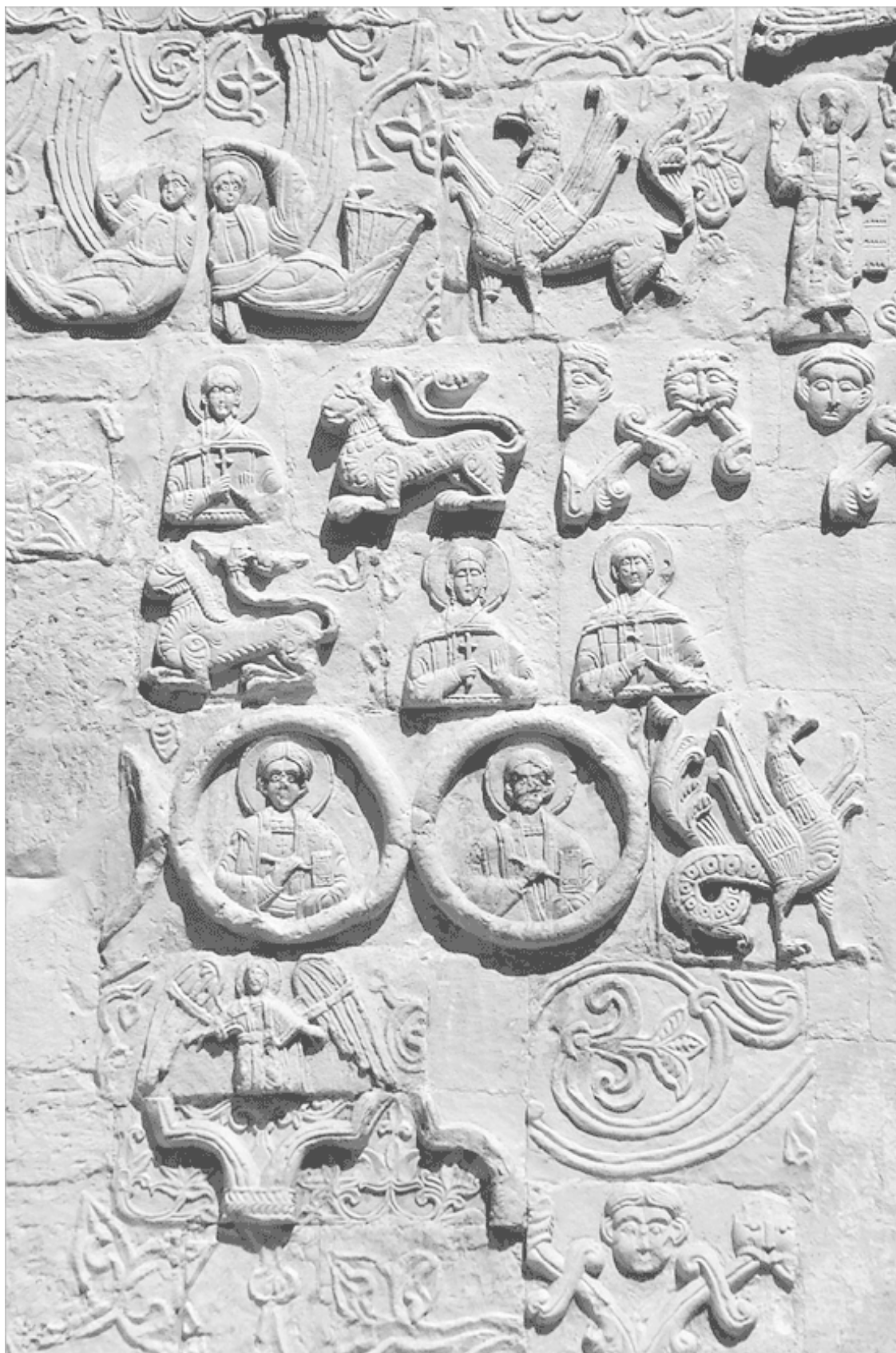
Белокаменная резьба Георгиевского собора в Юрьеве-Польском. На фотографии видно, как после реставрации В.Д. Ермолина была нарушена единая композиция