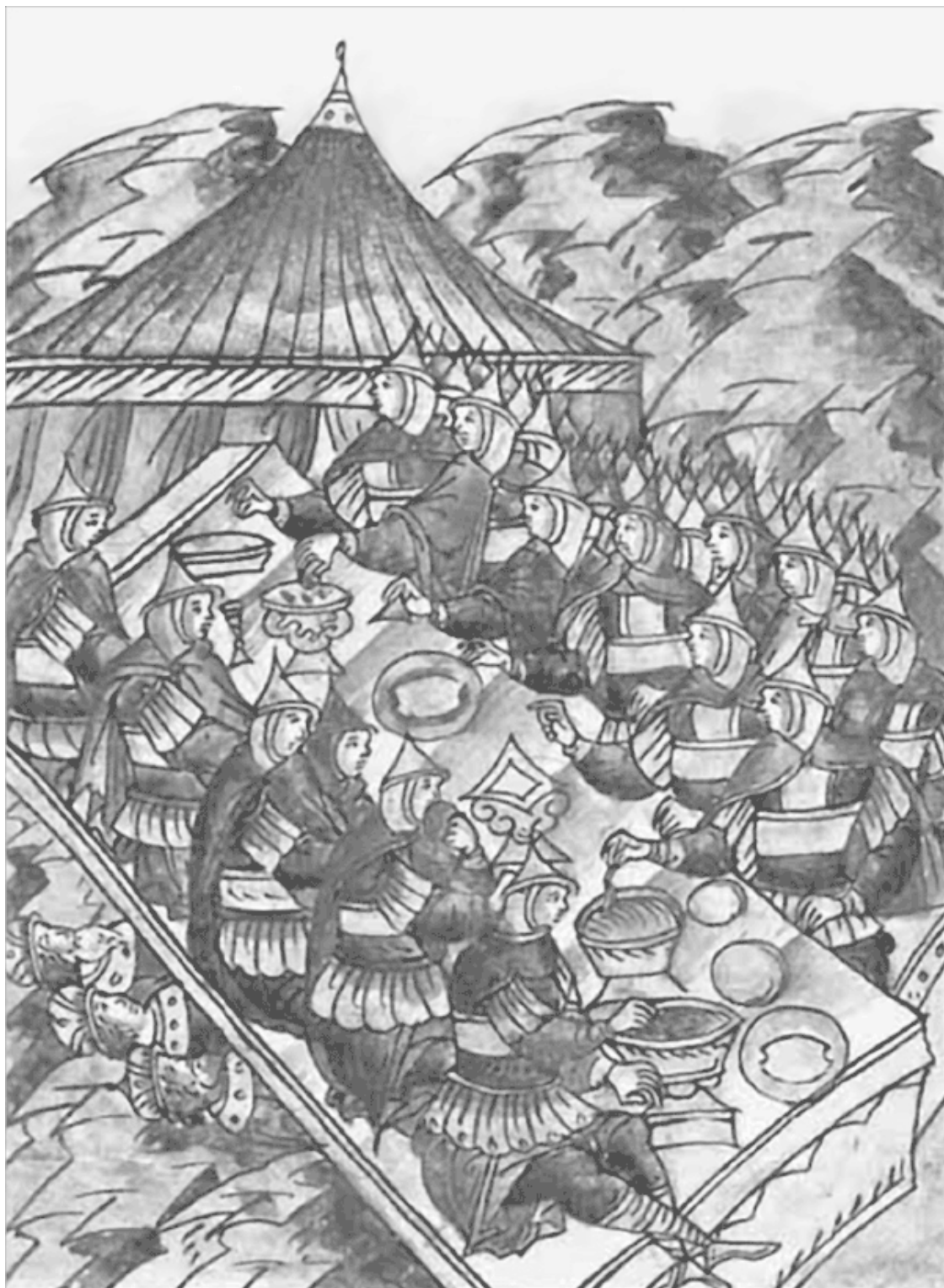
Убийство пленных русских князей Миниатюра Лицевого летописного свода XVI в.

сигнал к атаке. Спрыгнув с коней, нукеры начали карабкаться на каменистый холм, посылая стрелы в толпившихся наверху защитников. Но не успели монголы добраться до середины склона, как сверху в них полетели камни и сулицы, а дружный залп из луков и самострелов выкосил передние ряды. Степняки скатились вниз, перестроились и снова пошли в атаку, но град метательных снарядов в очередной раз опрокинул их боевые порядки. С большими потерями нукеры отхлынули от холма.