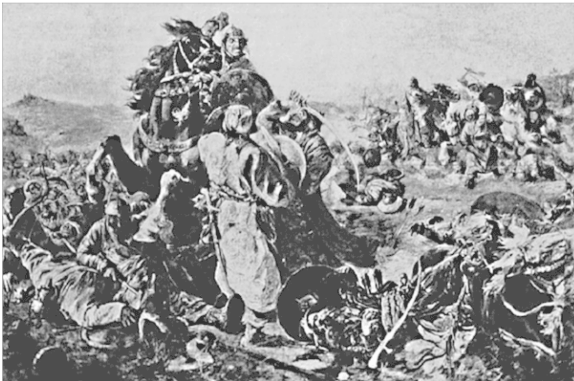
Бой богатырей с татарами

А Мстислав Мстиславич продолжал стремительно двигаться в авангарде русских войск. Впереди главных сил шли половцы Яруна и конные лучники воеводы Ивана Дмитриевича, которые часто вступали в бои с монгольскими разъездами. Через несколько дней после переправы через Днепр произошло ещё одно сражение между русскими и монгольскими передовыми частями. И снова победа была за воинами Удатного, а враг продолжал отступать на восход. В этом бою приняли участие только половецкие и русские конные лучники, что и было отражено в летописях: «Русские стрелки победили их, и гнали далеко в степь, избивая, и захватили их скот, и со стадами ушли, так что все воины обогатились скотом» (Галицко-Волынская летопись). Умело используя степную конницу половецких родственников и мобильные отряды младшей дружины, Мстислав Мстиславич прочно овладел стратегической инициативой и не собирался её выпускать из рук. Конечно, такого опытного воина не могла не посещать мысль о том, не заманивает ли его противник в ловушку. Но, во-первых, Удатный был очень уверен в себе и своих войсках, а во-вторых,двигающаяся следом громадная русская рать невольно придавала князю ещё больше смелости.