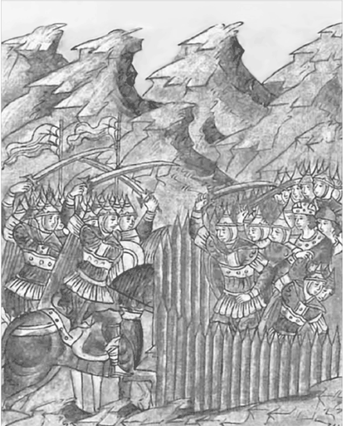
Битва киевской дружины с монголами Миниатюра Лицевого летописного свода XVI в.

Галицкий князь слышал проклятия, что посылали ему вдогонку столпившиеся на берегу дружинники и ратники, которых он лишил последней надежды на спасение. Ладья быстро разрешила днепровскую волну, а сидевший на скамье Мстислав Удатный так ни разу и не оглянулся назад, на берег, где он потерял всё – славу, честь и совесть.