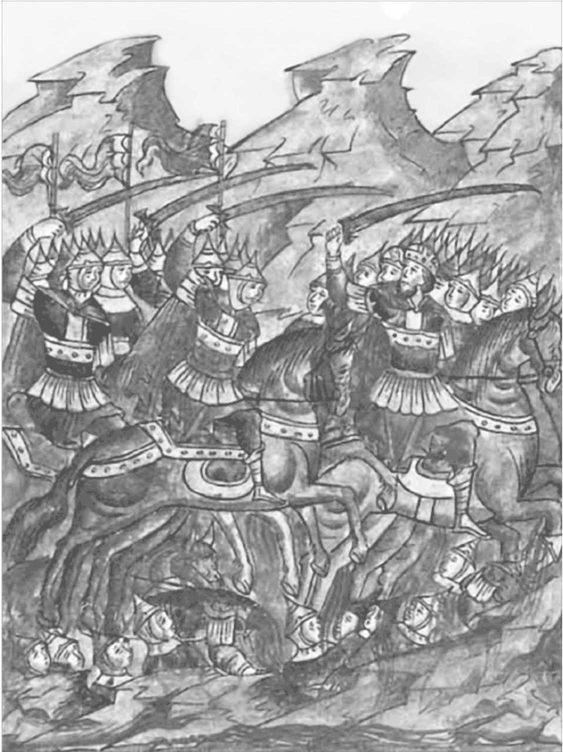
Разгром дружины Мстислава Удатного Миниатюра Лицевого летописного свода XVI в.