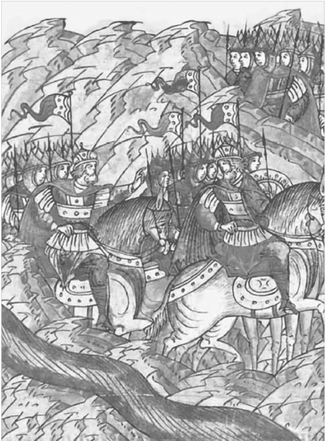
Мстислав Удатный переходит Калку Миниатюра Лицевого летописного свода XVI в.