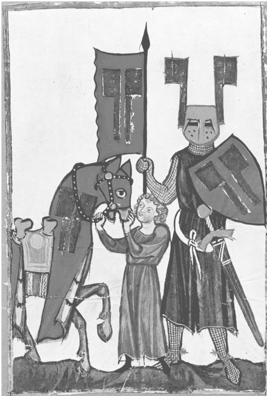
Снаряжение немецкого рыцаря XIII в. Миннезингер Вольфрам фон Эшенбах. Манесский кодекс

Единственный вывод, какой можно сделать на основании данной информации, заключается в том, что полководцы Чингисхана так и не сумели прорваться к Биляру.