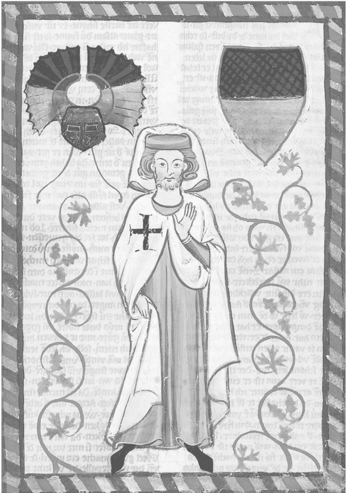
Тевтонский рыцарь Миниатюра из Манесского кодекса

Удивительно, но княжеская задумка увенчалась успехом. Причем всё сложилось гораздо лучше, чем планировал Ярослав. Когда к Дерпту подошли орденские братья из Оденпе, начальники городского гарнизона решили с ними объединиться и дать бой русским