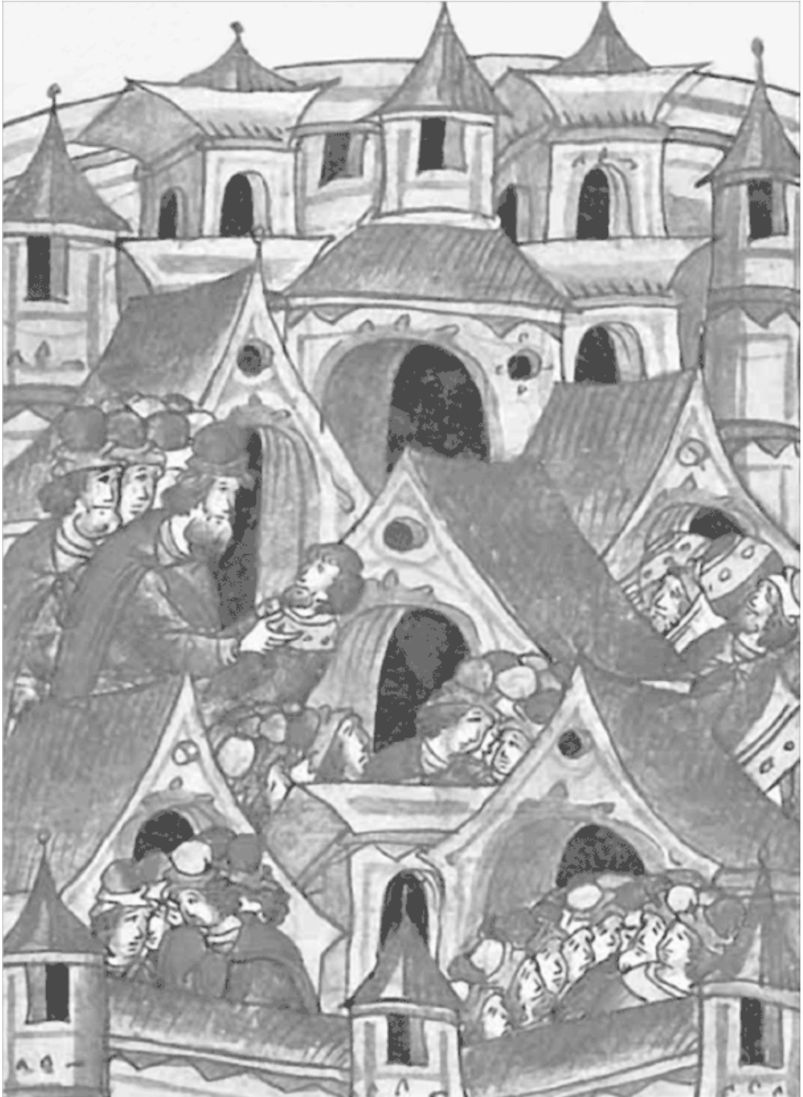
Мор в Смоленске

Миниатюра Лицевого летописного свода XVI в.