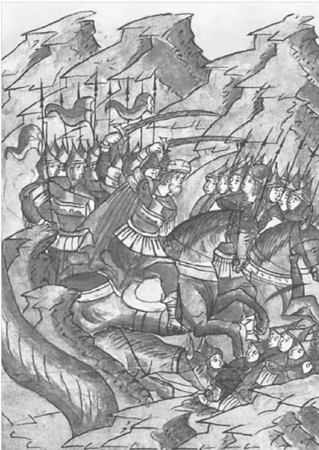
Переправа дружины Мстислава Удатного через Днепр Миниатюра Лицевого летописного свода XVI в.

поставил. И если в этот раз подобная самонадеянность сойдёт Удатному с рук, то в дальнейшем она обернётся трагедией для всего русского войска.