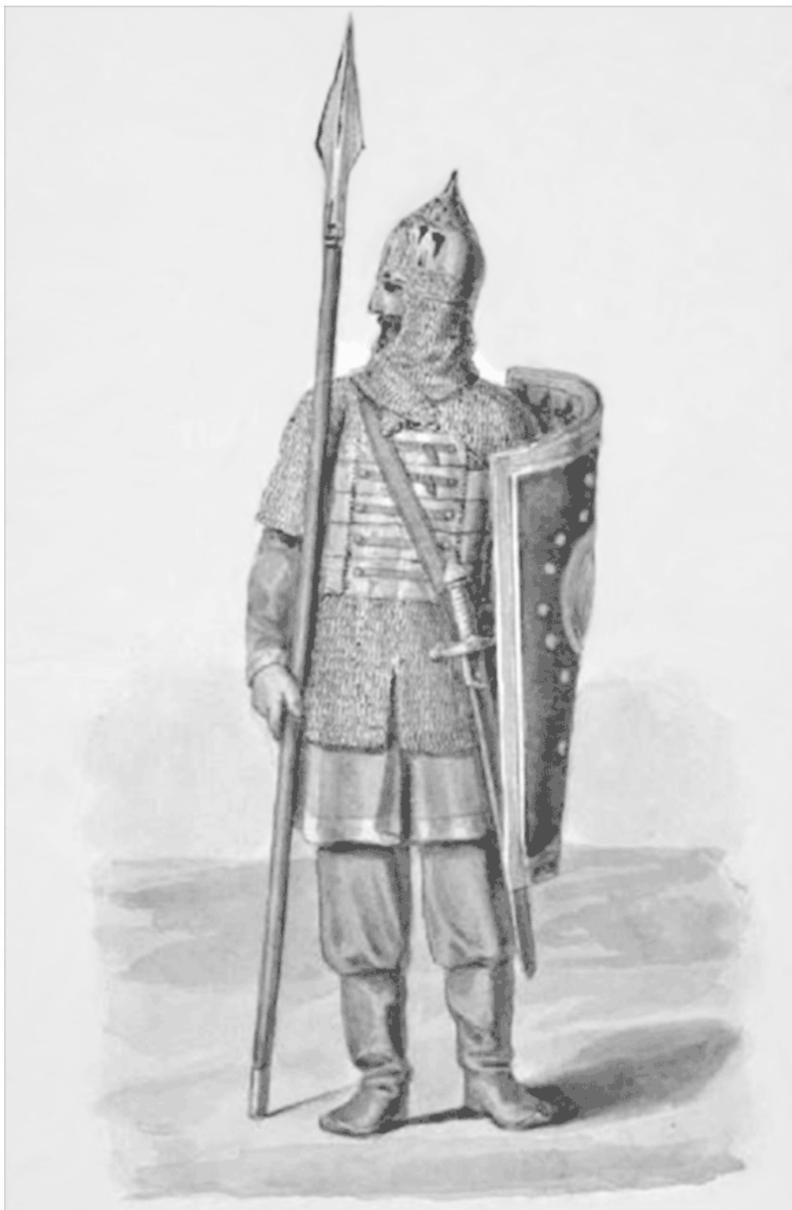
Русский воин. XIII–XIV вв. Худ. Солнцев Ф.