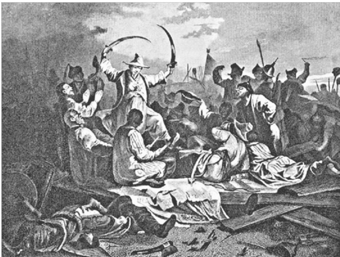
Татары, пирующие после битвы на Калке. 1224 г.

Но вдруг татары повернули против русов, которые не успели оглянуться, как столкнулись с ними неожиданно для себя, так как они считали себя в безопасности и чувствовали себя сильнее их. Но не успели собраться, чтобы сразиться, как татары набросились на них с большими силами. Обе стороны выказали стойкость, подобной которой никто доселе не слышал. Сражение между ними продолжалось несколько дней, но затем татары одолели, а кипчаки и русы обратились в ужасное бегство после того, как татары нанесли им сильное поражение. Из бежавших многие были перебиты и лишь немногие спаслись. Все, что было с ними (русами), было разграблено» (с. 143).