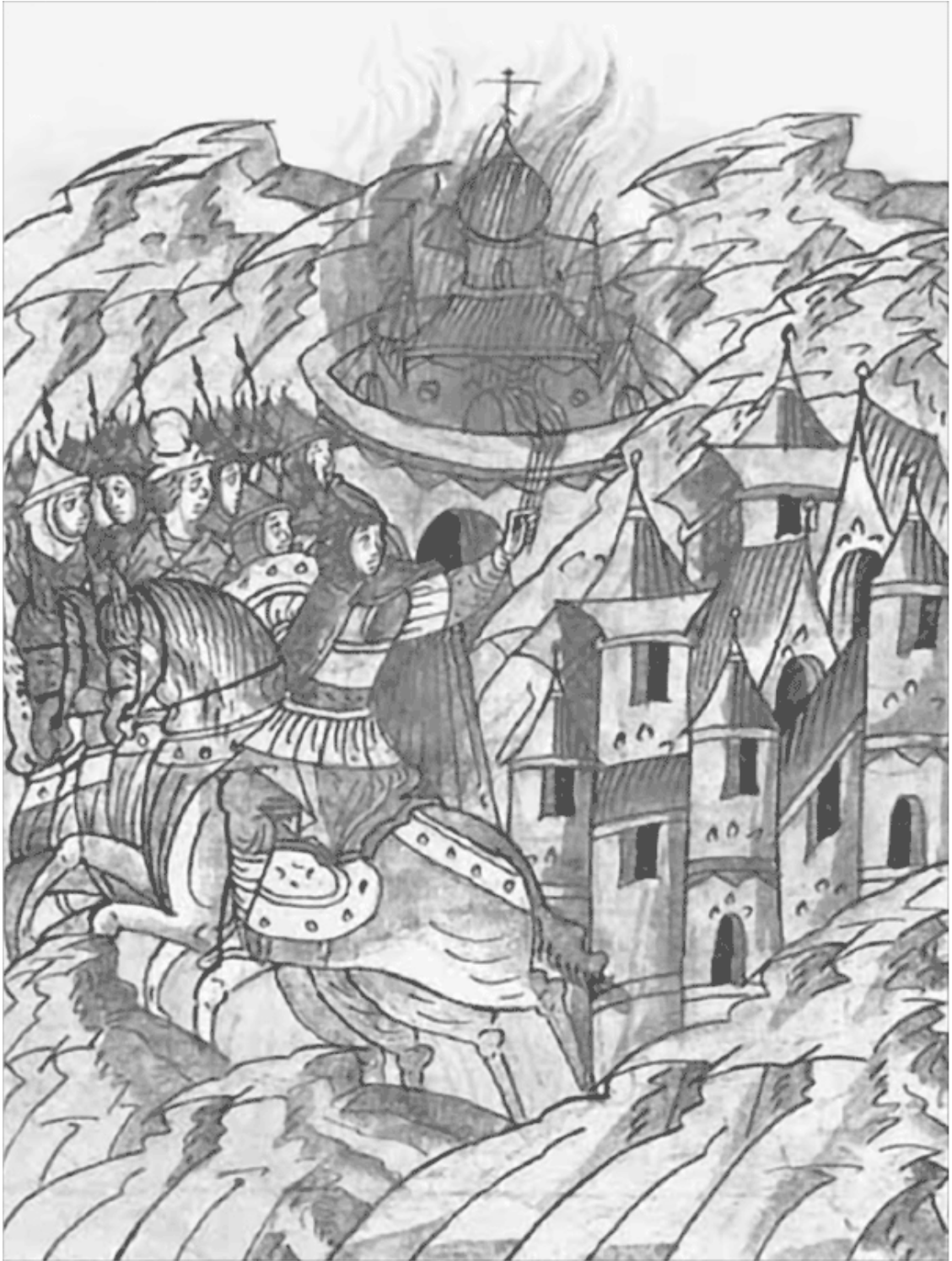
Воины Пургаса сжигают монастырь Святой Богородицы Миниатюра Лицевого летописного свода XVI в.

После этого по Новгороду поползли слухи: «Князь нас зовет на Ригу, а хотя ити на Пльсков» (Новгородская I летопись старшего извода). Тогда Ярослав отправил в Псков доверенного человека, который должен был убедить псковичей не только отправиться вместе с ним в поход на Ригу, но и выдать тех, кто клеветал на князя. Но жители Пскова наотрез отказались принимать участие в походе Ярослава и твердо держались своих мирных договоренностей с крестоносцами. Пока шли эти переговоры, началось брожение умов и в Нов-