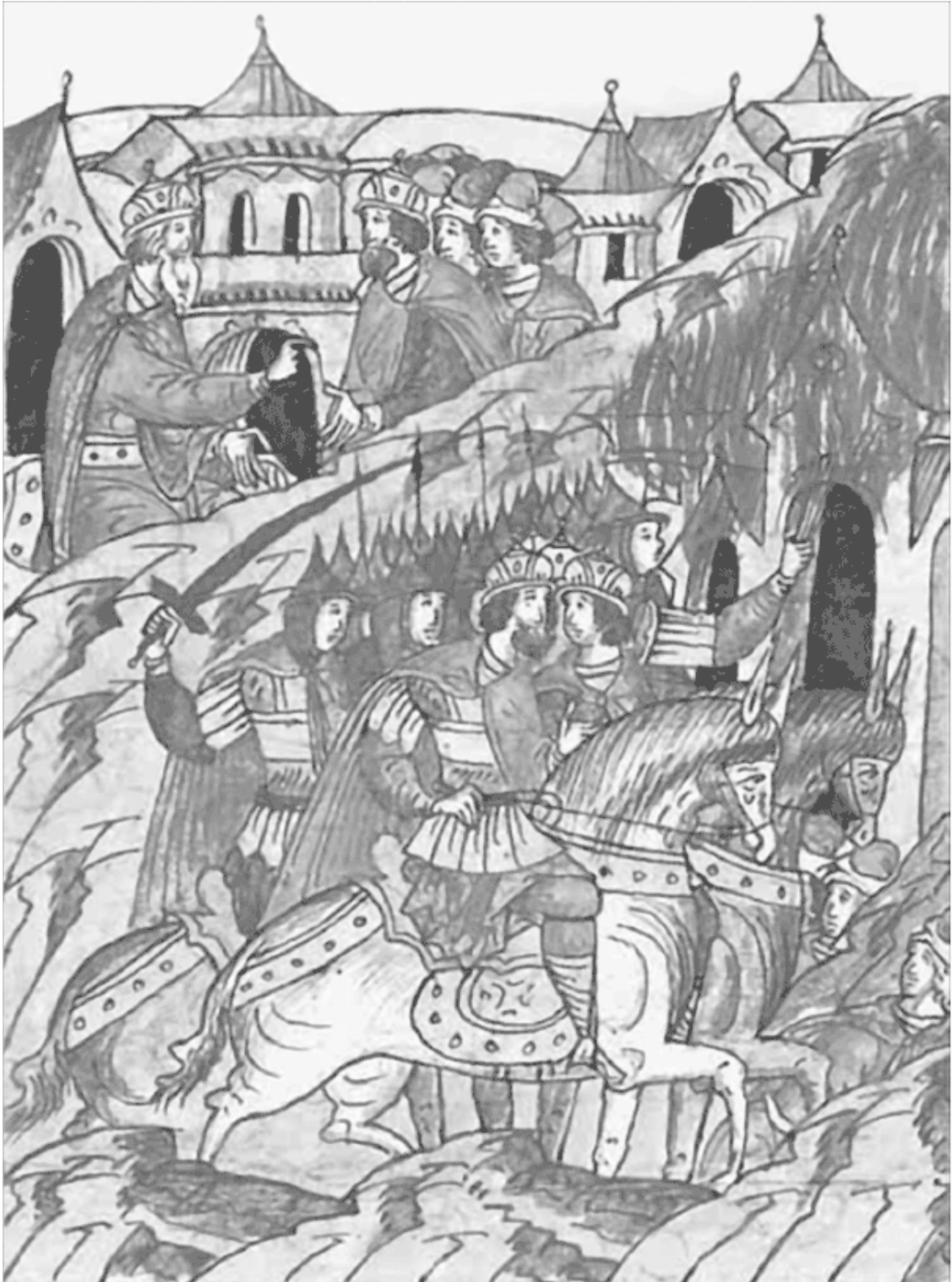
Поход суздальцев на мордву в 1232 г. Миниатюра Лицевого летописного свода XVI в.

Пока русские громили земли Пургаса, во владения ротника Георгия Всеволодовича князя Пуреша вторглись войска серебряных болгар. То ли болгарские военачальники не знали о том, что войско великого князя в это же время воюет в землях Пургаса, то ли они просто не имели представления о масштабах вторжения. Потому что, как только обстановка прояснилась, отряды волжских болгар спешно покинули регион, «бежа прочь ночи» , как ехидно отметил летописец. Русские князья посчитали, что стоявшие перед ними задачи выполнены,