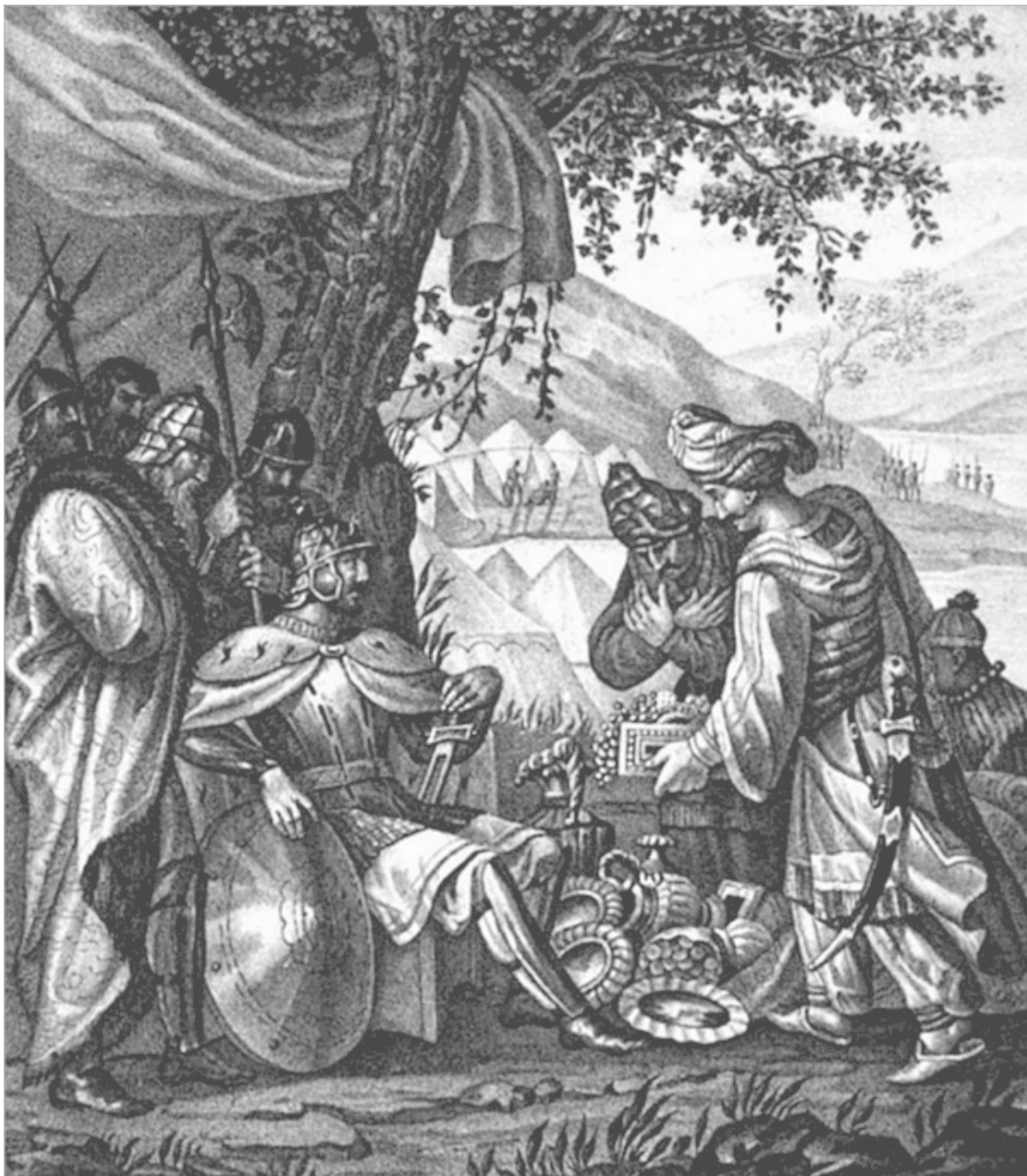
Болгары посредством богатых даров склоняют князя Георгия к миру. 1219 г.

На следующий год был объявлен новый поход на мордву. Поскольку о мордовских набегах на Русь информации нет, то, скорее всего, как и поход 1226 года, это был банальный рейд за добычей. Возглавили поход Василько Ростовский и владимирский воевода Еремей Глебович. Время для начала военных действий выбрали неудачно, на дворе стояла осень, и вскоре зарядили дожди. Об этом сообщает Лаврентьевская летопись: «Того же лета, месяца сентября, великий князь Гюрги посла на Мордву Василка Костянтиновича, и своего мужа Еремея Глебовича воеводьством с полком; и бывшим им за Новымгородом на передлах Мордовьских, послав Гюрги взрати их не дасть им воевати, зане погодьа им не бысть, бяхуть бо дождове велми мнози день и ноць» (с. 428).