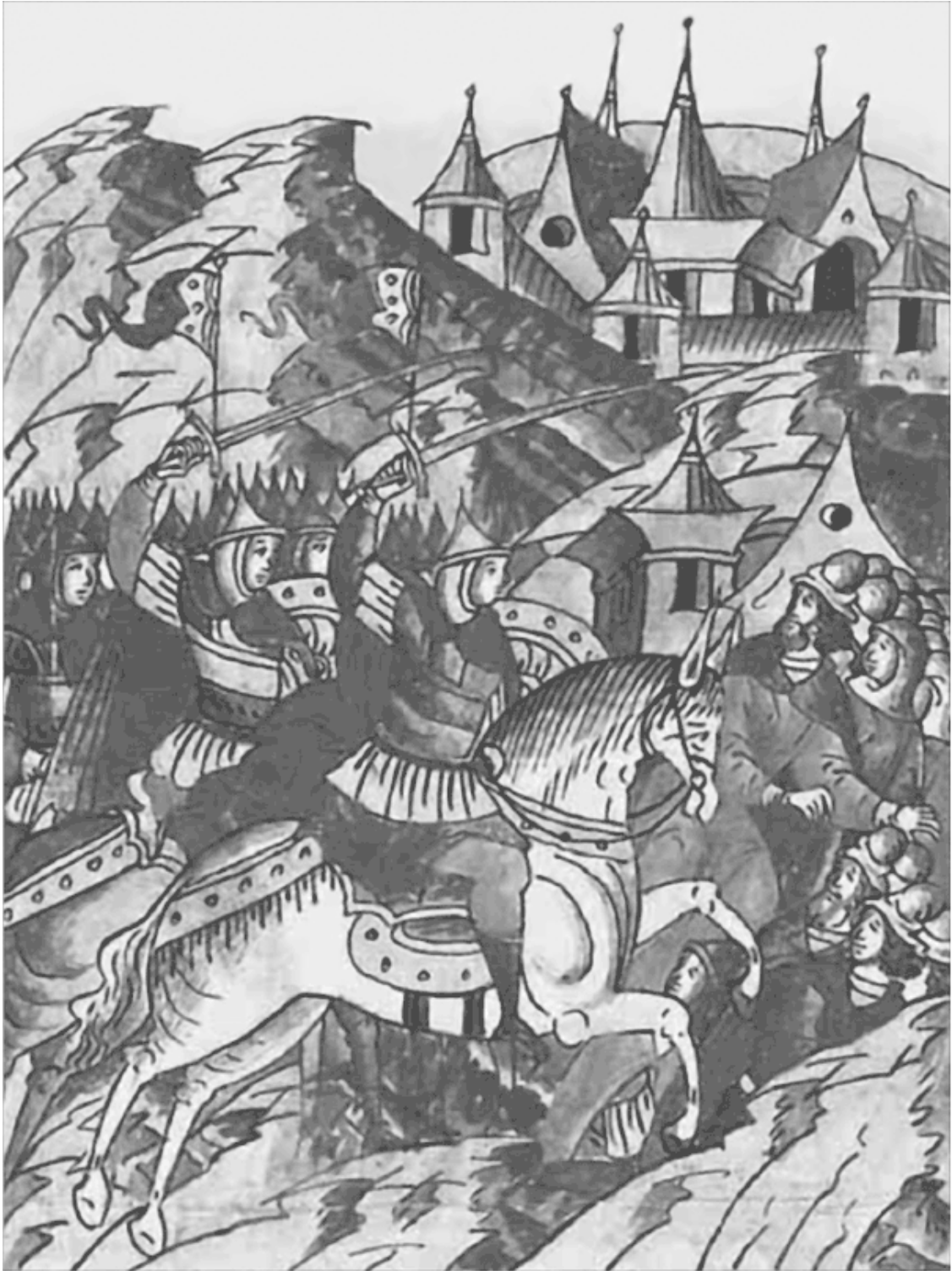
Падение Волжской Болгарии Миниатюра Лицевого летописного свода XVI в.

Информация о захвате Ярославом Киева в 1236 году содержится в Новгородской I летописи старшего извода. С одной стороны, она достаточно подробна, а с другой стороны, хотелось бы знать об этом знаковом событии больше. Потому что данное свидетельство отражает лишь новгородскую точку зрения на события и не более того. Летописца интересует только то, что касается непосредственно его земляков. Он даже не называет имени киевского князя, против которого выступил Ярослав, поскольку это, по мнению книжника, не принци-