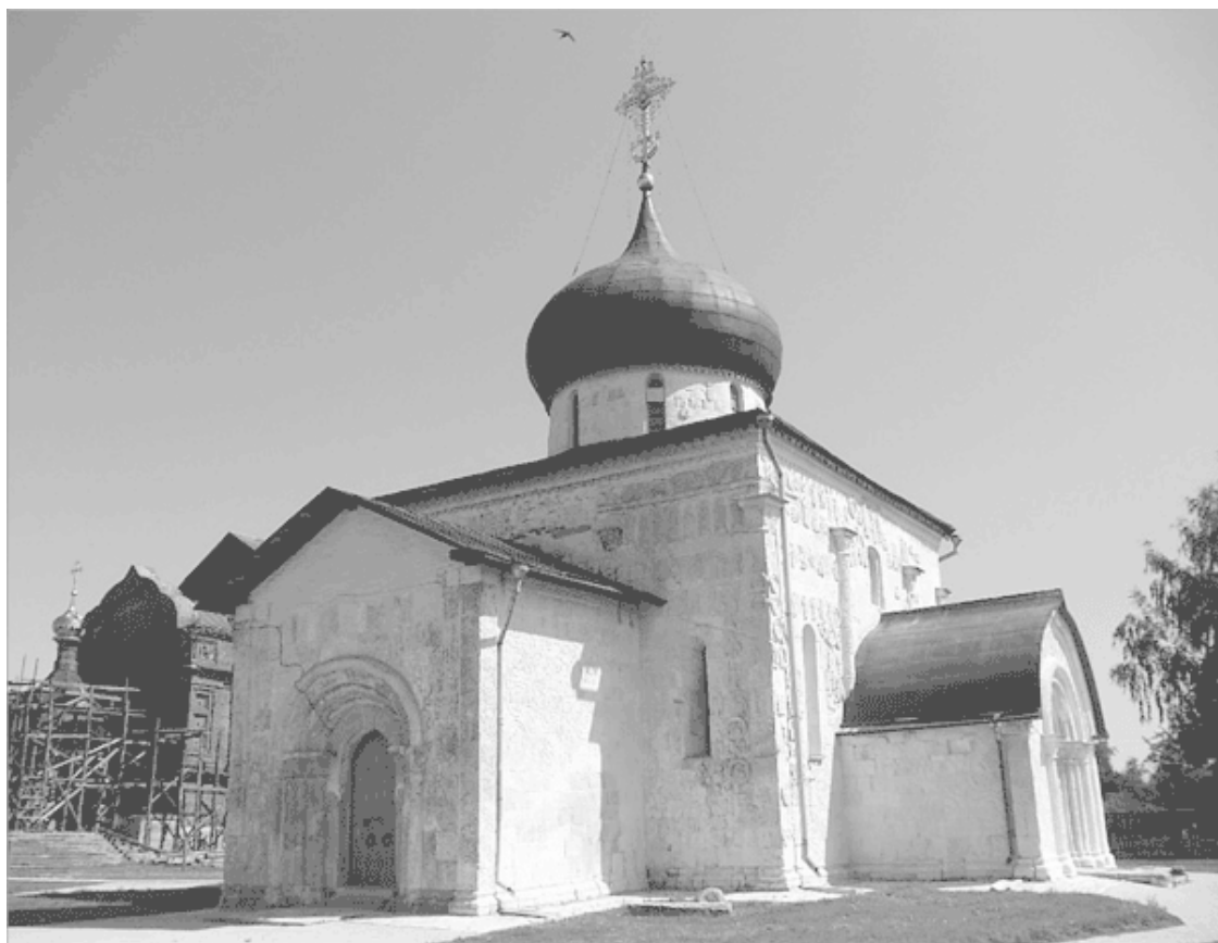
Георгиевский собор в Юрьеве-Польском