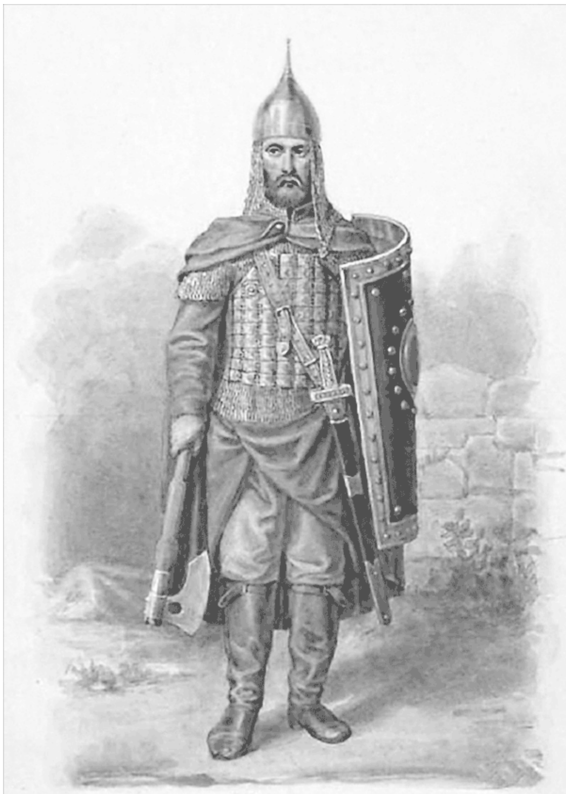
Русский воин. XIII–XIV вв. Худ. Солнцев Ф.

Такие настроения было очень трудно переломить, и потому надрывался на съезде Мстислав Удатный, а хан Котян суетился изо всех сил, раздавая направо и налево породистых скакунов, сундуки с добром и степных красавиц. Усилия Котяна и Удатного даром не пропали, поскольку неожиданно взыграла удаля в киевском князе. «Пока я нахожусь в Киеве – по эту сторону Яика, и Понтийского моря, и реки Дуная татарской сабле