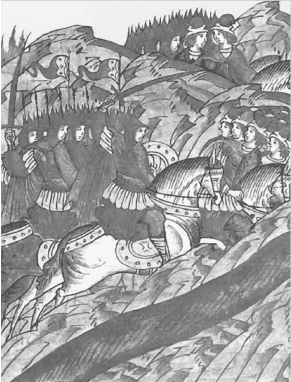
Бегство половцев к Лукоморью Миниатюра Лицевого летописного свода XVI в.

Время, проведенное в Половецкой степи, Субудай и Джебе использовали с большой выгодой для себя. Они дали отдых своим потрепанным туменам, а нукеры привели в порядок оружие и снаряжение. Вполне возможно, что темники даже сумели пополнить свои войска разным сбродом, который в это тревожное время в большом количестве шатался по степи. Также военачальники озаботились сбором информации о народах, проживающих в соседних регионах. В том числе и о русских.