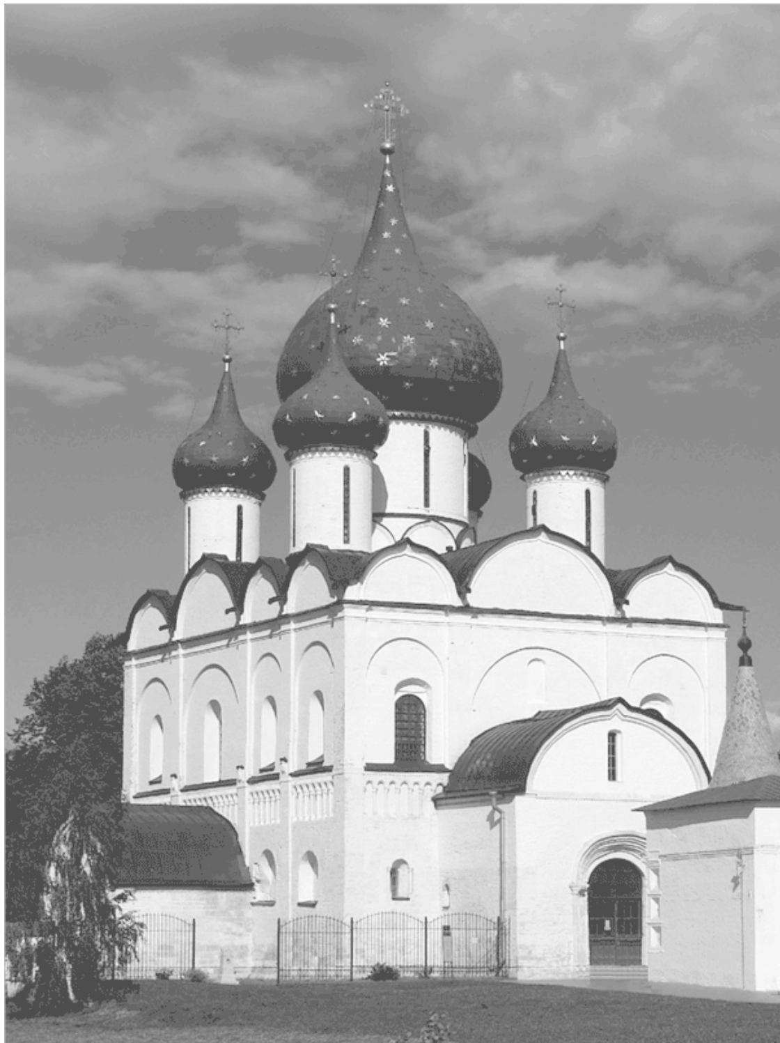
Рождественский собор в Суздале

– на целых четыре года остановить монгольское нашествие и уберечь центральные области Волжской Болгарии от разорения. Субудая банально не хватило ни сил, ни воинского таланта, чтобы выполнить поставленную перед ним боевую задачу. В очередной раз болгарские военачальники попортили немало крови старому полководцу. Для продолжения кампании Субудая требовались крупные резервы, но их пока не было.