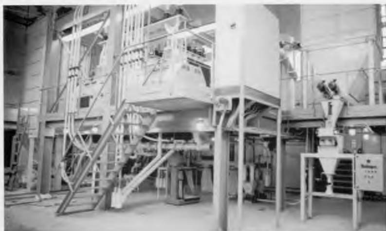
Итальянский мельничный комплекс фирмы «SICOM», построенный в агроуниверситете. Воронеж, 2002 год