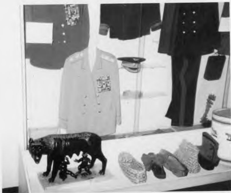
Экспонаты Воронежского областного краеведческого музея, в том числе трофеи Красной Армии