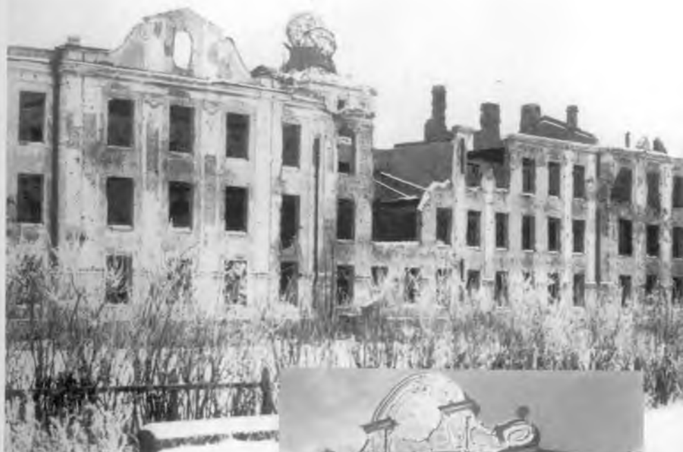
Разрушенный фашистами глав- ный корпус Воро- нежского сельхо- зинститута, январь 1943 года