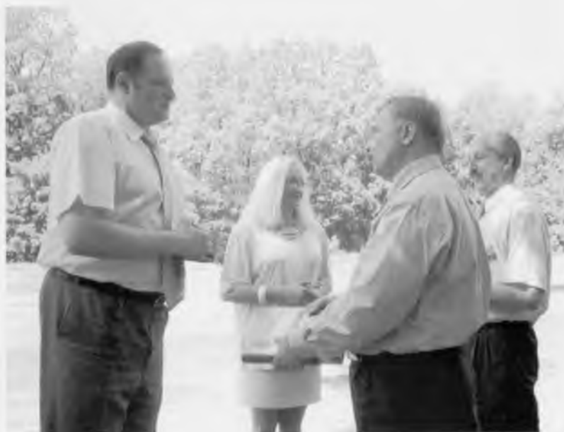
Вручение Послу Венгерской Республики в России г-ну Ференцу Контра юбилейной книги, посвященной 90-летию агроуниверситета. Воронеж, 2003 год