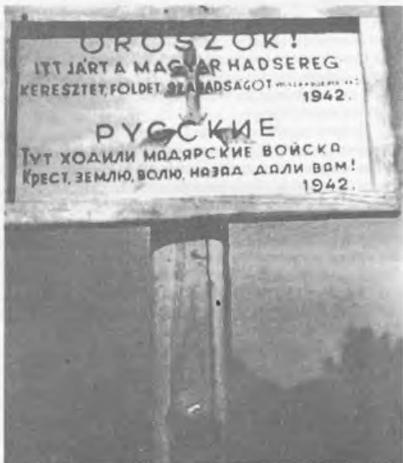
Пропагандистские щиты венгерских войск в районе Дона. Осень 1942 г. 1