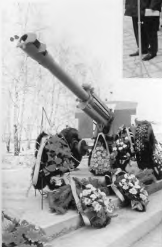
Автор мемориала — скульптор А.И.Кожевников