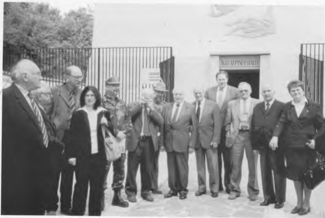
Участники международной конференции в городе Тренто (Италия). 29-30 апреля 2003 года