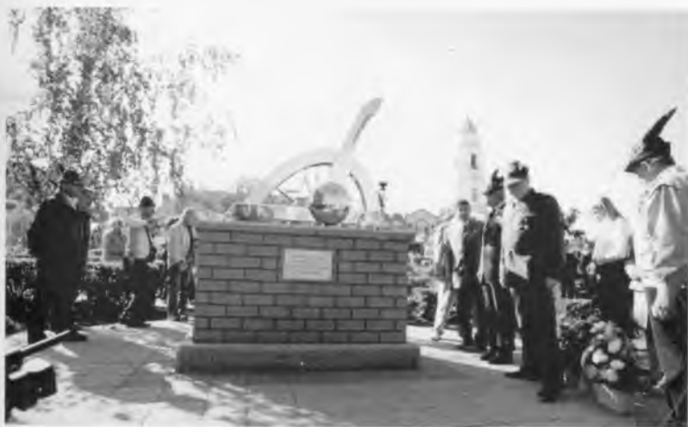
Памятный знак в честь российско-итальянской дружбы в городе Россоши. 14 сентября 2003 г.