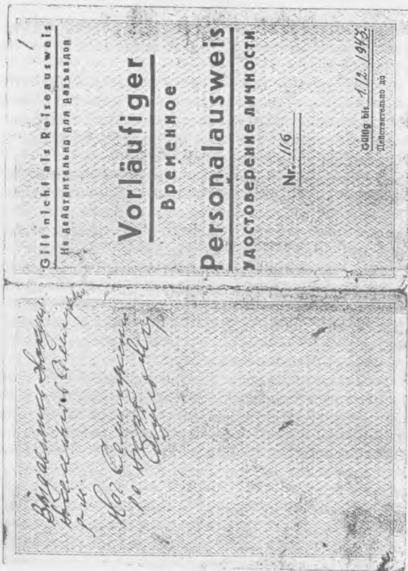
Временное удостоверение личности, выдававшееся оккупантами некоторым местным жителям. Семилукский район. Декабрь, 1942 г. 1