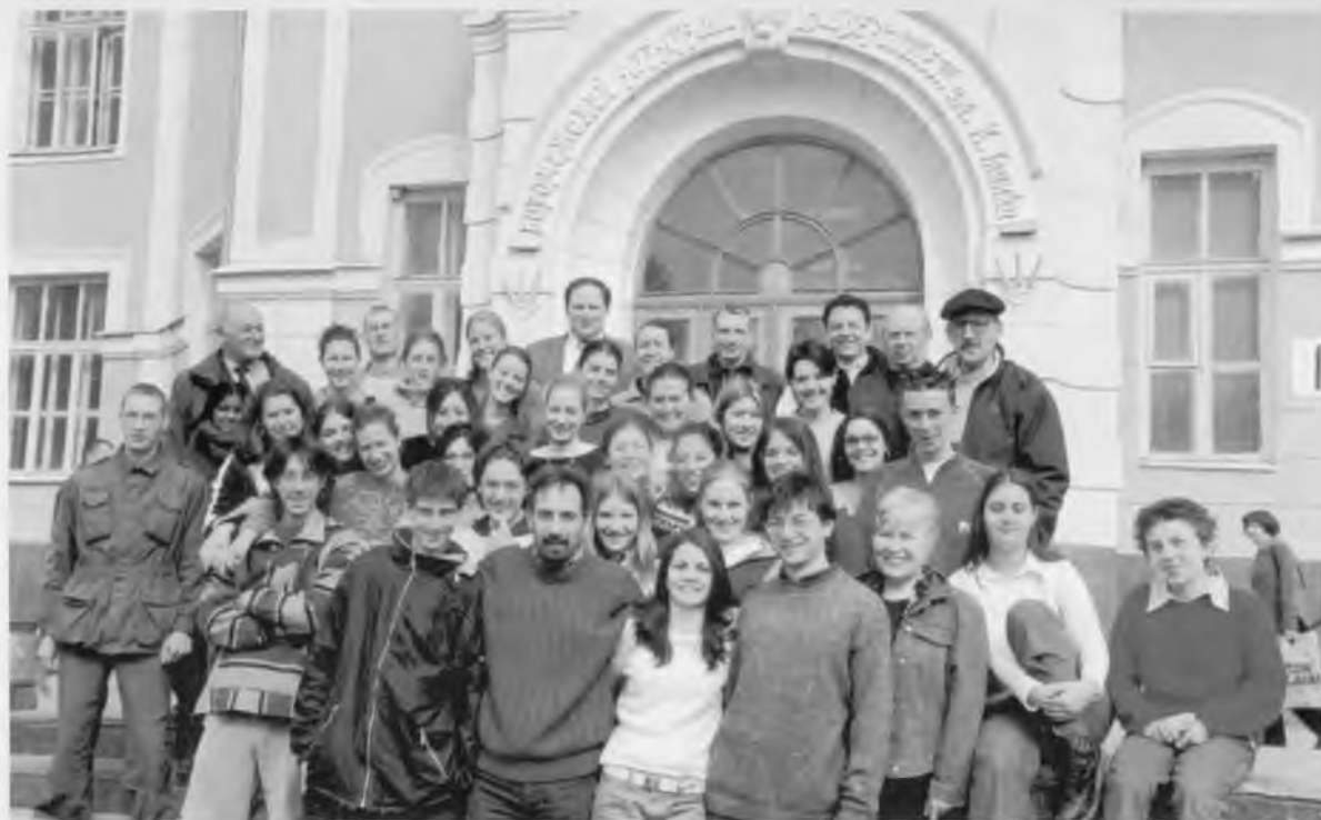
Итальянские студенты посещают первый вуз Центрального Черноземья России – Воронежский государственный аграрный университет им. К.Д. Глинки. Апрель 2003 г.