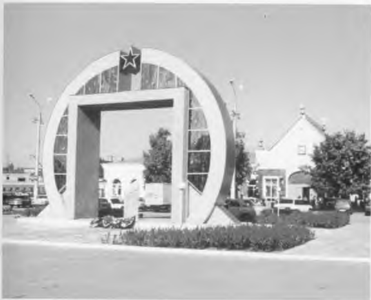
Памятник, посвященный 60-летию Острогожско-Россошанской операции в городе Россоши.