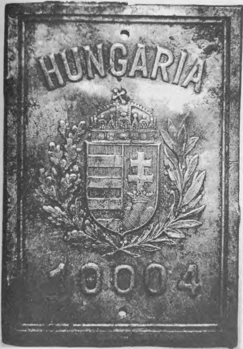
Экспонат музея Воронежского агроуниверситета. Найден в районе боевых действий частей 2-й венгерской армии. Каменский район Воронежской области.