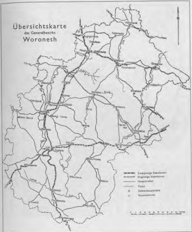
Карта генерального округа «Воронеж». «Новый порядок» в административном делении. 15.01.1942 г. 1