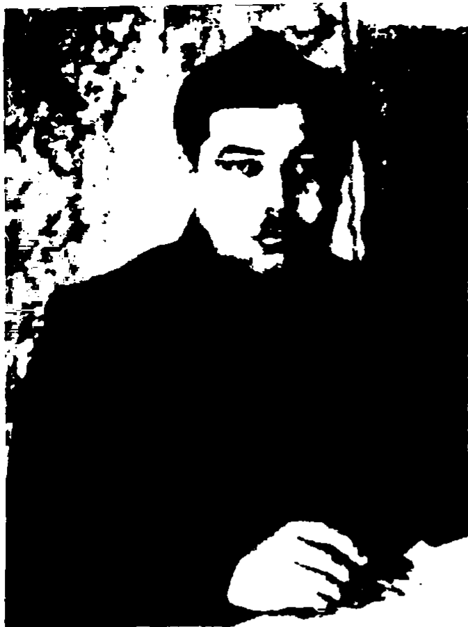
Военный комиссар Омского пехотного училища бригадный комиссар Н. С. Еникеев. Арестован 21 июля 1937 г., оправдан 4 декабря 1939 г., освобожден из заключения