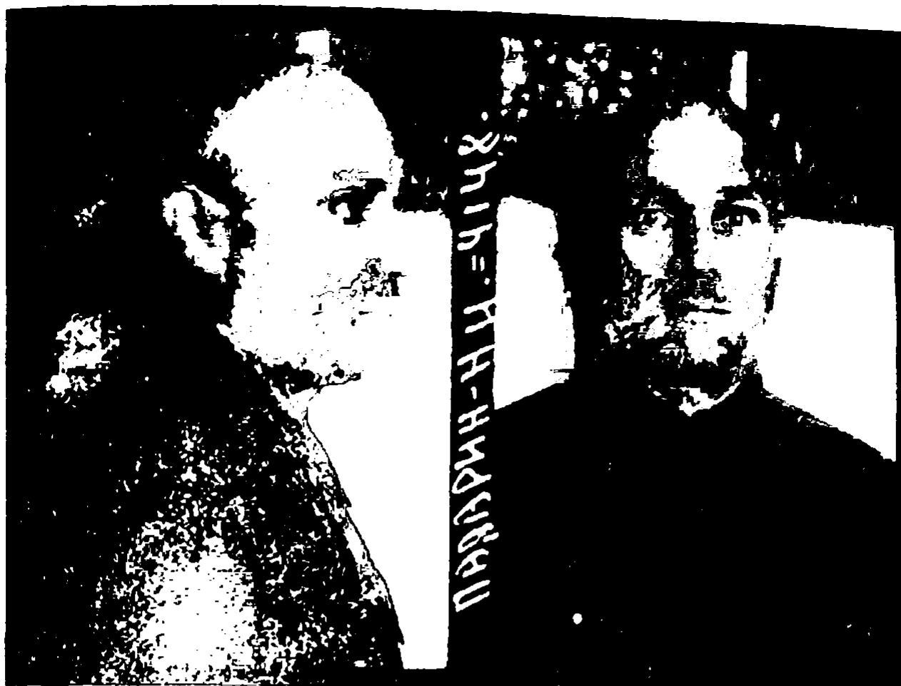
Заместитель начальника политуправления СибВО дивизионный комиссар Н. И. Подарин. Арестован 15 мая 1937 г., приговорен к расстрелу 31 октября 1937 г.