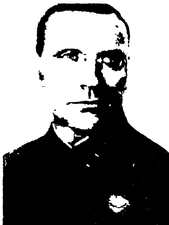
Командующий войсками СибВО комкор Я. П. Гайлит. Переведен на должность командующего войсками УрВО и 15 августа 1937 г. арестован, приговорен к расстрелу 1 июля 1938 г.