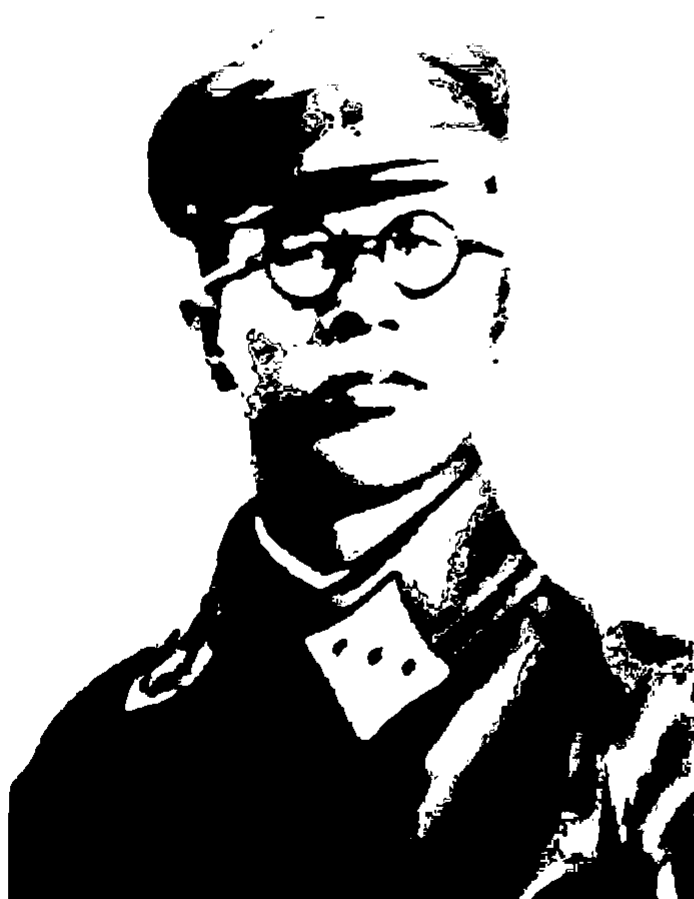
Помощник командующего СибВО по авиации комдив К. В. Маслов. Арестован 13 января 1938 г. приговорен к расстрелу 4 июня 1937 г.