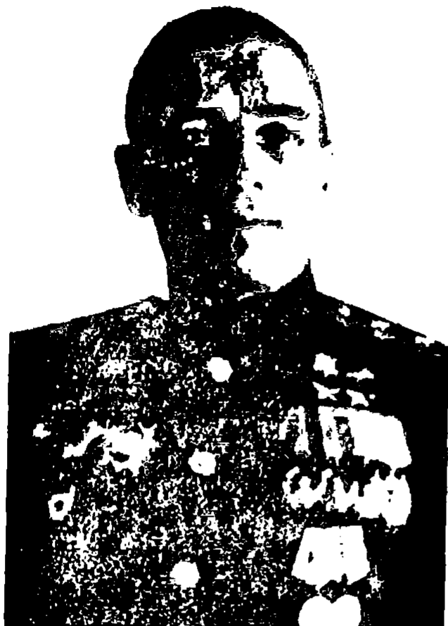
Командир 44-й авиабригады полковник В. Г. Рязанов. Арестован 12 марта 1938 г., освобожден 21 июля 1939 г. (На фото — генерал-лейтенант авиации, дважды Герой Советского Союза)