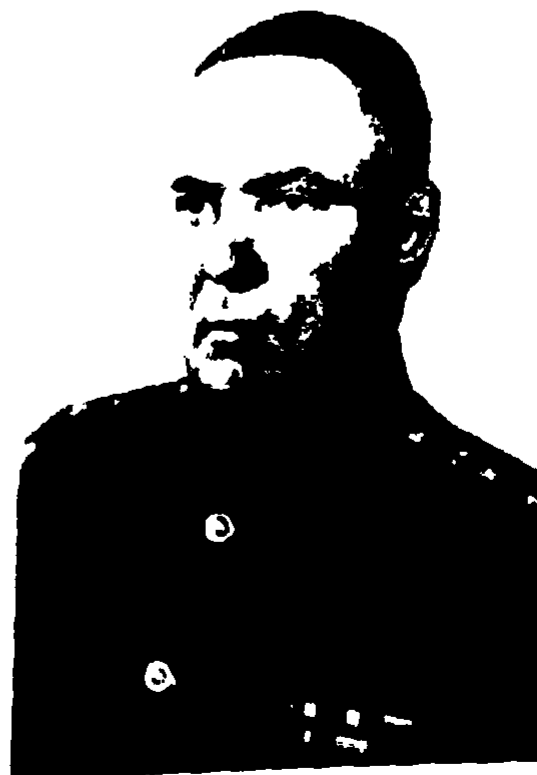
Начальник артиллерии СибВО комбриг Н. А. Дереш. Уволен из РККА 30 декабря 1937 г., позже восстановлен. (На фото — генерал-лейтенант артиллерии)