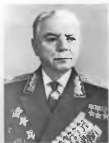
К. Е. Воршилов. Указом Президиума Верховного Совета СССР от 3 февраля 1941 г. его имя присвоено Академии Генерального штаба