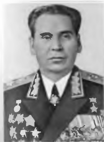
Маршал Советского Союза Н. В. Огарков