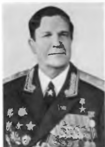
Главный маршал артиллерии В. Ф. Толубко