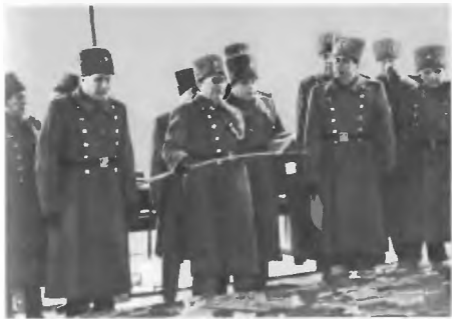
На учениях в поле. В центре — начальник академии генерал армии М. М. Коалов. 1984 г