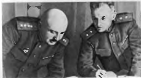
Командующий войсками 1-го Прибалтийского фронта генерал армии И. X. Баграмян и начальник штаба генерал-лейтенант В. В. Курасов