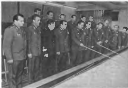
Занятие со слушателями Высших академических курсов. 1985 г.