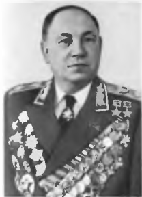
Маршал Советского Союза М. В. Звезлов