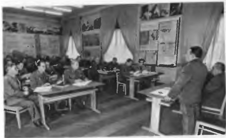
Генерал-полковник И. П. Семенов на семинаре секретарей партийных организаций. 1984 г.