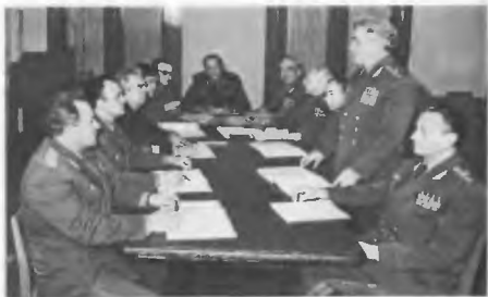
Занятие по марксистско-ленинской подготовке в группе генерал-лейтенанта И. Б. Шапошникова. 1985 г.