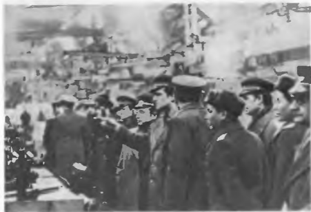
На автозаводе имени Ленинского комсомола