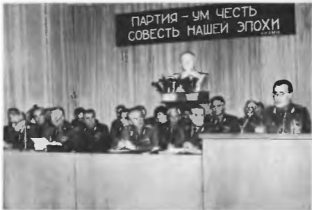
Президиум партийной конференции Академии. На трибуне — генерал-полковник М. И. Дружинин, декабрь 1985 г.