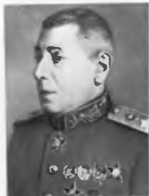
Начальник академии Маршал Советского Союза Б. М. Шапошников