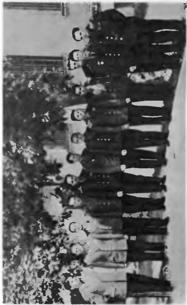
Группа слушателей, окончивших академию с отличием и золотой медалью. 1967 г.