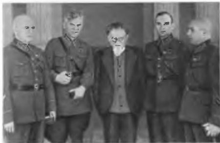
Председатель Президиума Верховного Совета СССР М. И. Калинин среди преподавателей академии, награжденных орденами за боевые заслуги. 1940 г