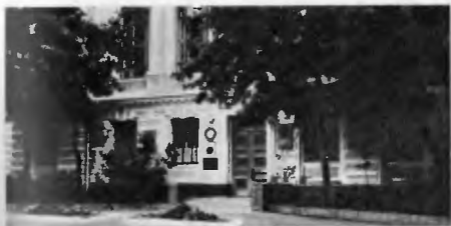
Здание академии в Хользуновом переулке

Директиве В. И. Ленину главному комиссару военных учебных заведений от 10 марта 1918 г.