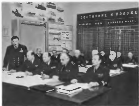
Вице-адмирал Р. А. Голосов на методическом занятии, 1985 г