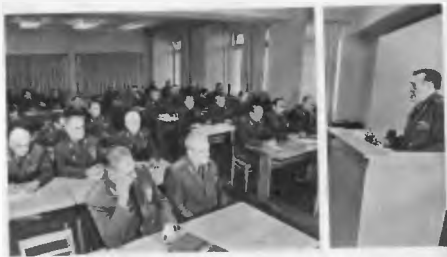
Собрание в первичной партийной организации. 1985 г.