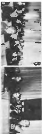
Расширенное заседание Совета академии, посвященное 100-летию со дня рождения М. В. Фрунзе, 1984 г.