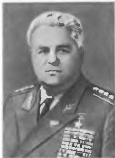
Начальник академии генерал армии С. П. Иванов