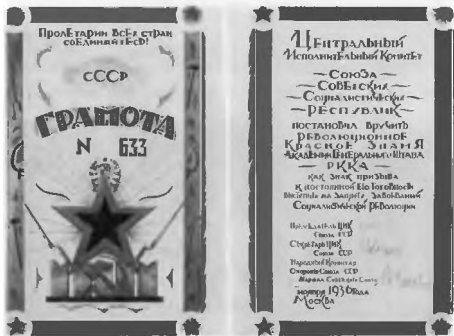
Грамота ЦИК СССР