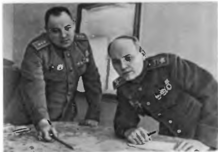
Начальник штаба 2-го Украинского фронта генерал-полковник М. В. Захаров докладывает командующему войсками фронта Маршалу Советского Союза И. С. Коневу план операции