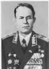
С. Ф. Ахромеев