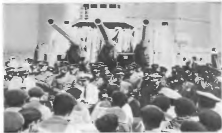
Встреча слушателей с личным составом крейсера Краснознаменного Черноморского флота 1972 г.