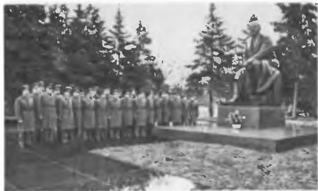
Слушали академии у памятника В. И. Ленину в Кремле