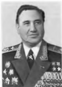
Главный маршал авиации А. И. Колдунов