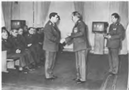
Вручение государственных наград личному составу академии в связи с 40-летием Победы в Великой Отечественной войне