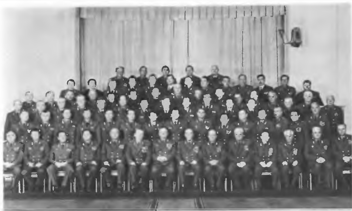
Маршалы Советского Союза С. Л. Саволов и С. Ф. Азроев среди руководящего состава академии и выпускников ВАК, 1985 г.