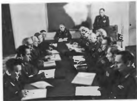
Обсуждение рукописи военно-теоретического труда под руководством генерал-полковника В. Н. Карпова. 1985 г.