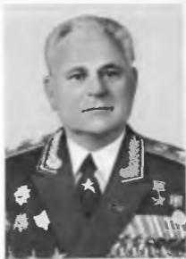
Генерал армии Е. Ф. Ивановский