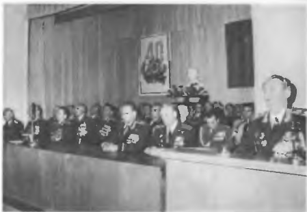
Торжественная собрание, посвященное 40-летию Победы советского народа в Великой Отечественной войне