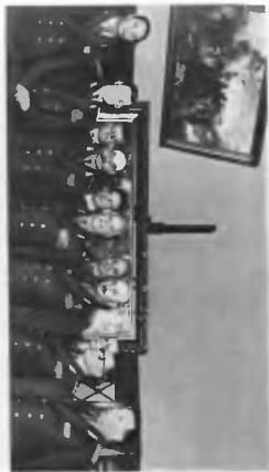
Делегация владимирцев у Маршала Советского Союза Г. К. Жукова в День его 60-летия. Дзехор, 1956 г.