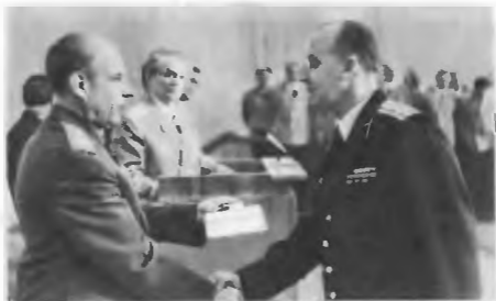
Маршал Советского Союза С. Ф. Ахромеев вручает диплом и звание об окончании академии на выпуске в 1985 г.