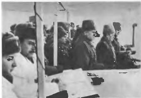
На наблюдательном пункте во время учений в поле