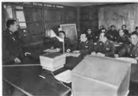
Генерал-майор авиации В. Г. Рог на занятии кружка членов ВНО. 1984 г.