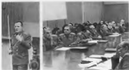
Защита диссертации воспитанником академии летчиком-космонавтом Г. С. Титовым