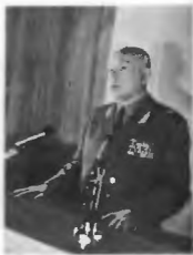
Лекция генерал-майора И. И. Ануреева. 1984 г.