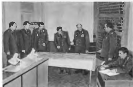
Занятия со слушателями в классе