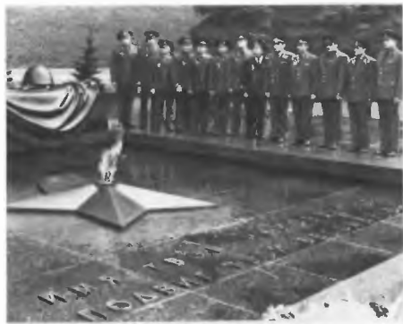
У могилы Неизвестного солдата