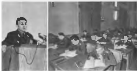
Лекция генерал-майора М. И. Ясюкова. 1984 г.