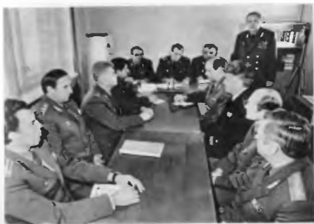
Генерал-лейтенант К. С. Ганеев на подведении итогов учебы. 1985 г.