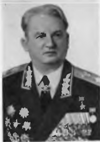
Маршал Советского Союза С. К. Куркоткин