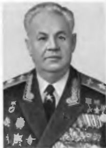
Маршал авиации А. Н. Ефимов