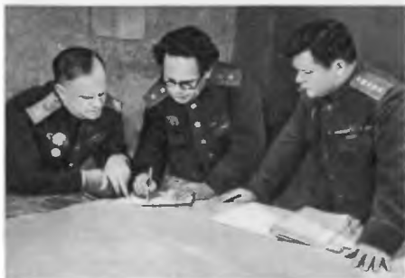
Командующий войсками 1-го Украинского фронта генерал армии Н. Ф. Ватулин (справа) и начальник штаба генерал-лейтенант А. Н. Боголюбов докладывают заместителю Верховного Главнокомандующего Маршалу Советского Союза Г. К. Жукову замысел операции