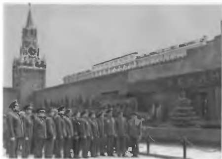
Слушатели академии у Мавзолея В. И. Ленина

Возложения венка слушателями академии к мемориальному комплексу на Сепун-горе в Севастополе