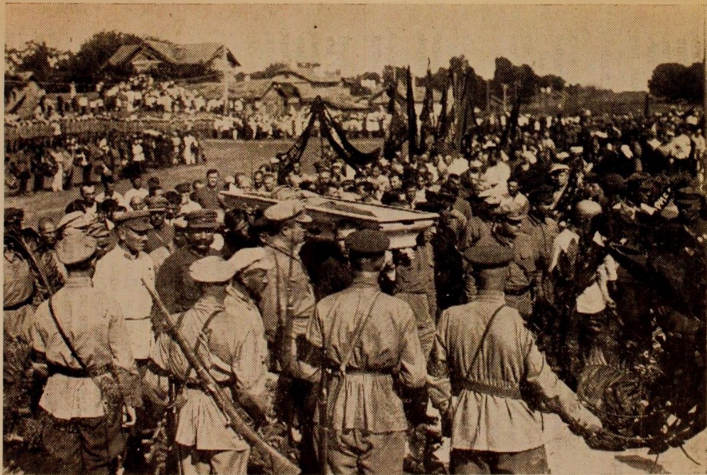
Похороны т. Котовского в Бирзуле.