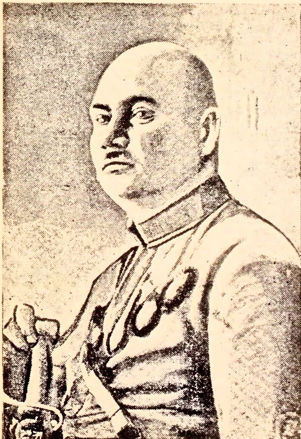
Григорий Иванович Котовский.