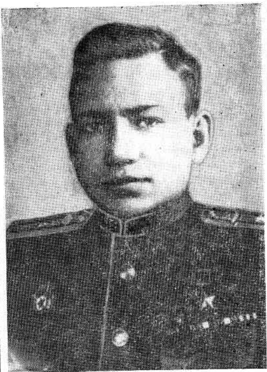
Герой Советского Союза гвардии майор АХМАДУЛ ХОЗЕЕВИЧ ИШМУХАМЕТОВ