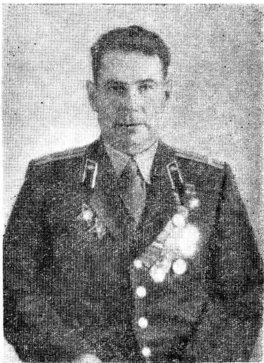
Герой Советского Союза КОНСТАНТИН ФОМИЧ ШУВАЛОВ