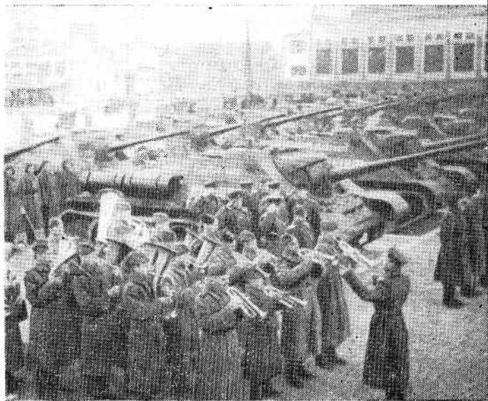
Уральские добровольцы получают боевую технику на одном из заводов урала.