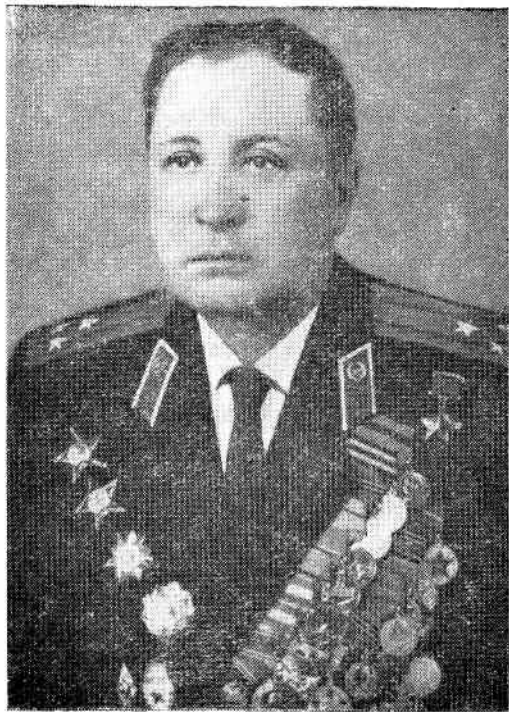
Герой Советского Союза гвардии полковник ФЕДОР ИВАНОВИЧ ДОВОРЦЕВ