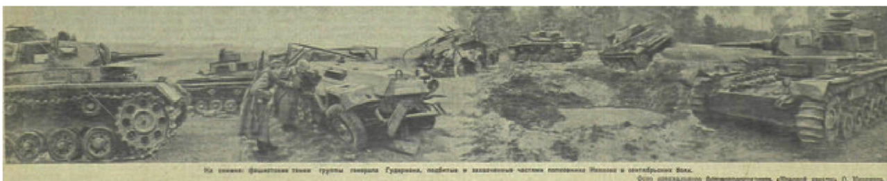
Фото 2. Там же, после удара советских лётчиков