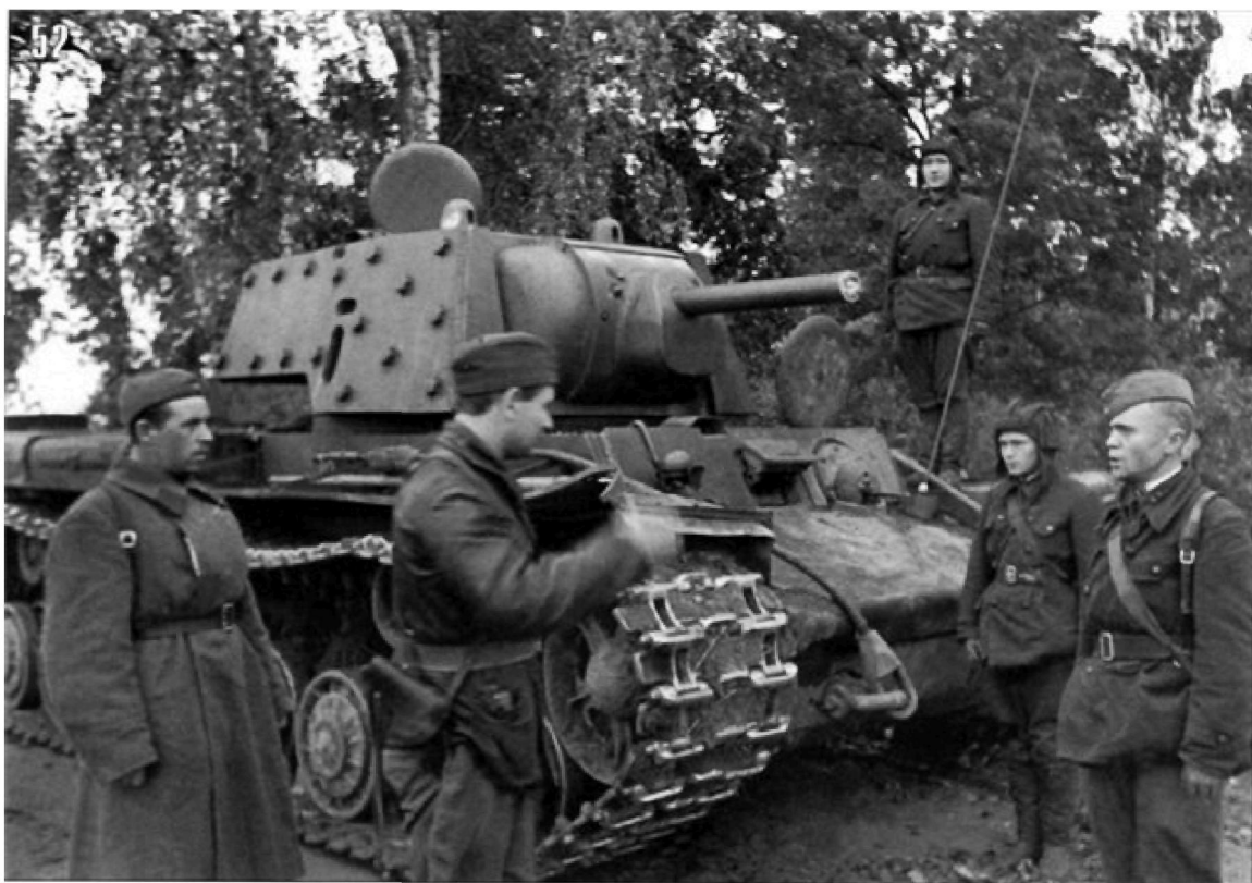
Фото 11-12. Танкисты 121-й танковой бригады и артиллеристы Брянского фронта. Август-сентябрь 1941 г.