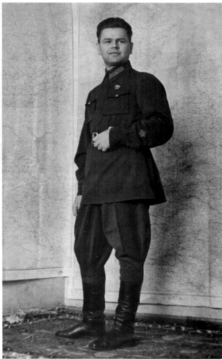
Бригадный комиссар Владимир Андреевич Овчаренко. 20 января 1942 г.