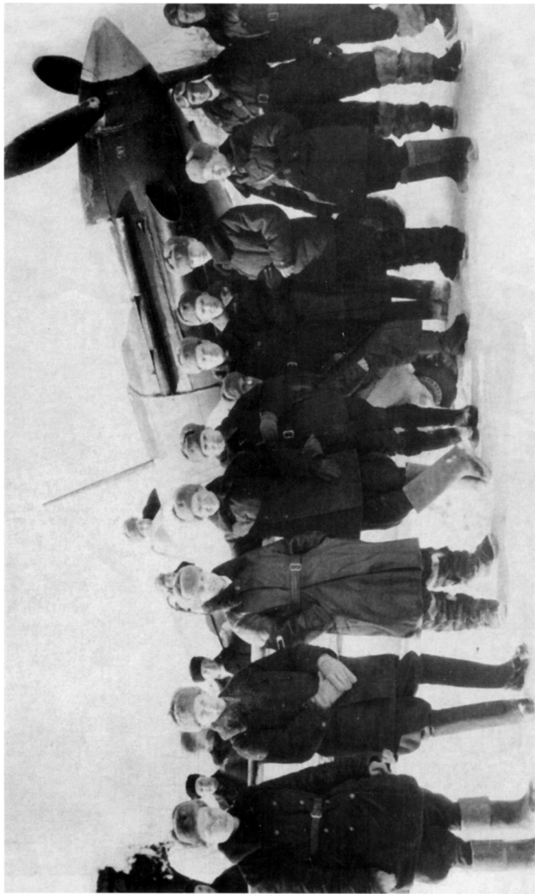
Летчики 154-го АИП на аэродроме у д. Плеханово. Зима 1942 г.