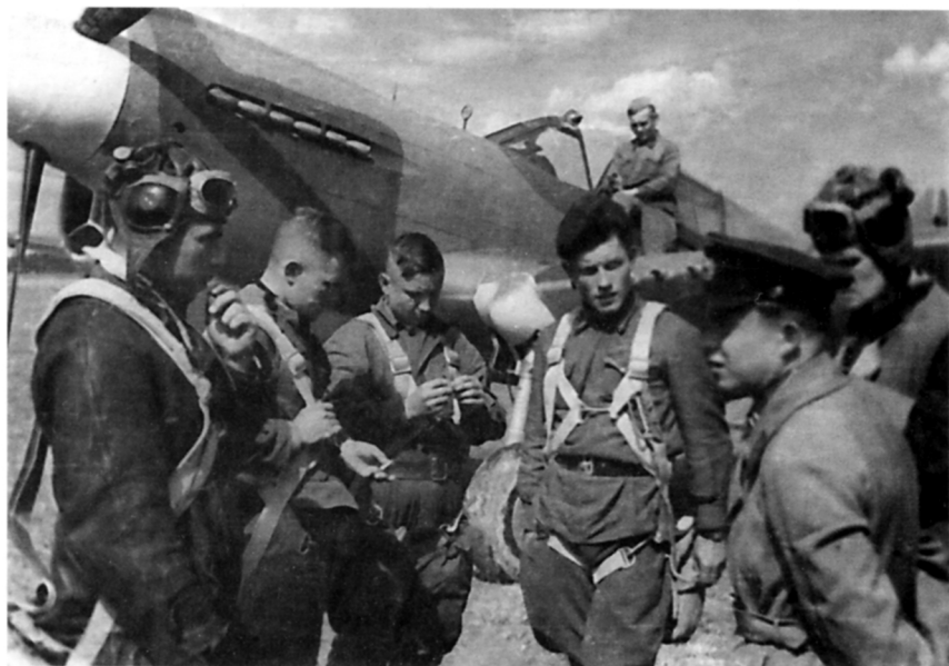
Перед боевым вылетом