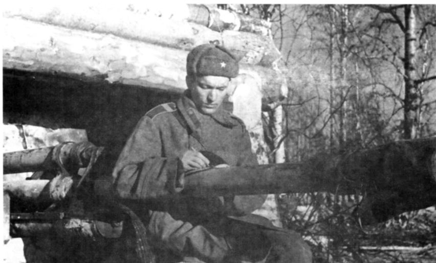
Письмо с фронта