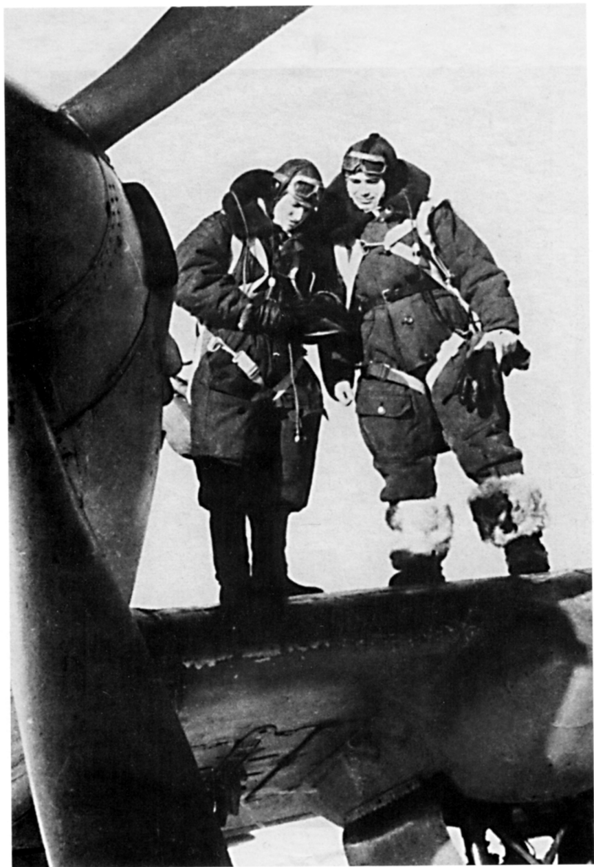
Перед боевым вылетом