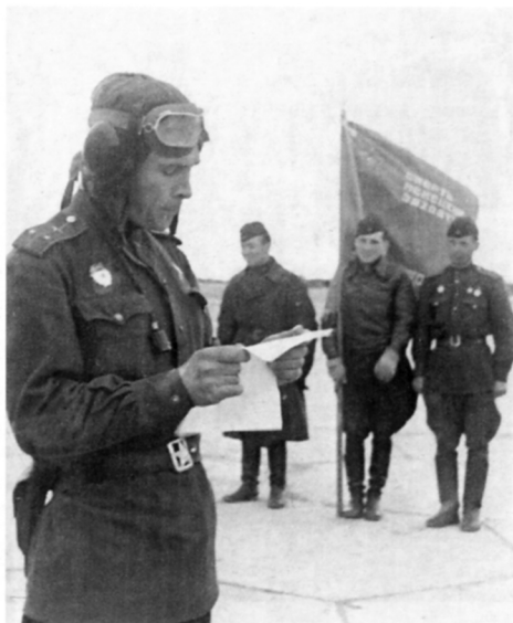
Летчики 29-го ГИАП слушают приказ НКО СССР о присвоении полку наименования «Волховский»