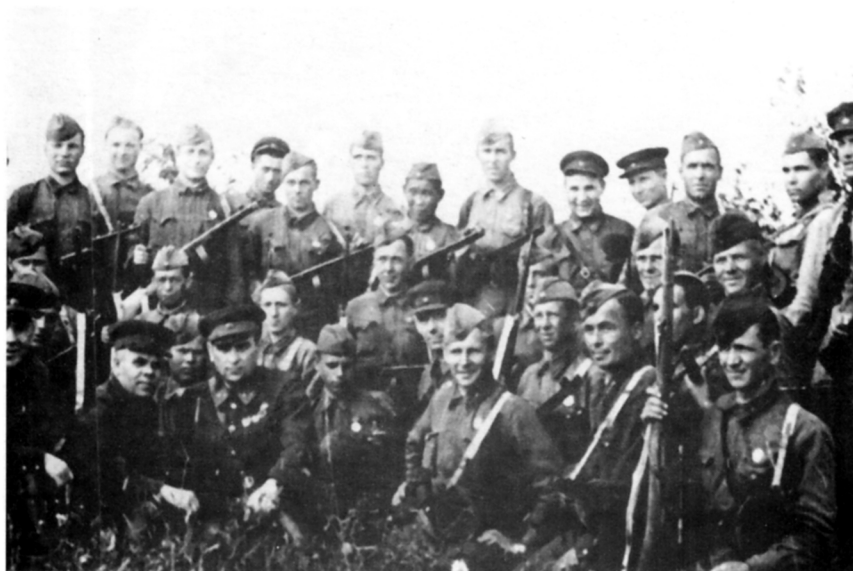
Слет лучших воинов 54-й армии