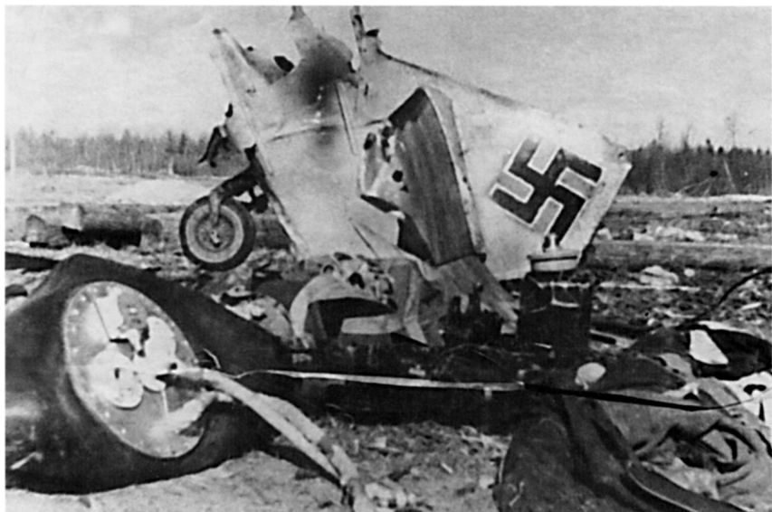
Сбитый фашистский самолет