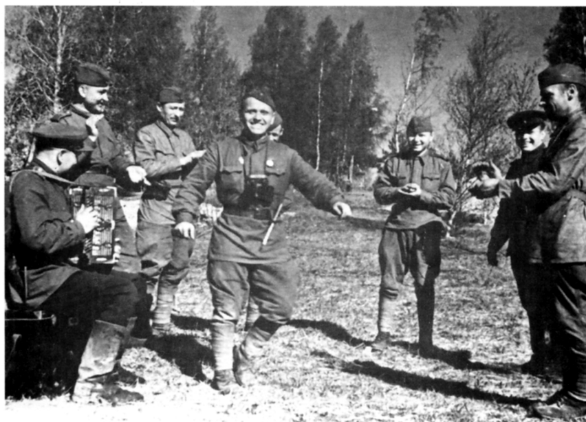
В часы досуга