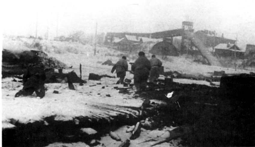
Бой за Любань