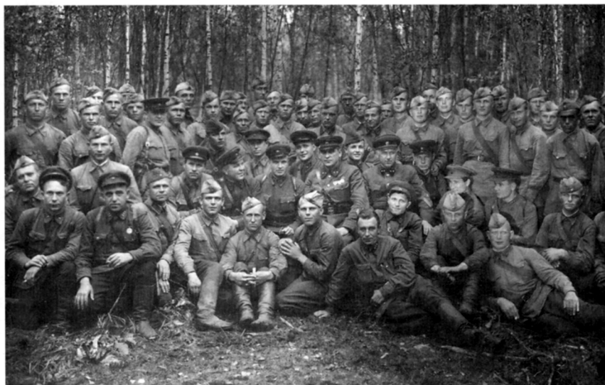
Группа награжденных бойцов и командиров 54-й армии. Август 1942 г.