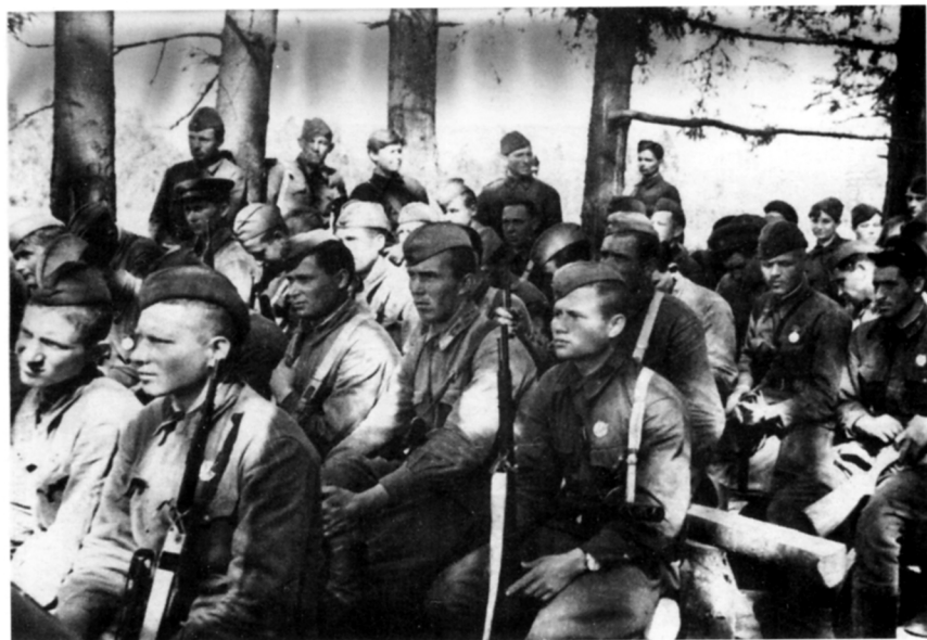
Волховский фронт. 2-й слет снайперов 54-й армии