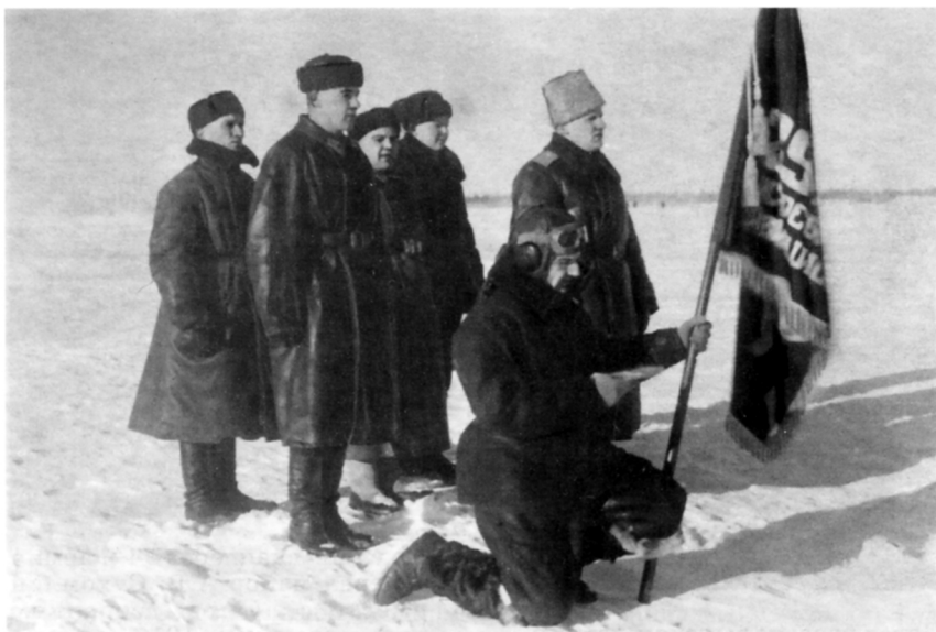
Вручение гвардейского знамени 29-му ГИАП