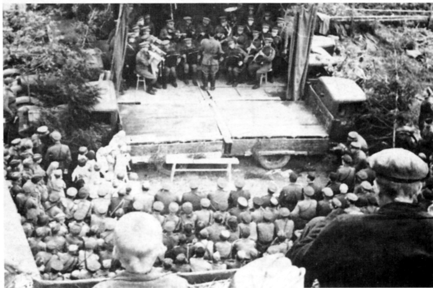
Волховский фронт. Выступает оркестр 54-й армии