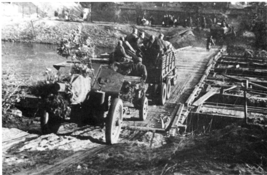
Переправа через реку