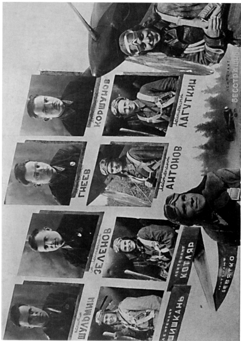
Фотогазета, посвященная лучшим летчикам-истребителям 154-го истребительного авиационного полка