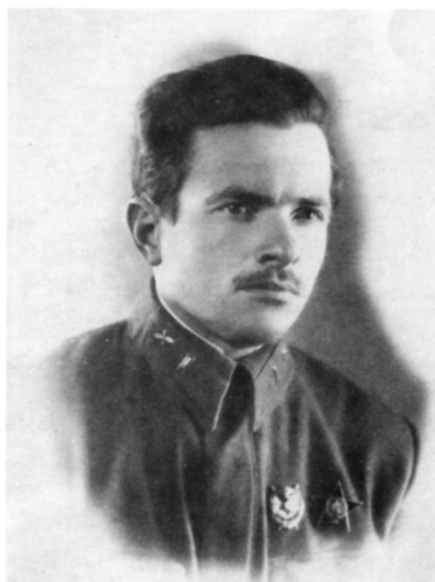
Летчик-истребитель, дважды Герой Советского Союза П.А. Покрышев