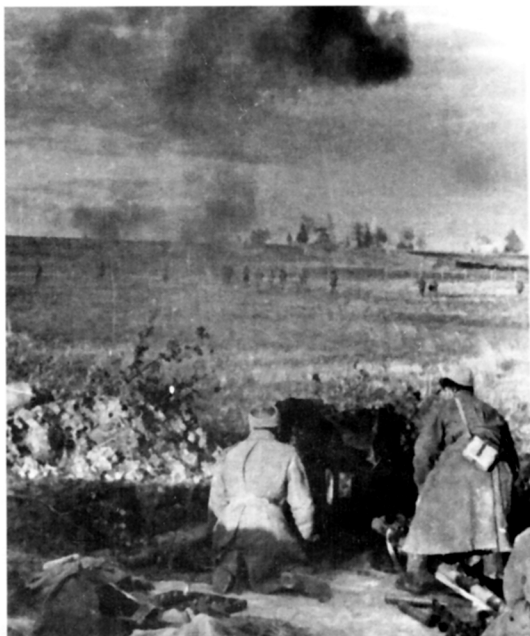
Волховский фронт. Бой за населенный пункт