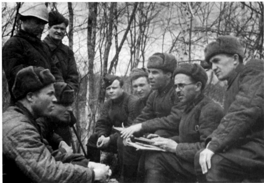
Прием в партию на передовой