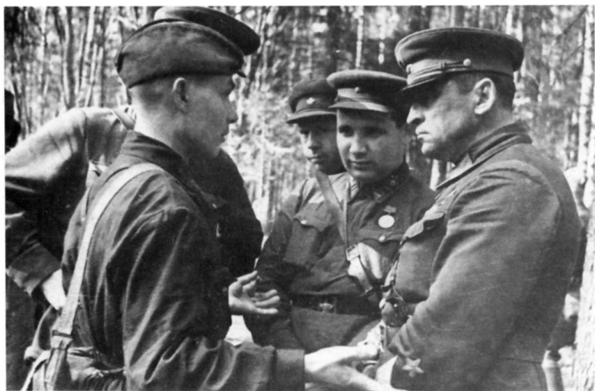
Генерал А.В. Сухомлин беседует с бойцами