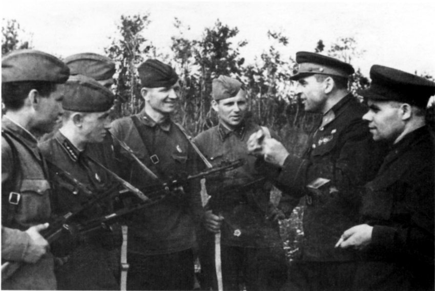
Участники 1-го слета снайперов 54-й армии