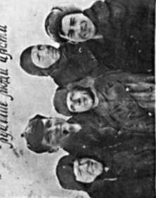
КОМАНДА ИСТРЕБИТЕЛЬНОГО АВИАЦИОННОГО ПОЛКА 1-й авиационной армии ВВС РККА Полковник