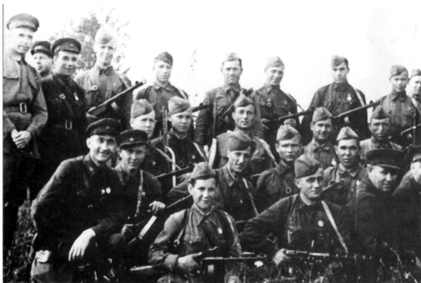
Слет лучших воинов 54-й армии