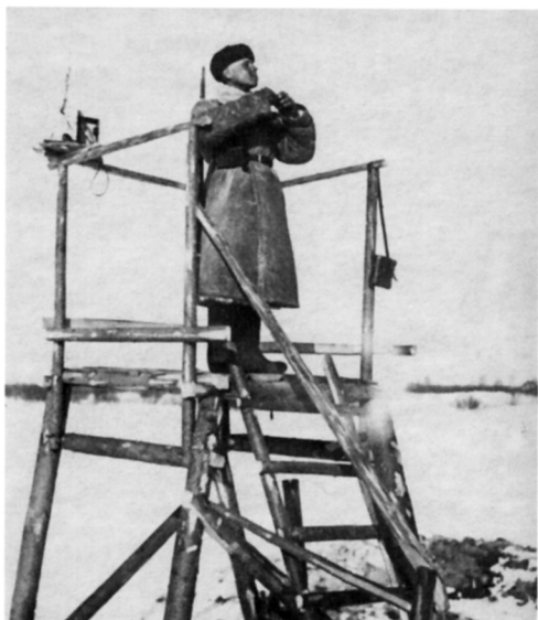
На наблюдательной вышке