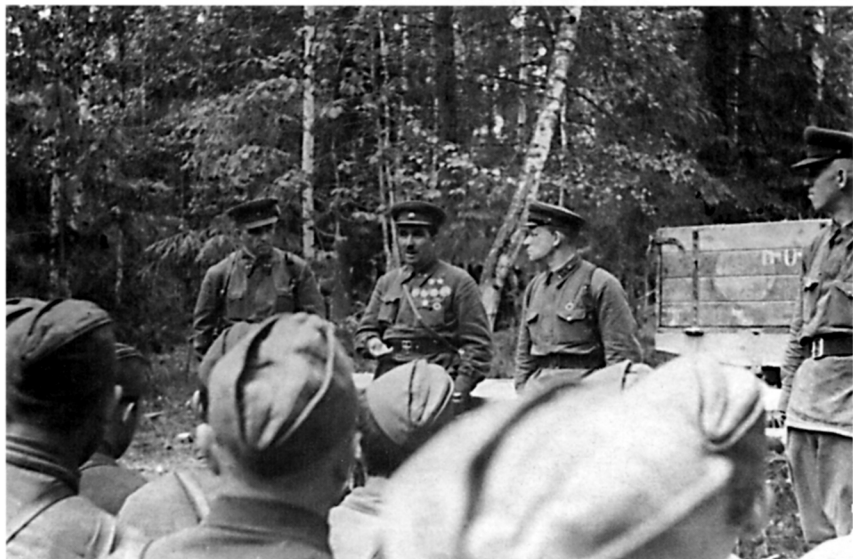
Командующий 54-й армии И.И. Федюнинский беседует с бойцами и командирами