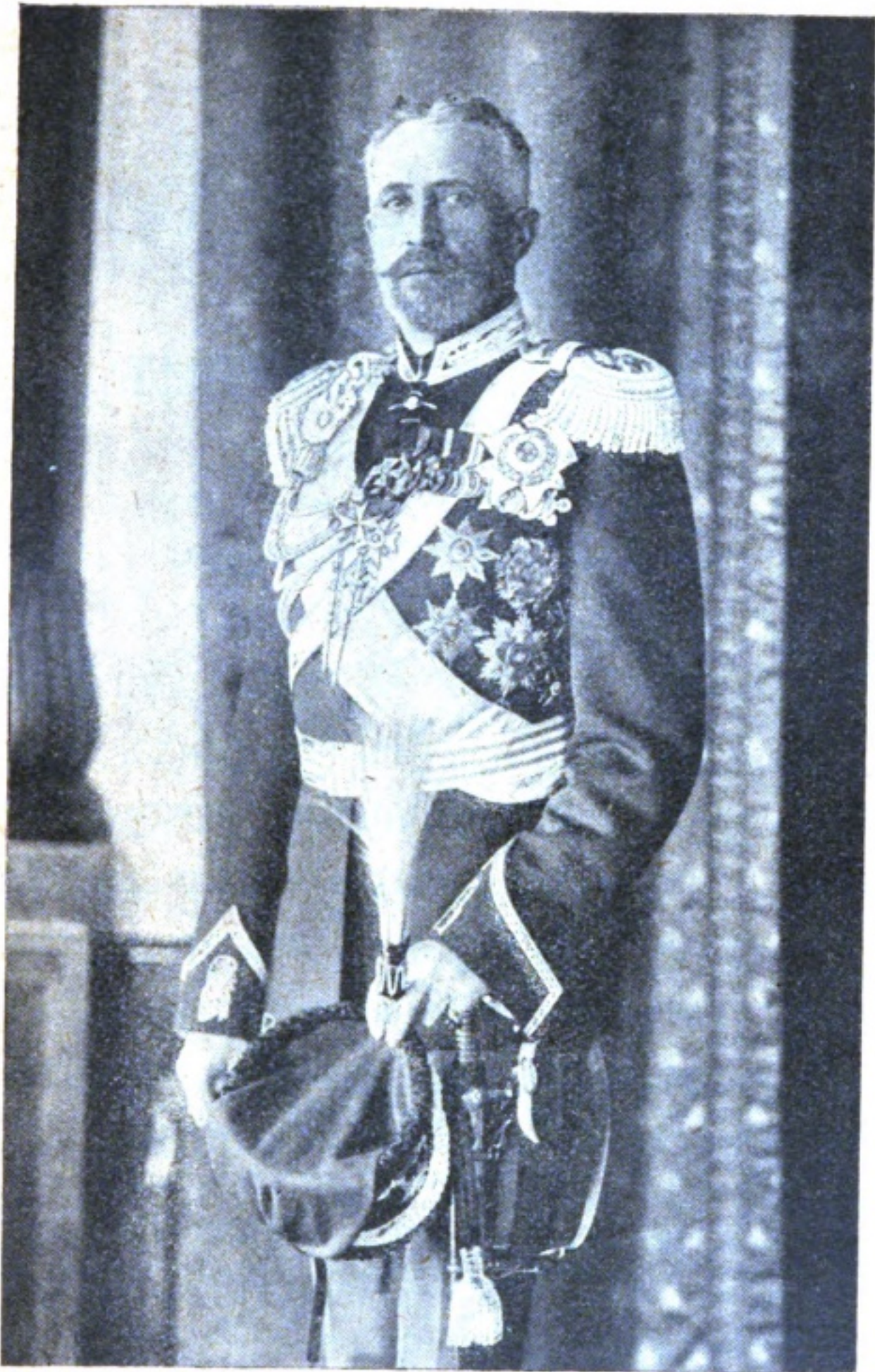
ЕГО ИМПЕРАТОРСКОЕ ВЫСОЧЕСТВО ВЕЛИКИЙ КНЯЗЬ НИКОЛАЙ НИКОЛАЕВИЧЪ ВЕРХОВНЫЙ ГЛАВНОКОМАНДУЮЩИЙ.