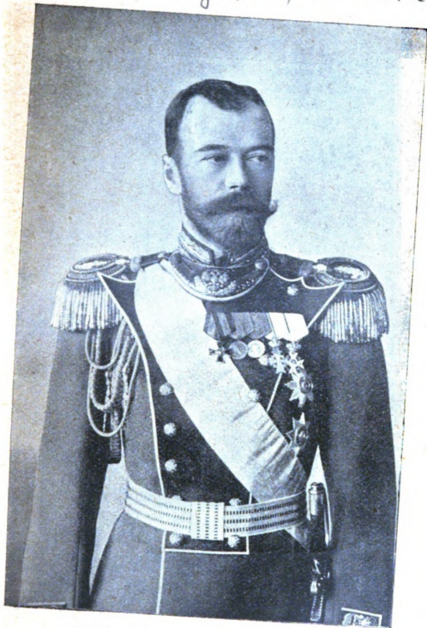
ЕГО ИМПЕРАТОРСКОЕ ВЕЛИЧЕСТВО ГОСУДАРЬ ИМПЕРАТОРЪ НИКОЛАЙ АЛЕКСАНДРОВИЧЪ ВЕРХОВНЫЙ ВОЖДЬ АРМИИ И ФЛОТА.

Russia. Sovereigns, etc., 1894-1917 (Nicholas II)