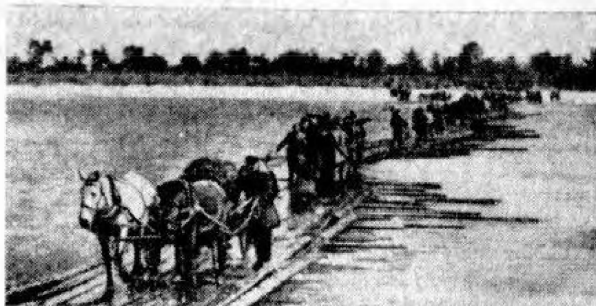
Переправа конников через реку Припять

дал намерения эсэсовцев, отобрал группу конников, вручил им много ракет и приказал: