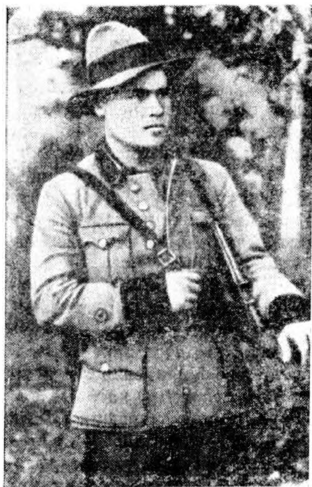
Командир взвода минеров ковпакского соединения, ныне известный поэт Платон Воронько