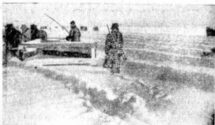
Замерзшее «Князь-озеро», партизанский аэродром

оправдались. Очевидно, враг залечивал раны, полученные в Лельчицах и Бухче.