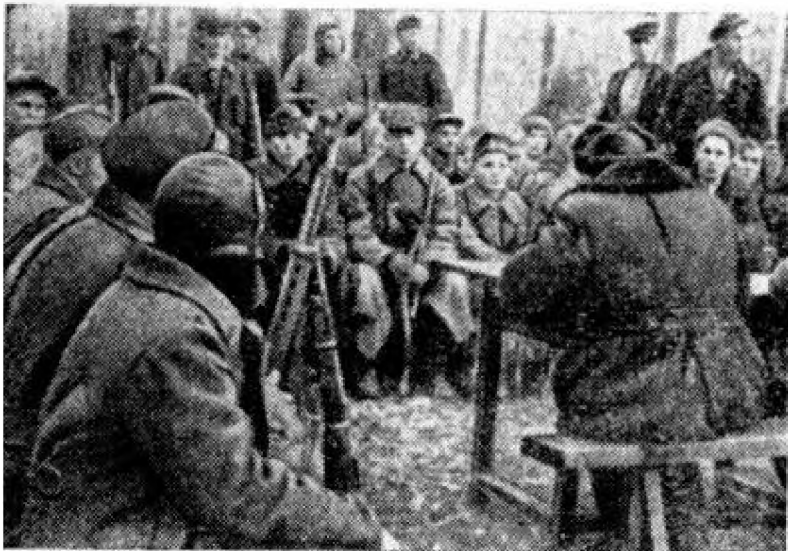
Объединенное партийно-комсомольское собрание ковпаковцев

Который уже раз перелистываю маленькую книжечку в потертом картонном переплете — мой дневник партизанских походов. Вот первая запись: «29 августа 1942 года. Бежали из лагеря группой в количестве 32 человек».