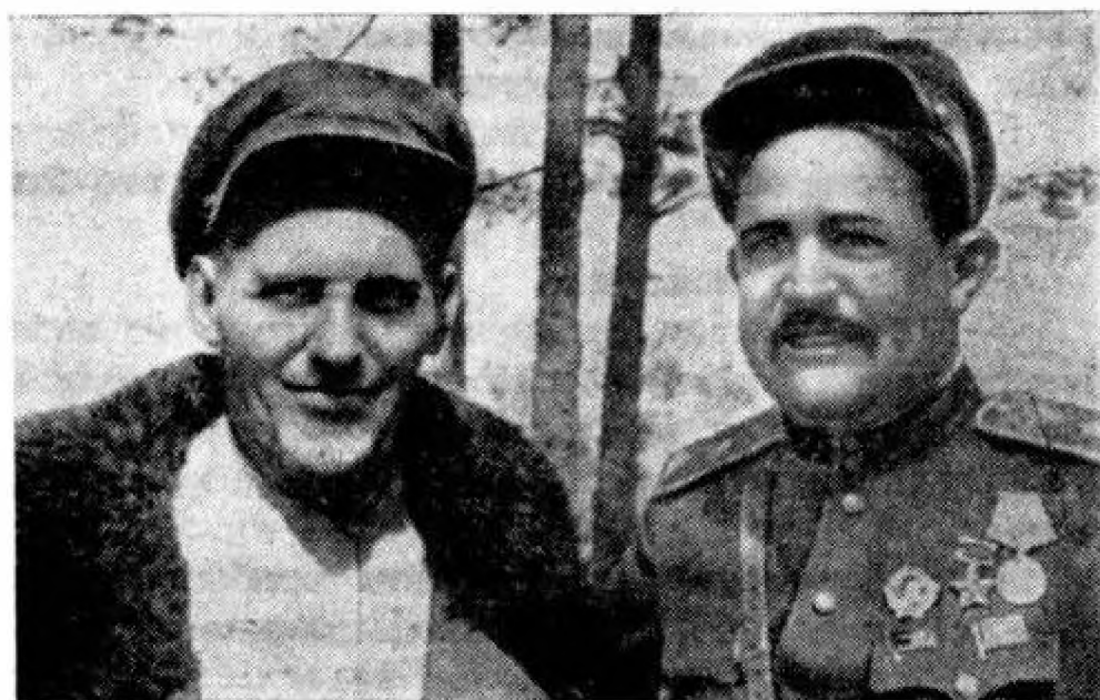
Руководители партизанских отрядов Сумской и Черниговской областей, боевые соратники — генералы Ковпак и Федоров

Когда с пароходами все было покончено, бронекатера обратились в бегство.