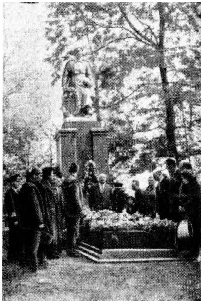
Ветераны-ковпаковцы у братской могилы однополчан, погибших в 1943 г. в боях на реке Припять