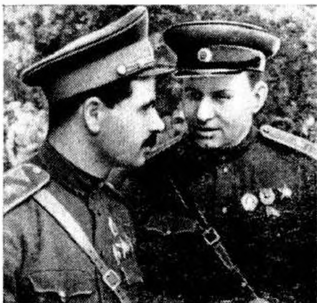
Комиссар соединения С. В. Руднев и начальник штаба партизанского дви- жения Украины Т. А. Строкач

бы в горах, не было у нас такого боевого опыта. Непрístupные вершины, узкие тропы на почти отвесных склонах ограничивали маневренность.