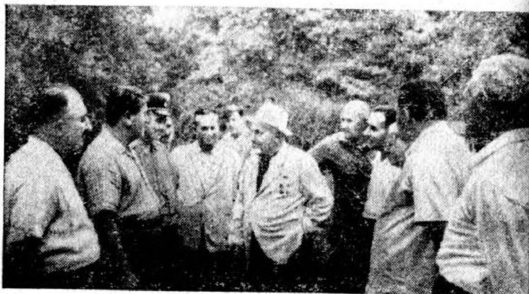
Через два десятилетия... Сидор Артемьевич Ковпак в гостях у своих однополчан на земле Грузии. Телави, совхоз «Цинандали»

Мы вплотную подошли к Полянице. Положение было критическое: надо было во что бы то ни стало прорвать вражеские укрепления.