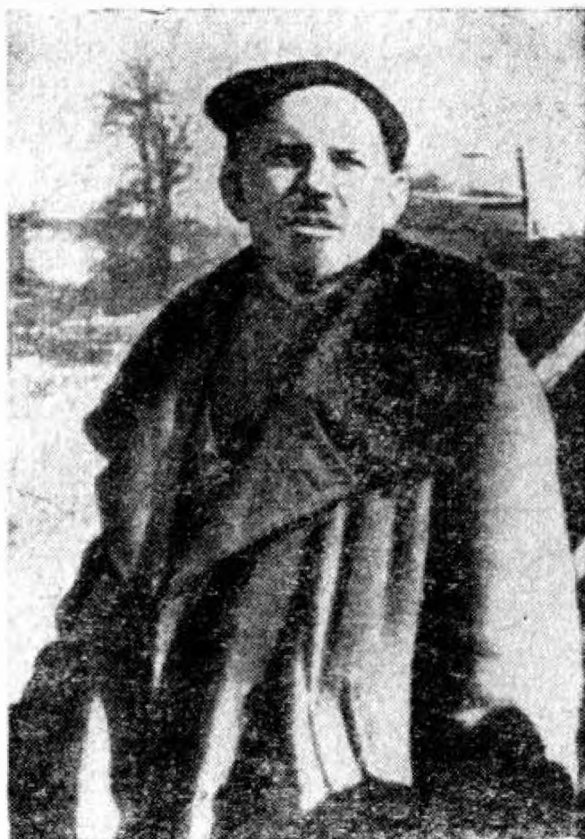
Дважды Герой Советского Союза генерал-майор С. А. Ковпак

— В начале войны, — рассказывает Сидор Артемьевич, — я и Семён Васильевич Руднев вышли одновременно из Путивля, возглавляя небольшие партизанские отряды, которые должны были вырасти в крупные партизанские соединения. Мы действовали в разных направлениях: Руднев вел подготовку в Новослободском лесу, а я — в Спадщанском. Прошло несколько месяцев, мы ничего не знали