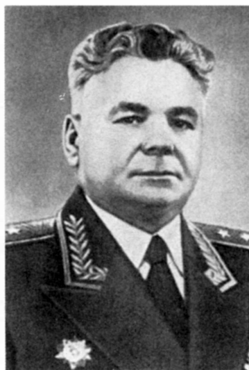
Командующий 19-й армией генерал-лейтенант Г.К. Козлов (май 1943 — май 1945 г.)