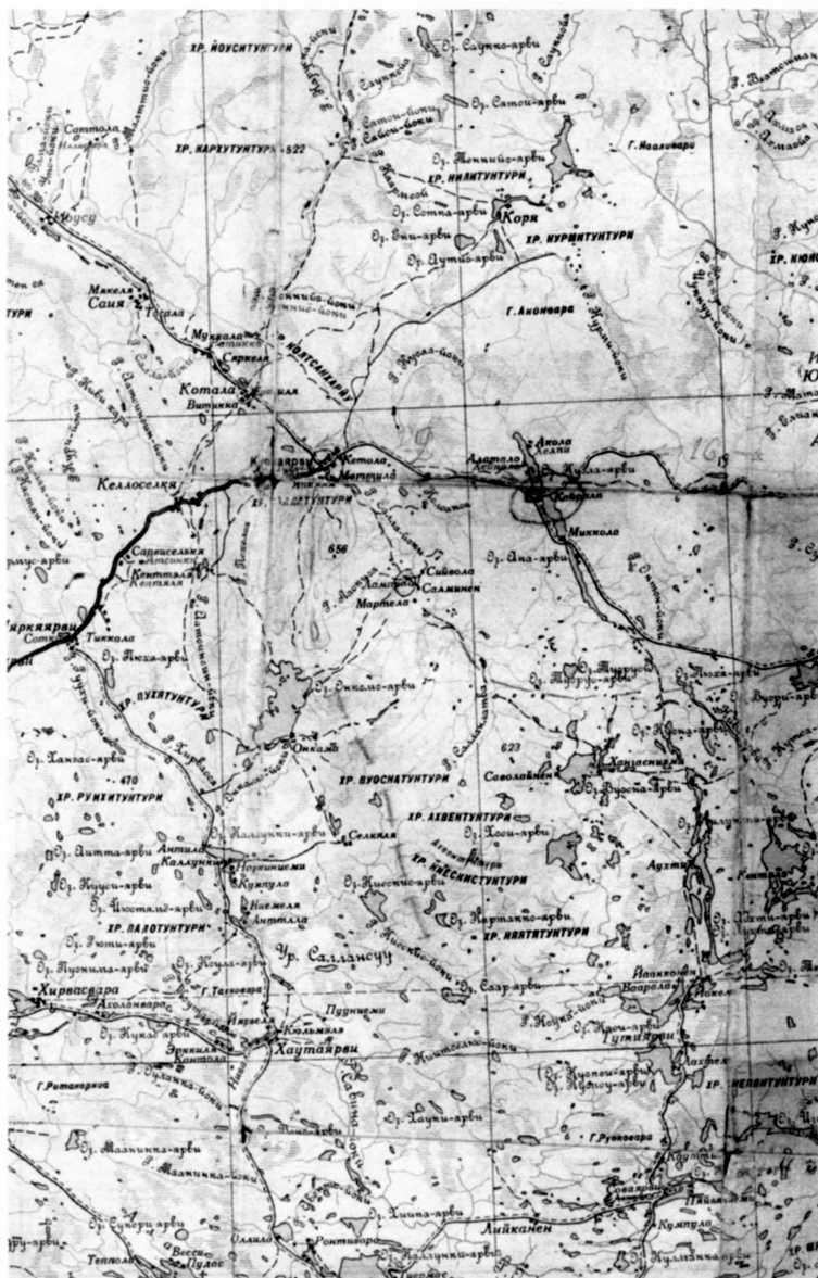
Район действий 122-й стрелковой дивизии в 1944 г. Карта издания 1942 г.