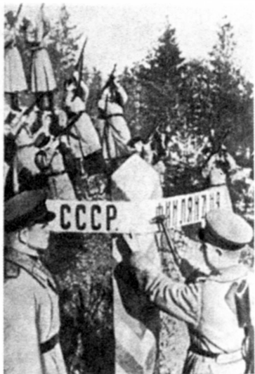
Салют в честь восстановления советско-финляндской границы. 1944 г.