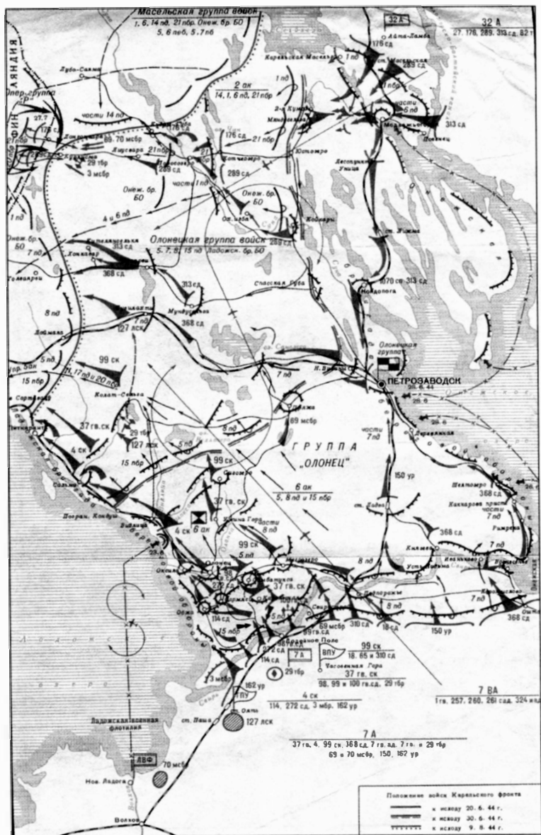
Свирско-Петрозаводская операция (21 июня – 9 августа 1944 г.)