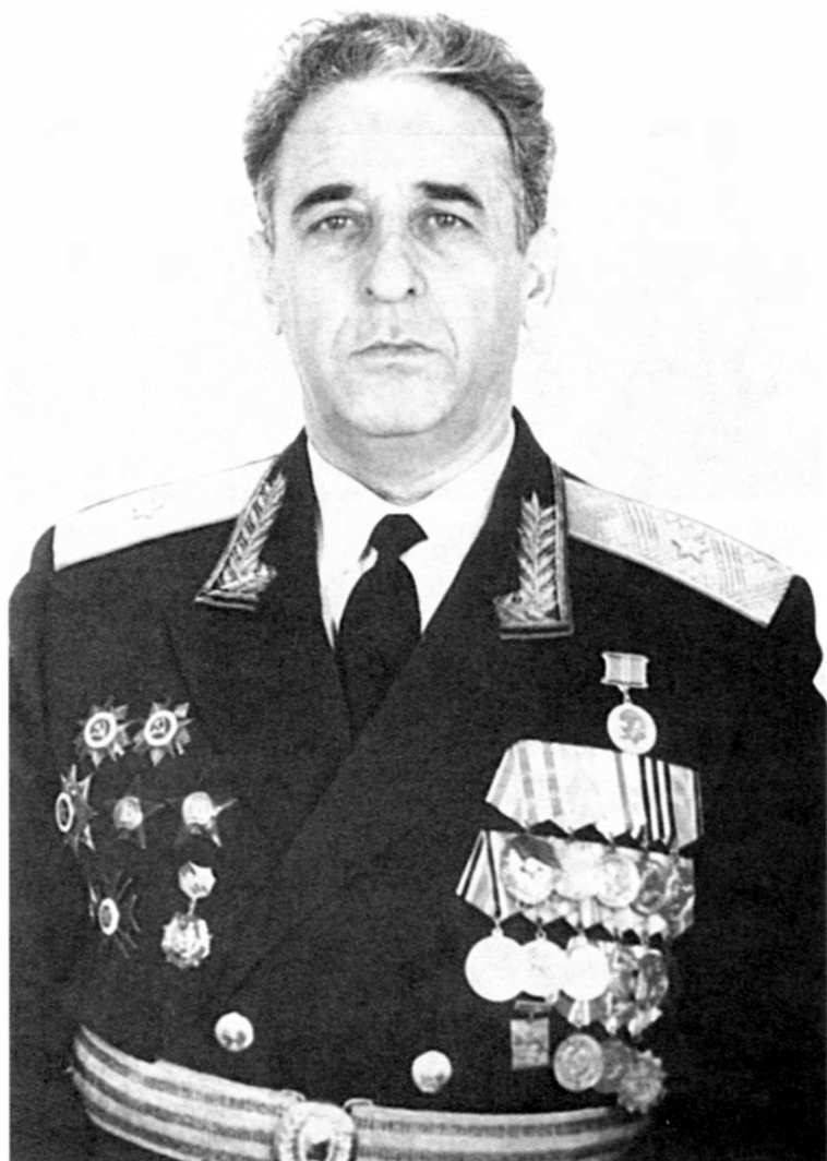
Генерал-майор в отставке Петр Львович Боград. Снимок 1990-х годов