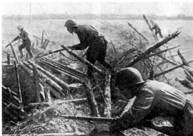
Бои на захваченных плацдармах на западном берегу реки Свирь. Июнь 1944 г.