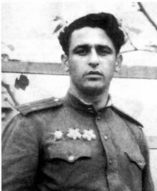
Исполняющий должность командира 596-го стрелкового полка подполковник П.Л. Боград. Снимок сделан на югославно- австрийской границе в апреле 1945 г.