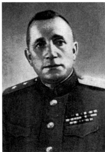
Командующий 7-й отдельной армией генерал-лейтенант А.Н. Крутиков (январь 1943 — август 1944 г.)