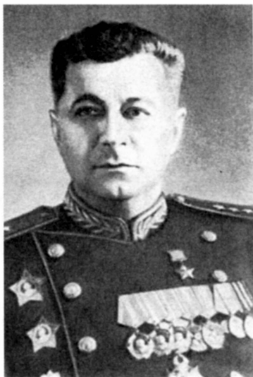
Командующий 7-й отдельной армией генерал-лейтенант С.Г. Трофименко (июнь 1942 — январь 1943 г.)