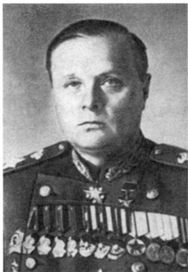
Командующий Карельским фронтом генерал армии (с октября 1944 г. — Маршал Советского Союза) К.А. Мерецков