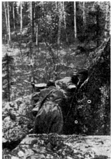
Пулеметный расчет в засаде. Карельский фронт. 1944 г.