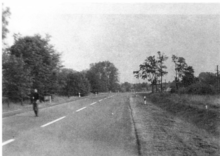
Венгрия. Места ожесточенных боев 122-й стрелковой дивизии в январе – марте 1945 г. Современные снимки. Господский двор Большеберанд, в котором в январе 1945 г. размещался командный пункт дивизии ( вверху ). Подступы к городку Драва-Соболч, где в марте 1945 г. дивизия понесла тяжелые потери