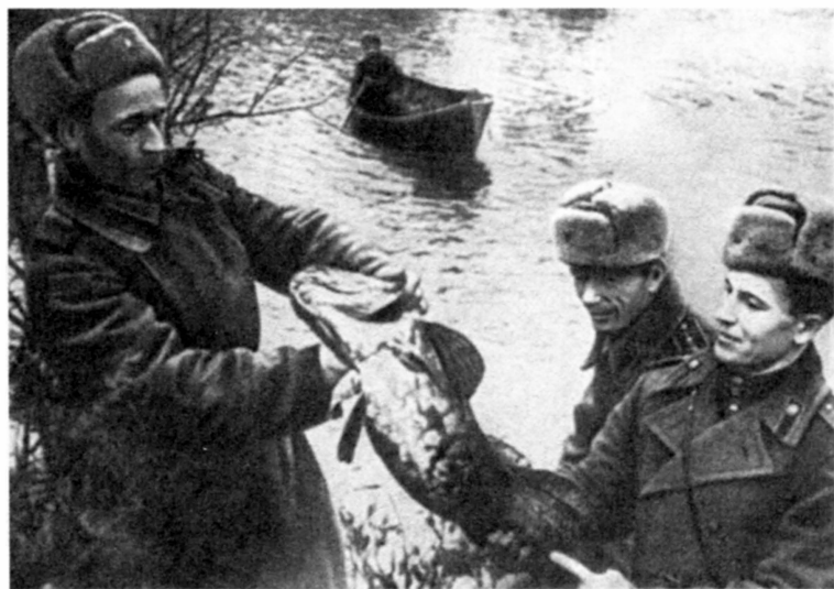
Дополнительное питание. Карельский фронт. 1944 г.