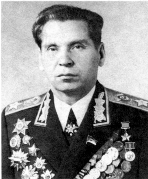
Начальник Генерального штаба Вооруженных Сил СССР – первый заместитель министра обороны СССР (1977–1984) Маршал Советского Союза Н.В. Огарков