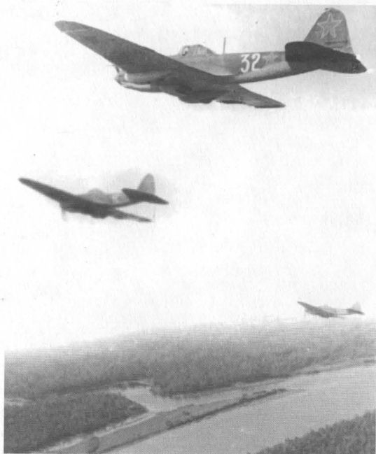
Одноместные Ил-2. Вылет на задание