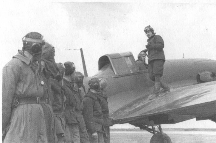
Обучение летчиков, прибывших в полк на пополнение