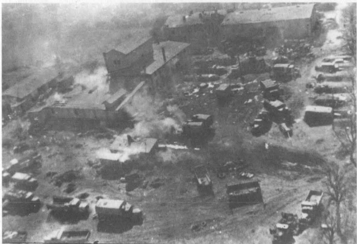
Атака скопления вражеской техники