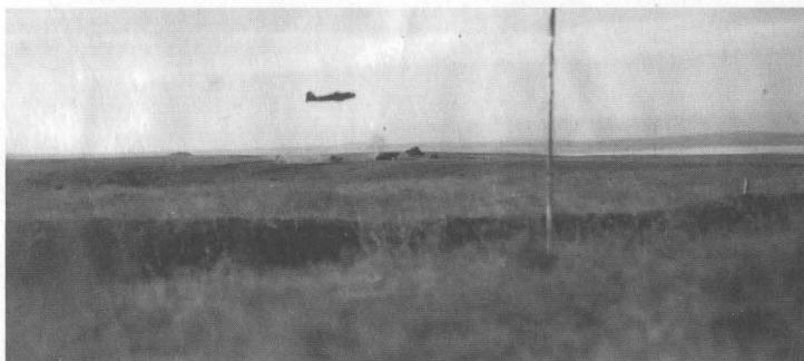
Показной полет перед командующим Особой Приморской армией генералом армии Петровым. Стрельба по танкам и автомашинам после бомбометания 18 декабря 1943 г.