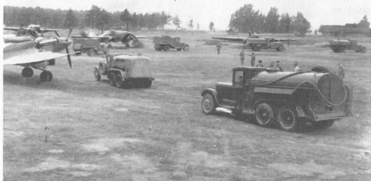
Техническое обслуживание штурмовиков на аэродроме