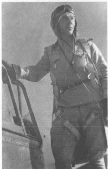
Василий Емельяненко на крыле своего самолета. Август 1943 г.