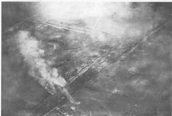
Атака железнодорожного эшелона. Вид из штурмовика