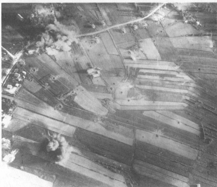
Штурмовики атакуют цели на дороге