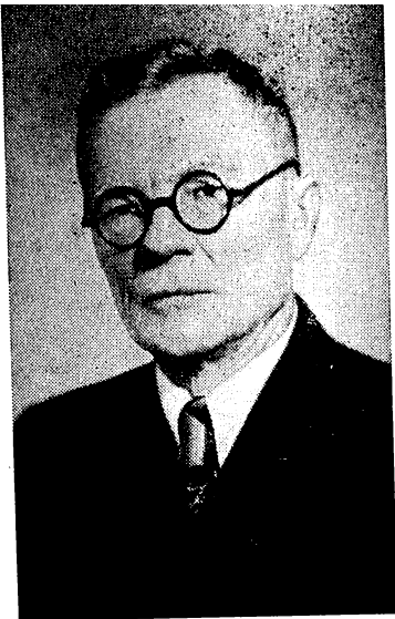
Иван Вонифатьевич Крылов.

Сперва я чувствовал себя скованно, но участники вечеринки были настолько общительны и приветливы, что скованность быстро прошла. Мои имя и фамилия через каких-нибудь полчаса превратились в простое русское «Ваня».