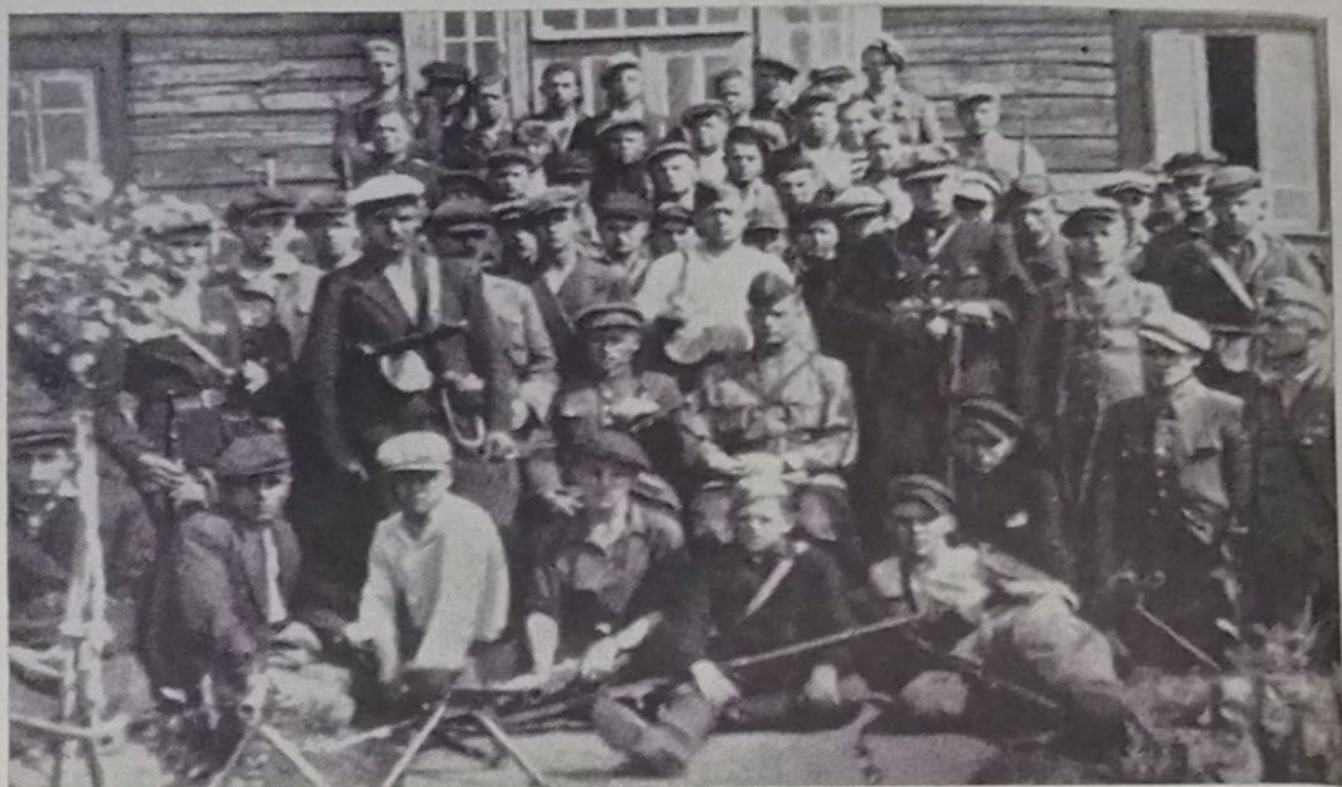
Партизаны отряда им. Пархоменко бригады им. ЦК КП(б)Б.