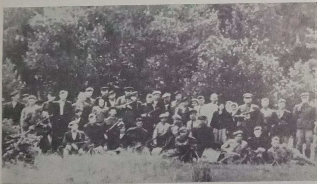
Группа партизан 2-го отряда им. Чкалова.