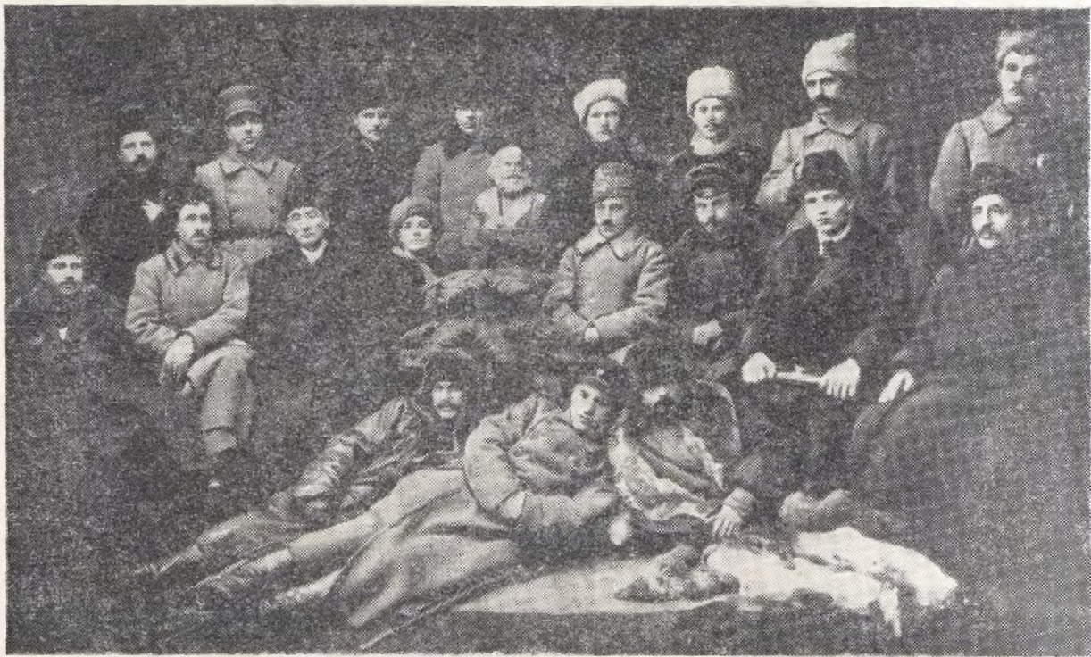
Члены Липецкого уисполкома. 1918 г.