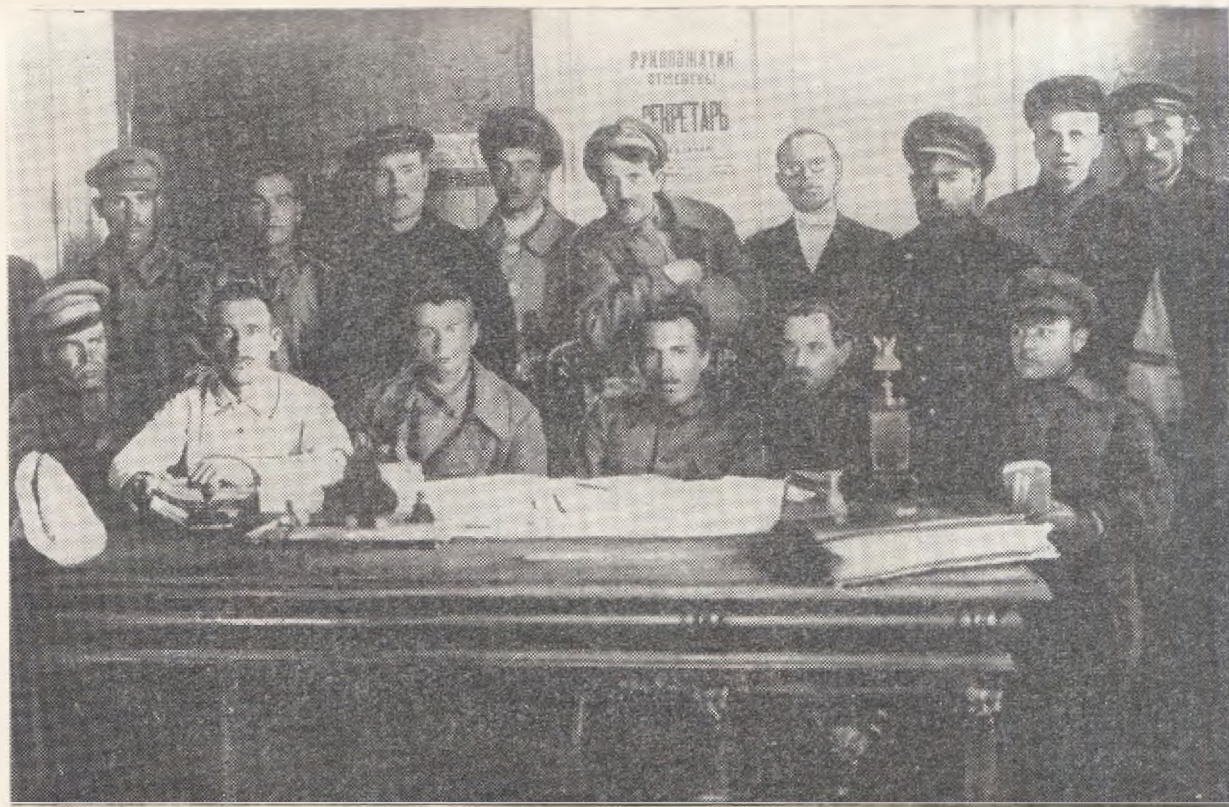
Члены Усманского укома партии. 1920 г.