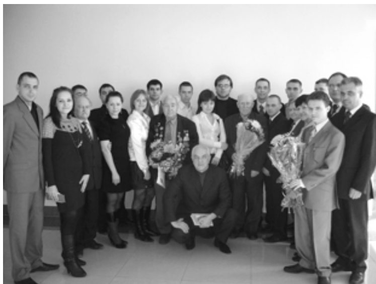
Поисковики и ветераны войны с ректором УГТУ профессором Н.Д. Цхадая, 2009 г.