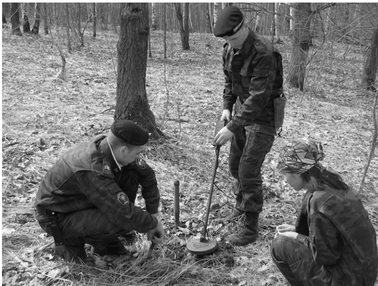
Поисковые будни. Великолукский район Псковской области.