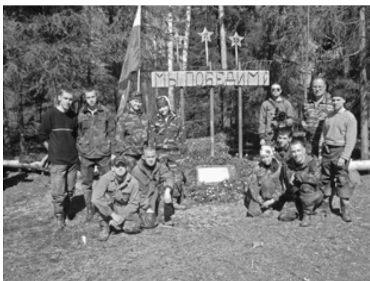
Поисковый отряд «Ухтинец» у памятника в Мясном бору, Новгородская область, 2009 г.