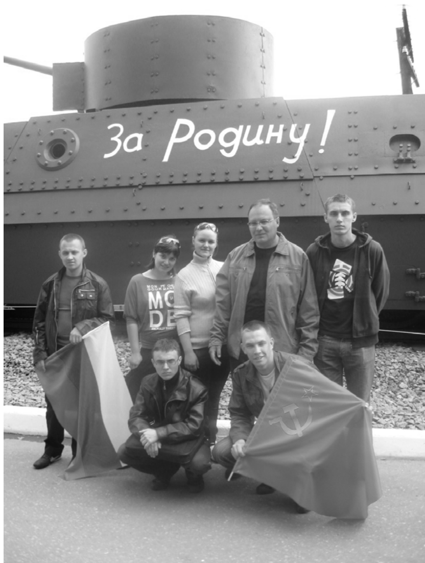
Бойцы поискового отряда, студенты УГТУ на Поклонной горе, Москва, 2009 г.