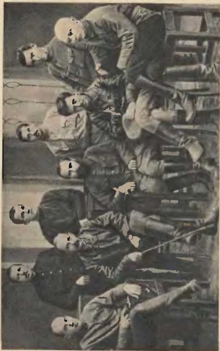
Военный совет 8-й армии

разбрасывала провокационные листовки, поддельные номера «Правды», где печатались лживые сообщения о наших поражениях и даже сфабрикованная речь В. И. Ленина о гибели Советской власти. Подработчики бригады не торопились изъять эти фальшивки, попавшие в руки красноармейцев. Они шути говорили бойцам, что Деникин знает о нехватке бумаги у нас и посылает ее, чтобы мы могли и самокрутку свернуть, да и для других неотложных нужд использовать бумагу.