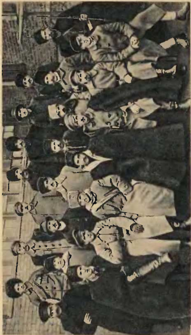
Г. К. Орджоникидзе с группой военных работников под Грозным

— На Дон, Кубань и Терек,— заметил он,— съезжается вся верхушка контрреволюции. Там предстоят горячие дела.