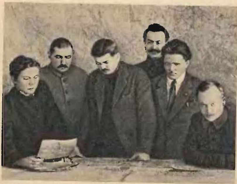
С. М. Киров среди начальствующего состава 11-й армии

паника и револьвер. Ходил Кочубей легко, словно на крыльях летал, весь — стремительное движение, весь — горячий порыв. Он люто ненавидел белых, всей душой был предан Советской власти. Его хорошо знали и понимали бойцы. И пользовался он среди них огромной любовью — не только как командир, но и как человек, знающий и понимающий нужды каждого.