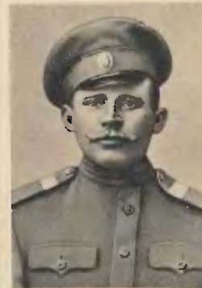
Ф. Ф. Лыткин