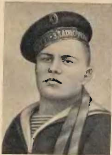
К. М. Рыльский