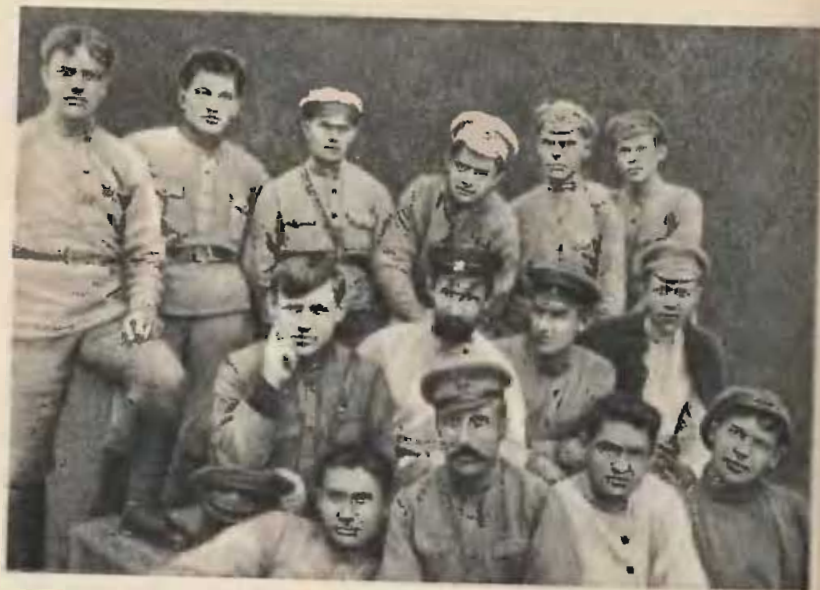
Командиры штаба 3-й бригады 12-й дивизии