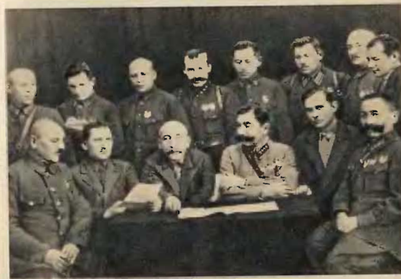
С. М. Буденный среди командиров 1-й Конной армии