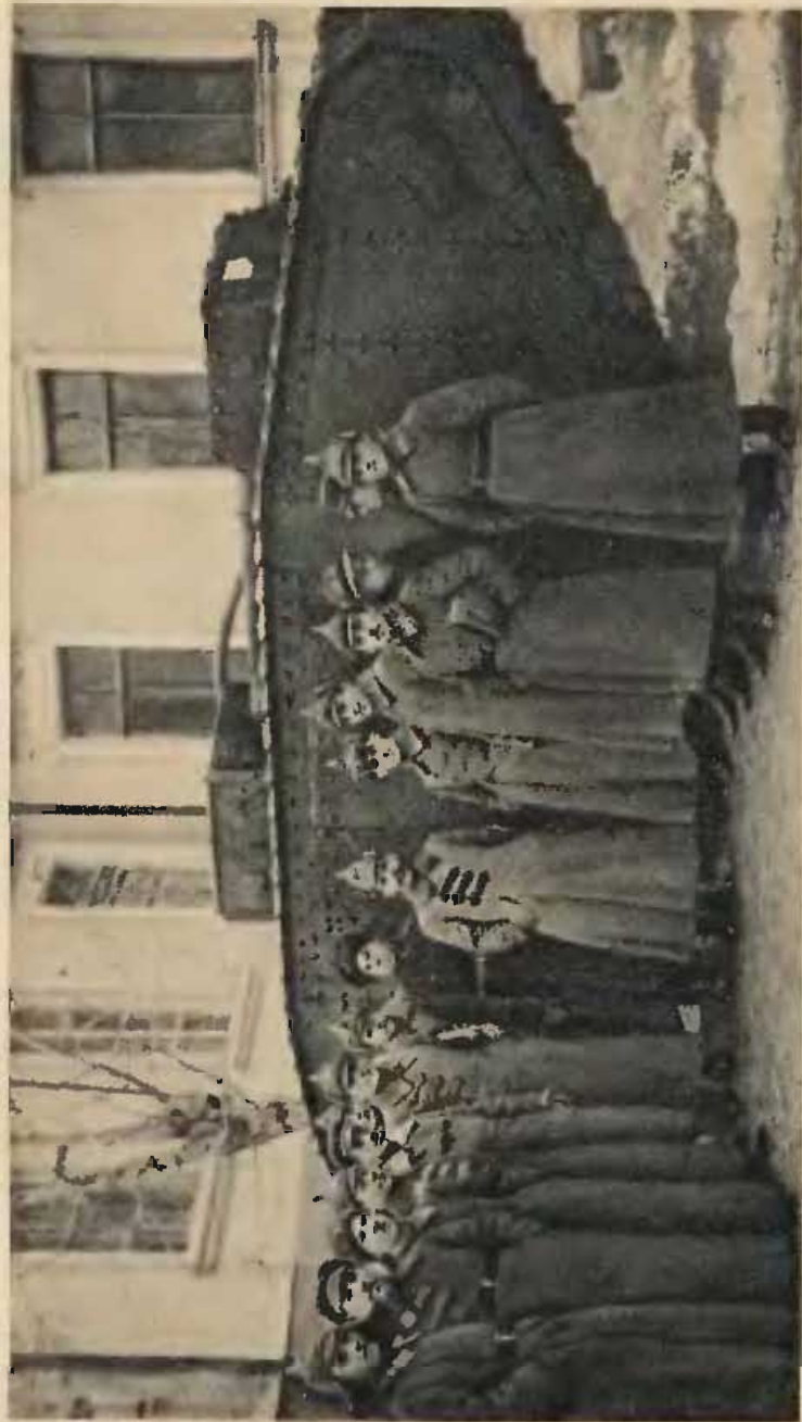
Н. В. Куйбышев (в центре) с бойцами и командирами у захваченного вражеского танка