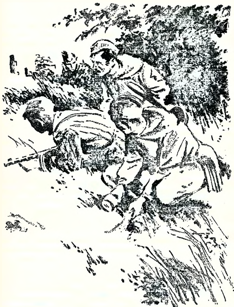
Вслед за Чуйковым из лесу выскочили Гуля, Сорокин и Пушкарь.