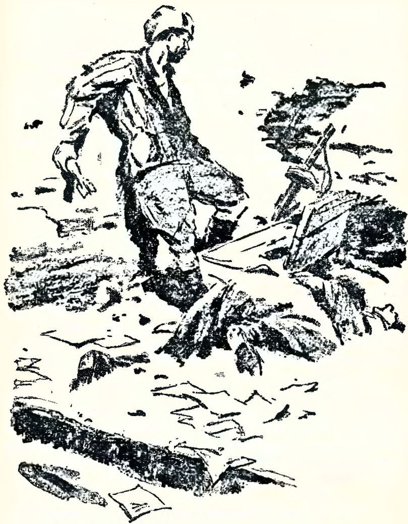
Ногой откинул крышку, схватил мину.