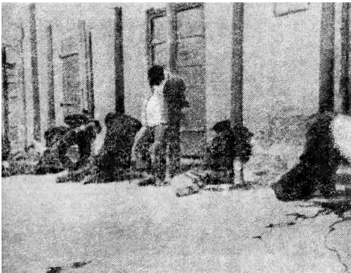
Советские патриоты, расстрелянные в Пскове (лето 1941 года)