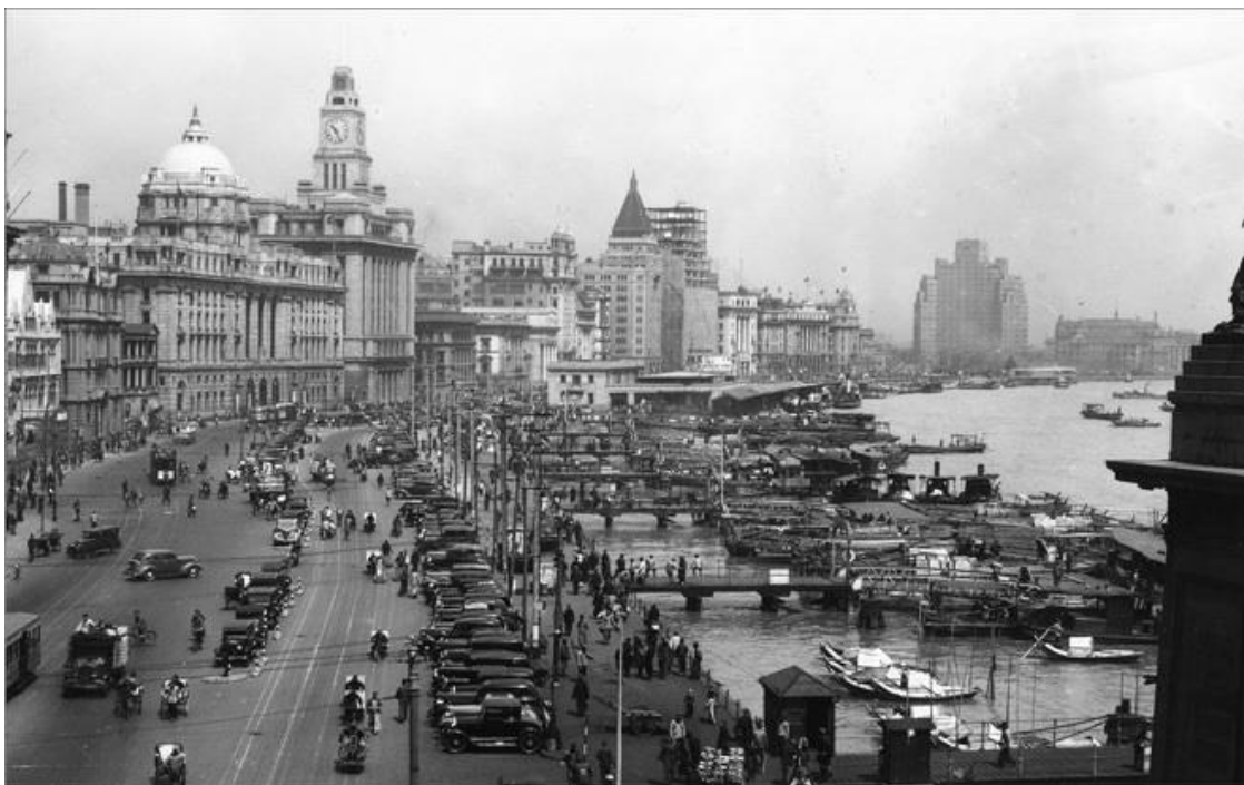
Шанхай. 1930-е гг.