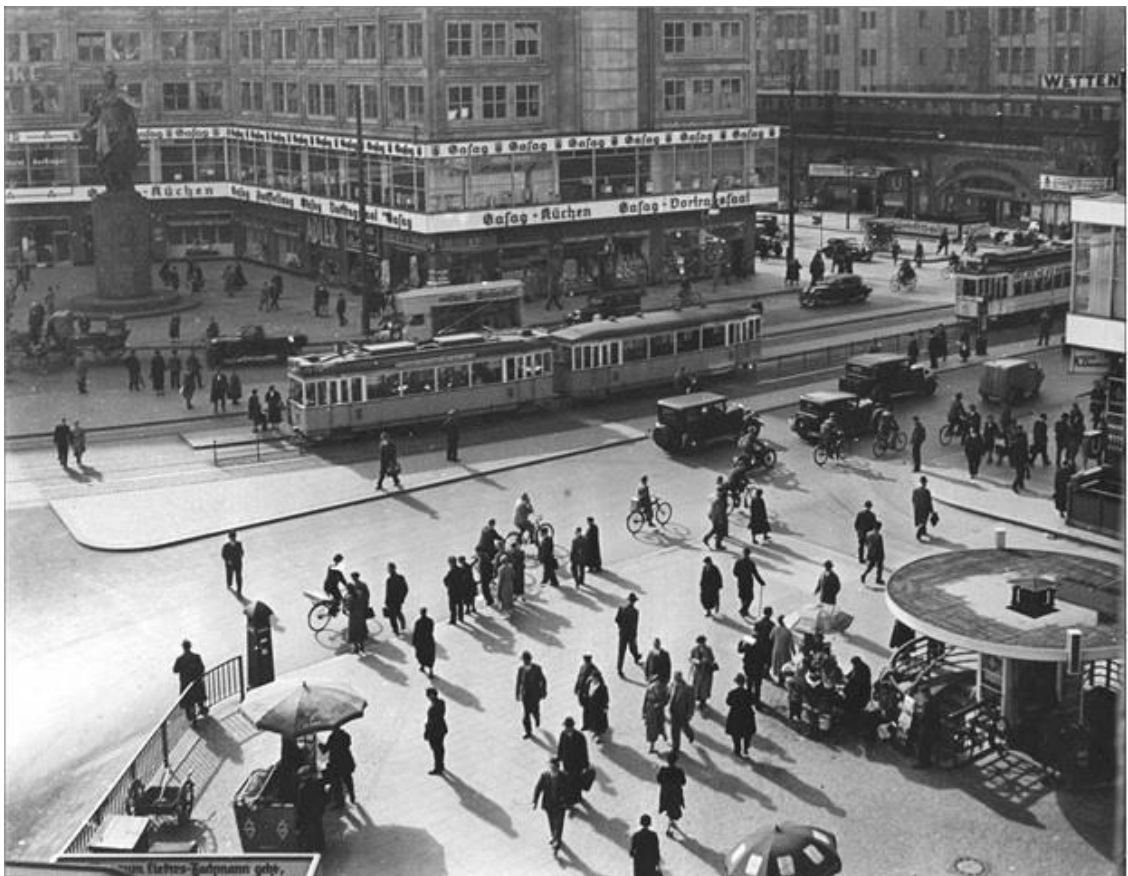
Берлин. 1930-е гг.