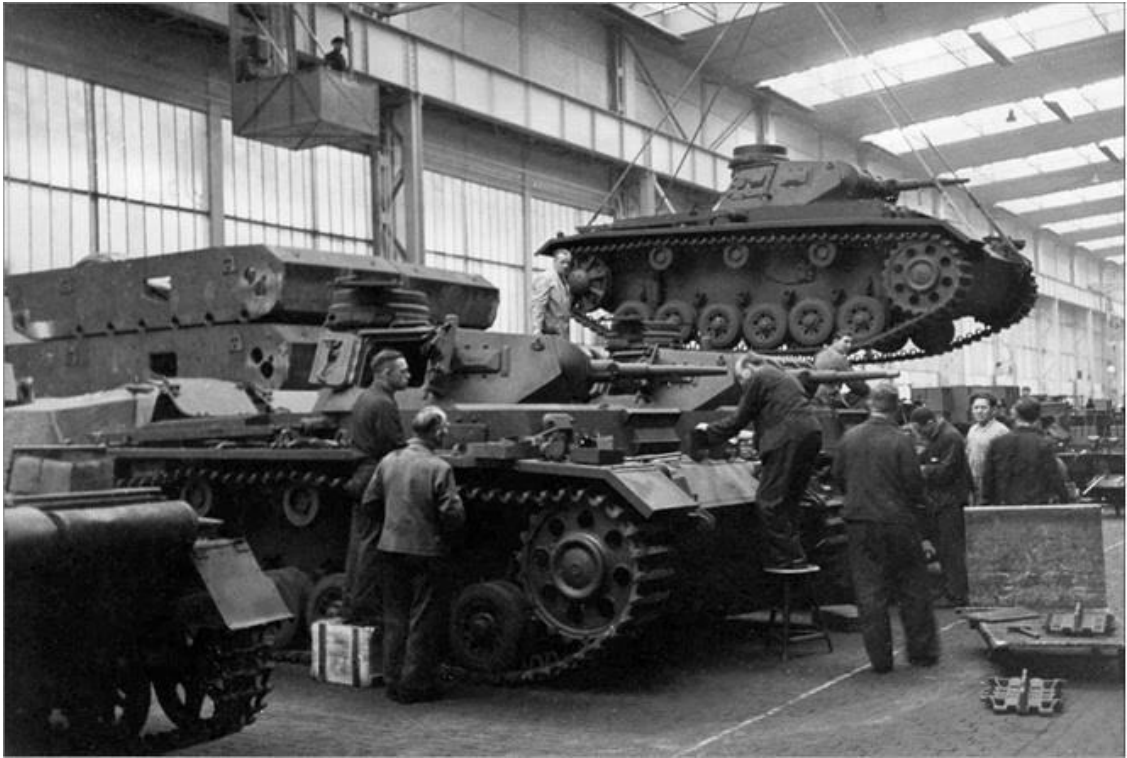
На одном из военных заводов Германии