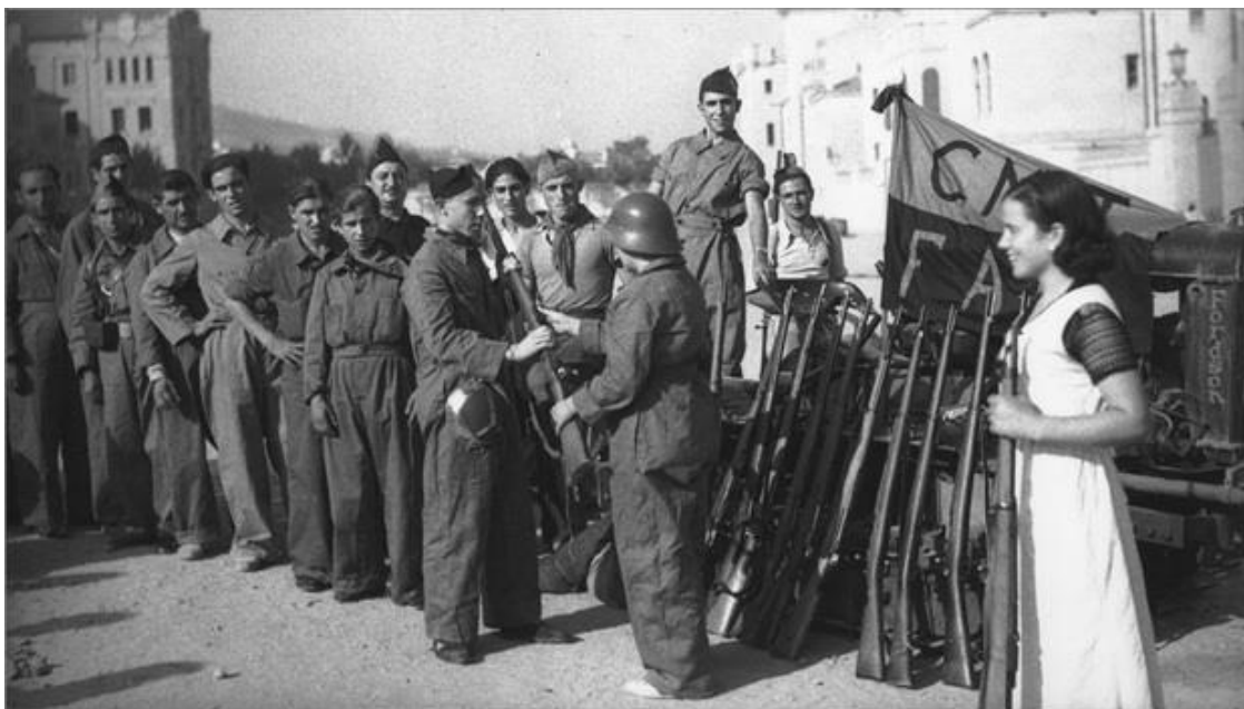
Республиканцы получают оружие. Испания. 1930-е г