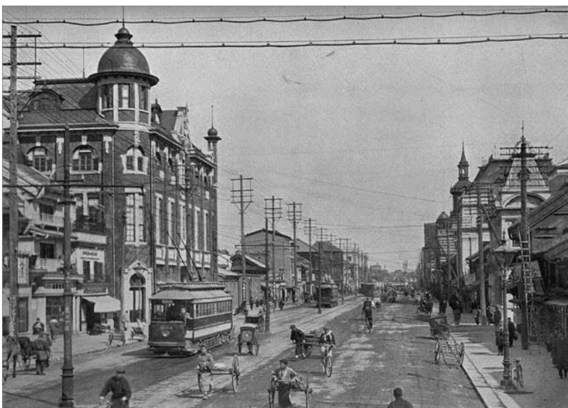
Открытка с видом Токио