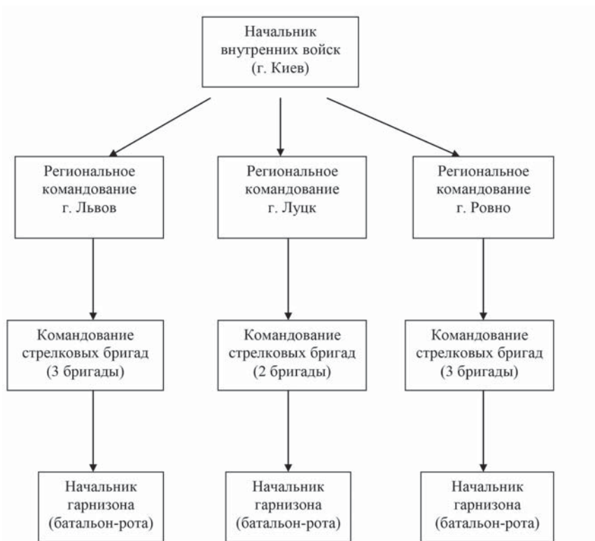
Схема организации внутренних войск МВД Украинского округа в 1944-1945 гг.