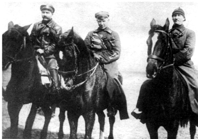
Начдив-33 М.Г. Ефремов (крайний справа). 1921 г.