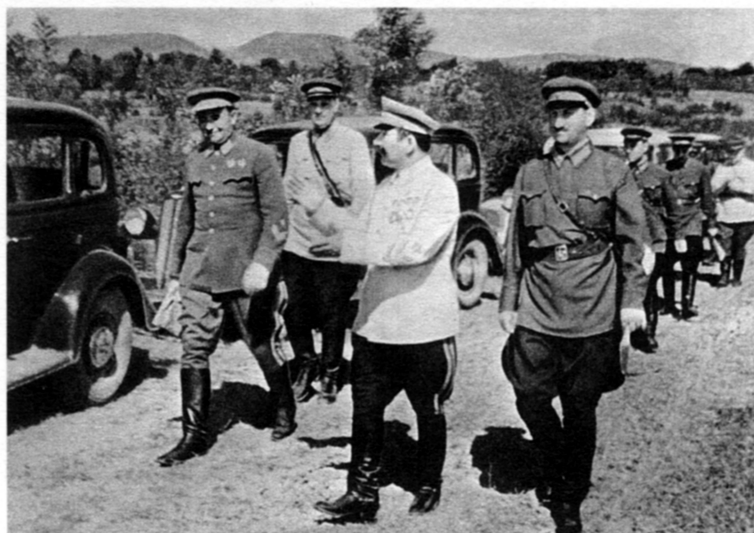
М.Г. Ефремов и С.М. Буденный (в центре ) на маневрах 1940 г. Закавказский военный округ