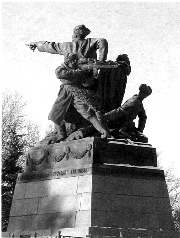
Вязьма. Памятник М.Г. Ефремову, установленный в 1946 г. по инициативе И.В. Сталина. Отлит из гильз, собранных на полях сражений под Вязьмой