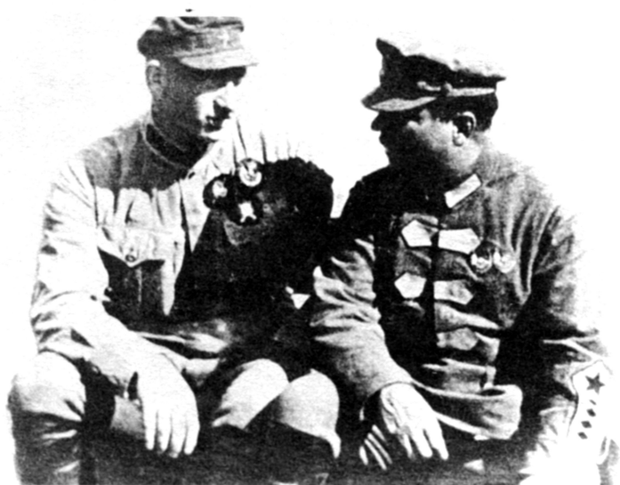
Два друга. Ефремов и Ворошилов. 1924 г.