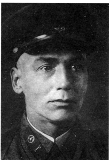
Капитан Д.Н. Митягин. Погиб во время прорыва