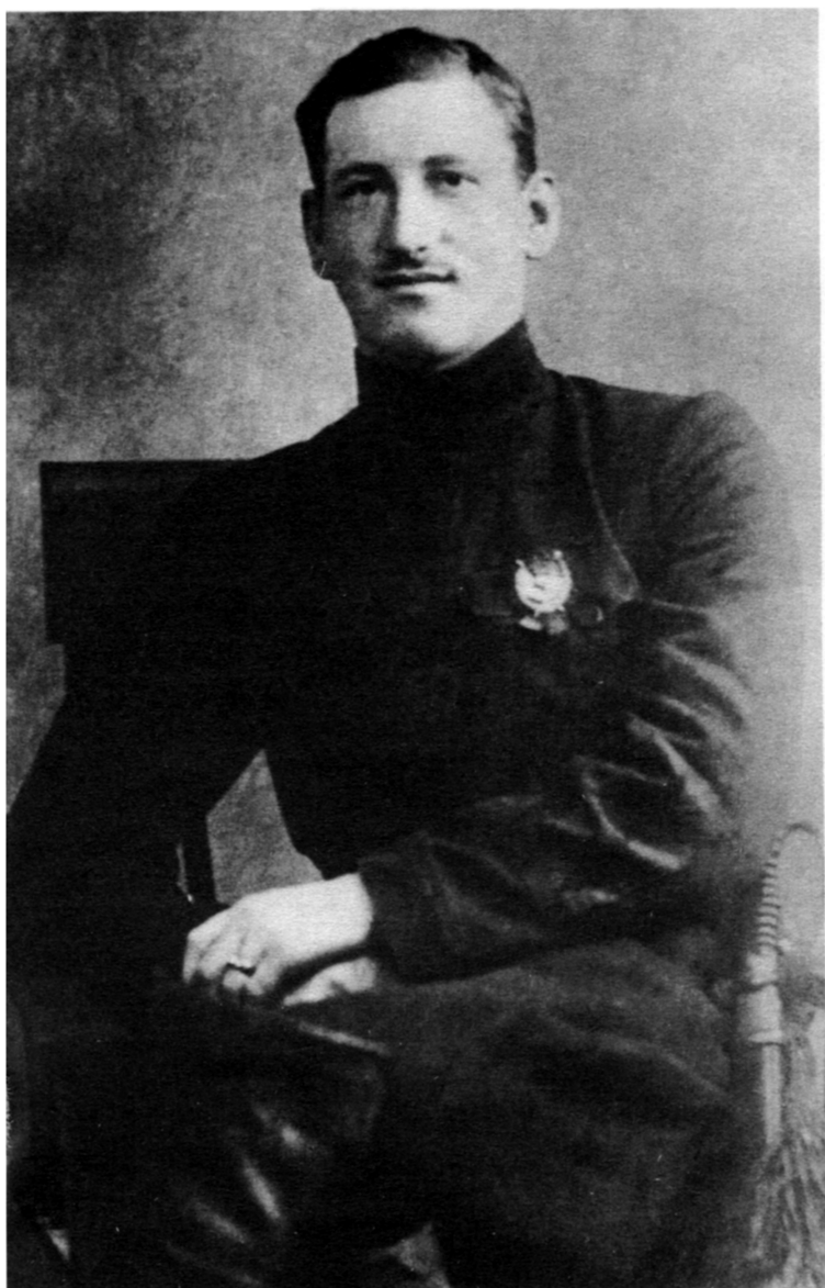
М.Г. Ефремов в годы Гражданской войны