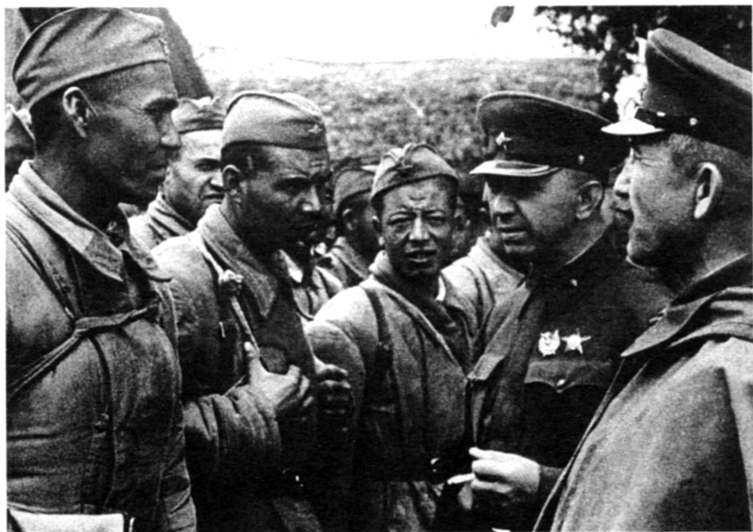
Командир 1-го гвардейского кавалерийского корпуса П.А. Белов ставит задачу разведчикам. Март—апрель 1942 г.