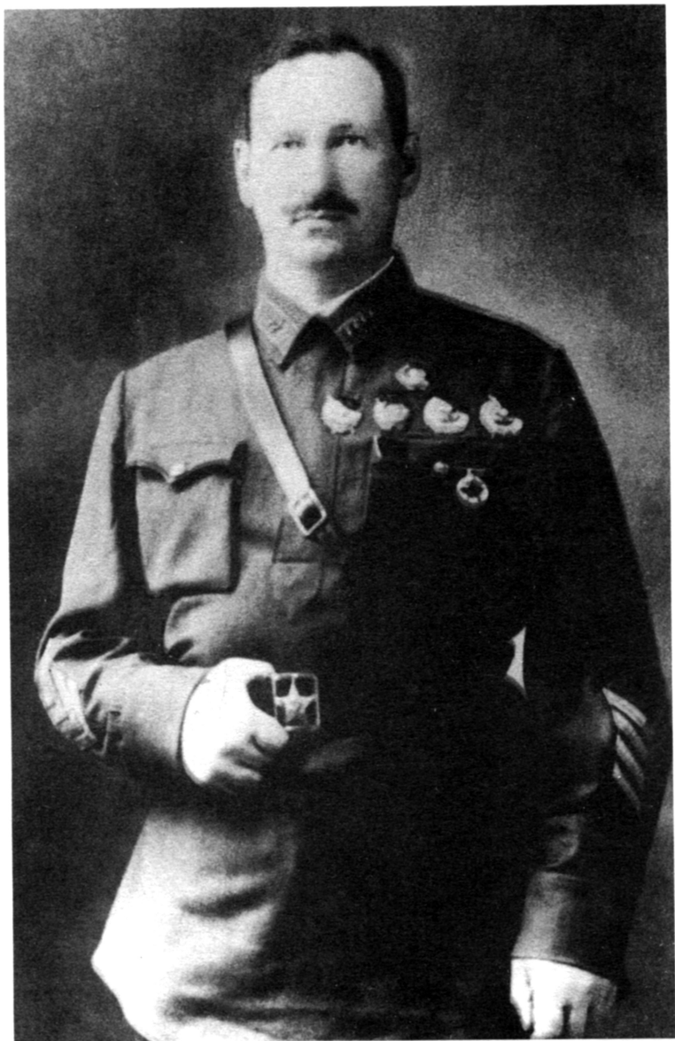
Командарм-33 Михаил Григорьевич Ефремов. 1939 г.