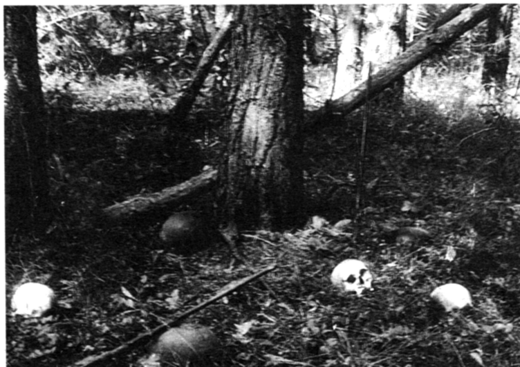
Шпыревский лес. Фотография сделана поисковиками в 1970-х гг.