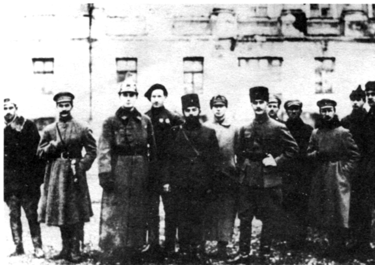
М.Г. Ефремов ( четвертый слева ) после установления советской власти в Баку. Конец апреля 1920 г.