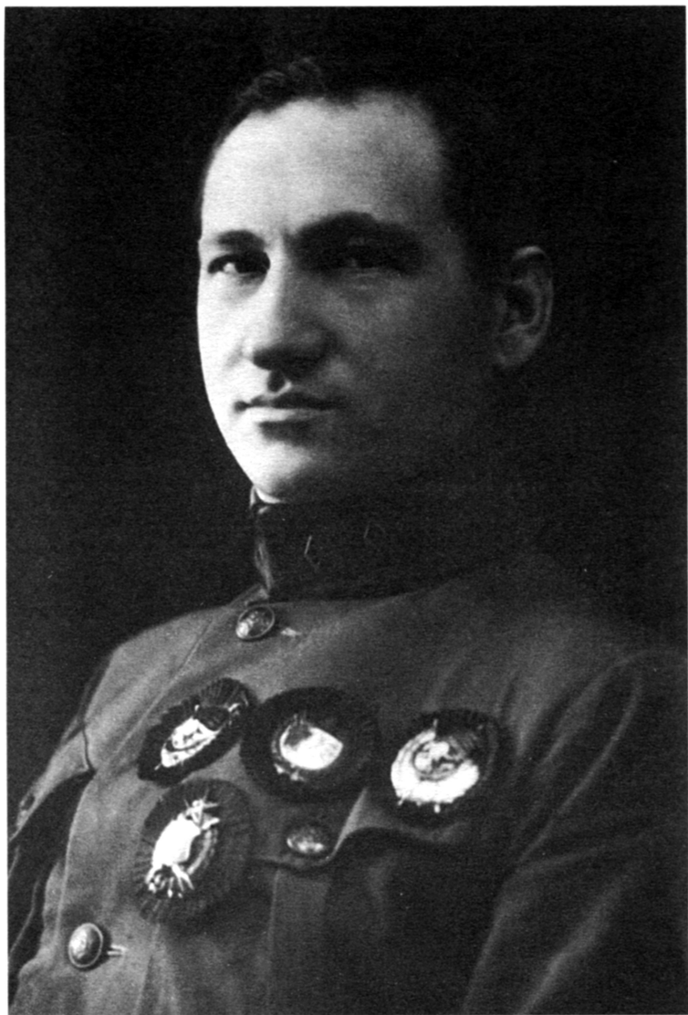
Военный советник в Китае. 1927 г.