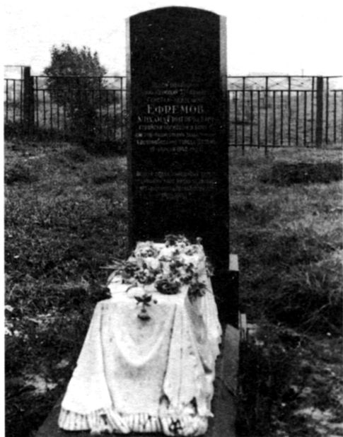
Могила М.Г. Ефремова после переноса на Екатерининское кладбище Вязьмы. 1952 г.