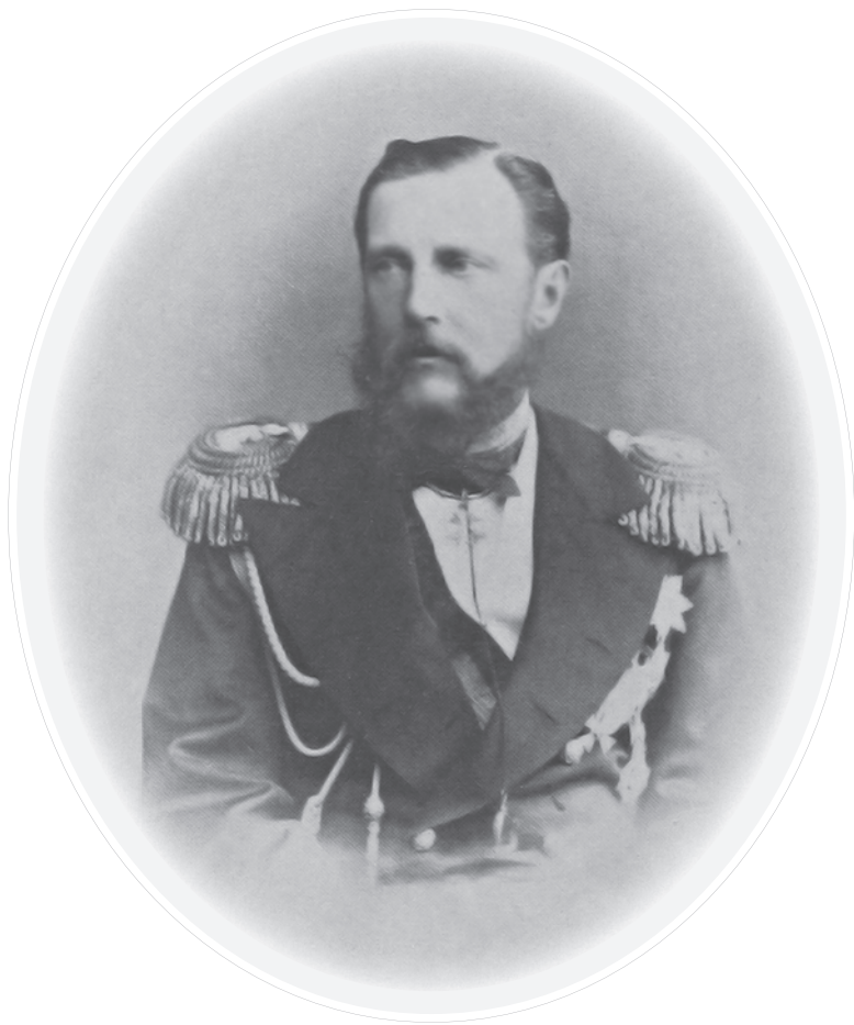
Великий князь Константин Николаевич