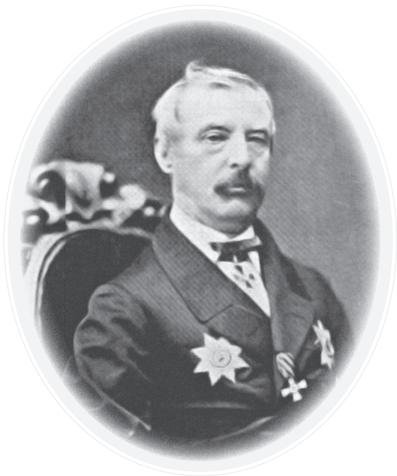
Ф. К. Затлер