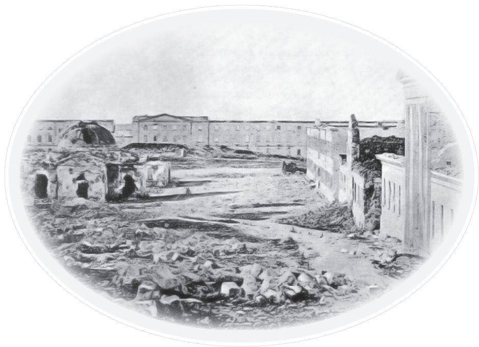
Развалины Морского госпиталя на Корабельной стороне Севастополя