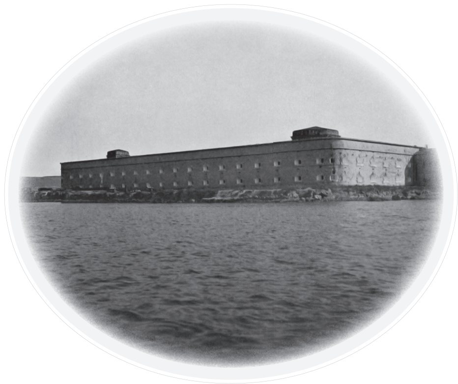
Михайловское укрепление на Северной стороне Севастополя, где помещалось госпитальное отделение для морских чинов