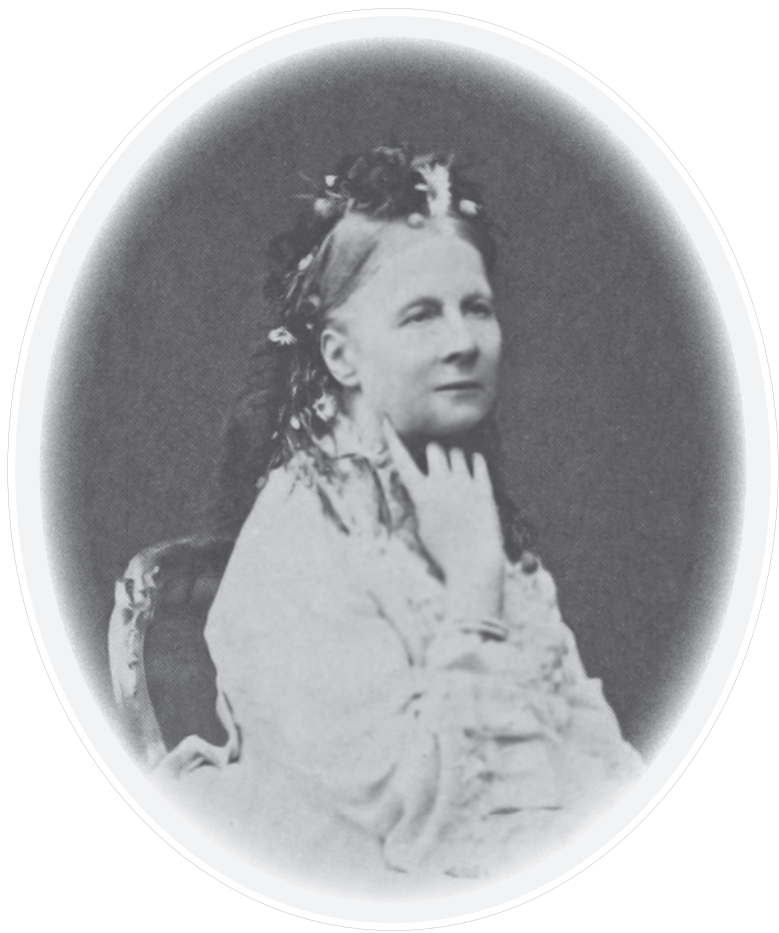
Великая княгиня Елена Павловна