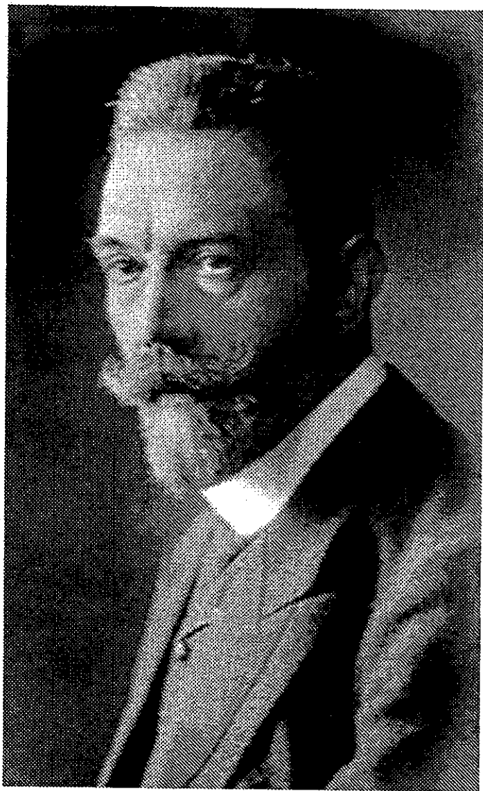
Рейхсканцлер Т. фон Бетман-Гольвег.