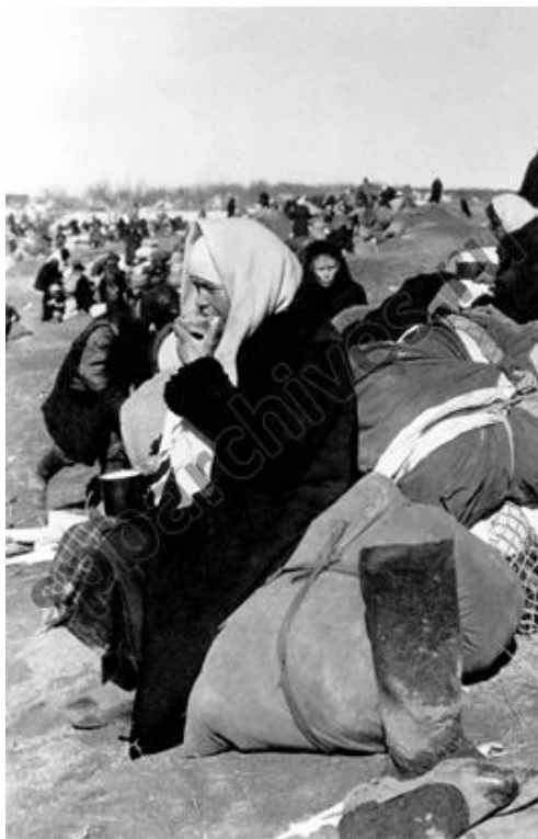
Эвакуированные жители Ленинграда в ожидании транспорта на станции Кобона. 12 апреля 1942 г.