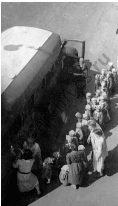
Эвакуация детей 38-го детского дома Куйбышевского района, посадка детей в автобусы. Июнь 1942 г.