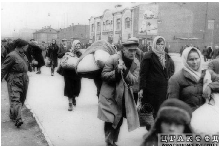
«Население уходит из Кировского района после начала артобстрелов 18 сентября 1941 года».