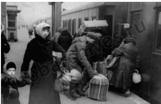
Посадка пассажиров на эвакопоезд. 1942 г.