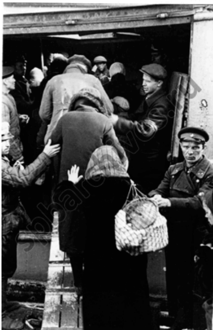
Посадка на пароход эвакуированных ленинградцев. 1942 г.