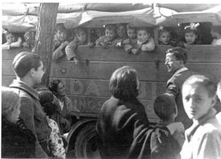
Эвакуация испанских детей из детдома. [Электронный ресурс]. // «ЖЖ» Джулия Корнелли. Режим доступа: http://juliyacoronelli.livejournal.com/1022728.html