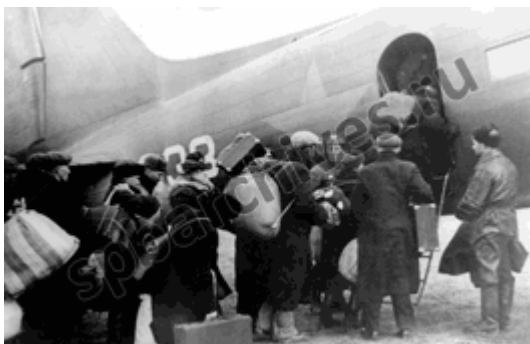
Посадка на скоростной самолёт гражданской авиации, ежедневно перевозящий пассажиров из Ленинграда. 10 октября 1941 г.