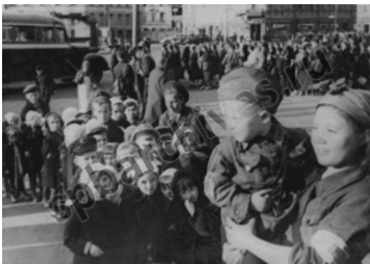
Эвакуация детей из Ленинграда в первые дни Великой Отечественной войны. 29 июня 1941г.

Архивным комитетом Санкт-Петербурга был инициирован проект по созданию единой информационной базы данных на жителей Ленинграда, эвакуированных из города в годы блокады Ленинграда, на основе документов, хранящихся в Центральном государственном архиве Санкт-Петербурга (ЦГА СПб) и части ведомственных архивов Санкт-Петербурга.