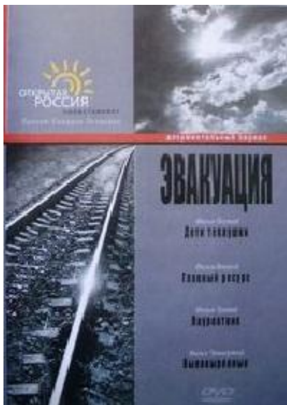
«Заставка фильма». – Эвакуация [Видеозапись] Документальный / реж. Самарий Зеликин. – М.: Фонд АРТ-ПРОЕКТ, Открытая Россия, 2005.