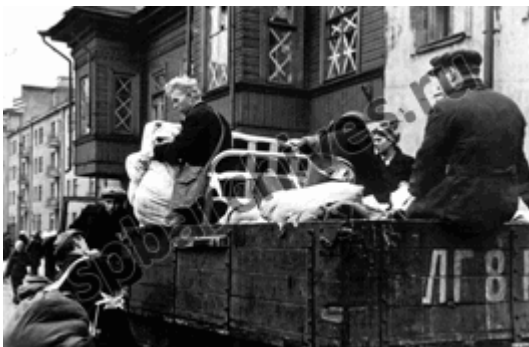
Эвакуация Кировского района. 18 сентября 1941г.