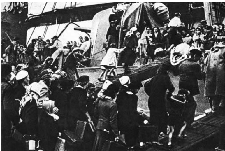
Эвакуация населения Севастополя. 1942 г.