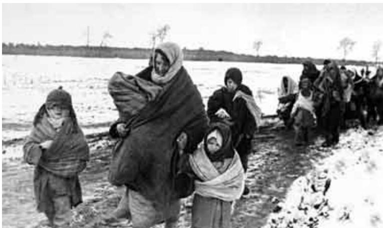
Так проходила эвакуация из Чажешно. Реконструкция по документальным фотографиям времен войны [Электронный ресурс] //

Режим доступа: http://maltus1.narod.ru/war4.htm