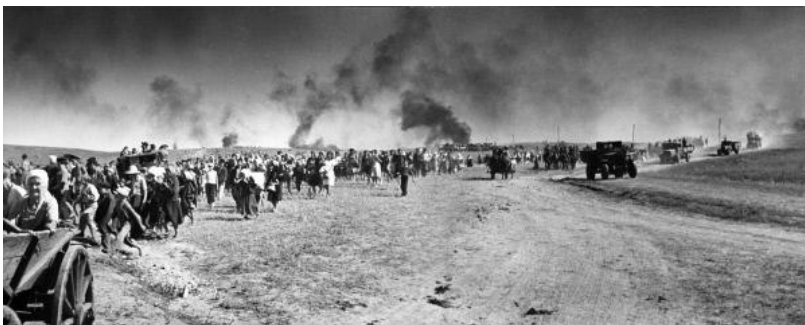
Население уходит в эвакуацию с отступающими советскими войсками по Украине. [Электронный ресурс]//

Режим доступа: http://maltus1.narod.ru/war4.htm