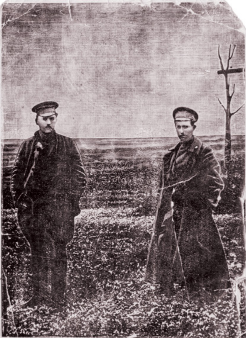
Красные казаки, товарищи Подтелков и Кривошлыков, у виселицы перед казнью.

Красные казаки Ф.Г. Подтелков и М.В. Кривошлыков были казнены белоказаками 11 мая 1918 г.