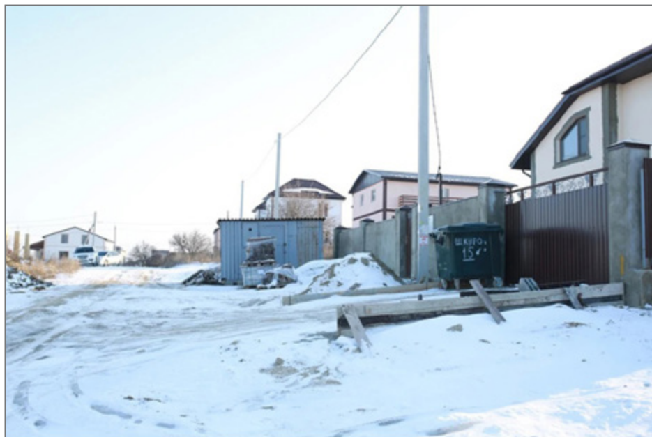
Улица имени А. Шкуро в Новороссийске.