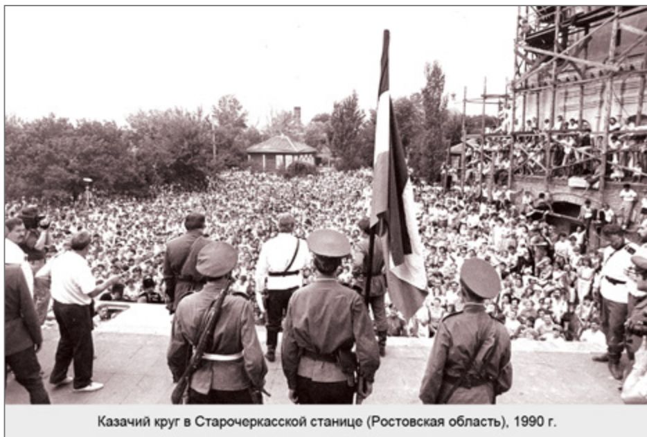
Казачий круг в Старочеркасской станице (Ростовская область), 1990 г.

В основе современного казачьего национализма лежит та же самая историческая концепция Е. Савельева, развитая в первую очередь стараниями эмигрантов в рамках польско-французского проекта «Прометей». На ее основе появился исторический миф, формирующий национальную основу для казаков, построенный на представлении о казаках как о древнем народе, имевшем независимое государство и жившем по своим традициям. В длительной борьбе с врагами, прежде всего, с Русским государством, «казачий народ» потерпел поражение и был превращен в служилое сословие. Нисколько не смущаясь антиисторичностью этой концепции, казачьи националисты игнорируют все исторические и архивные документы, подтвержда-