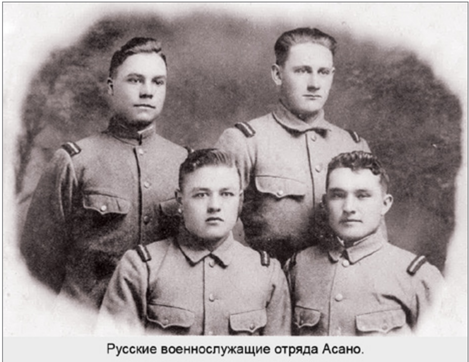
Русские военнослужащие отряда Асано.

Красной армии. Этим японцы избегают объявления войны СССР» 60 . Публикации Семенова в эмигрантской печати в полной мере характеризуют его как фашиста. Он шлет поздравления Гитлеру с днями рождения, ликует по поводу победы Германии над европейскими странами, желает успехов на Восточном фронте. Провал блицкрига под Москвой и поражение вермахта под Сталинградом стали для него личными трагедиями.