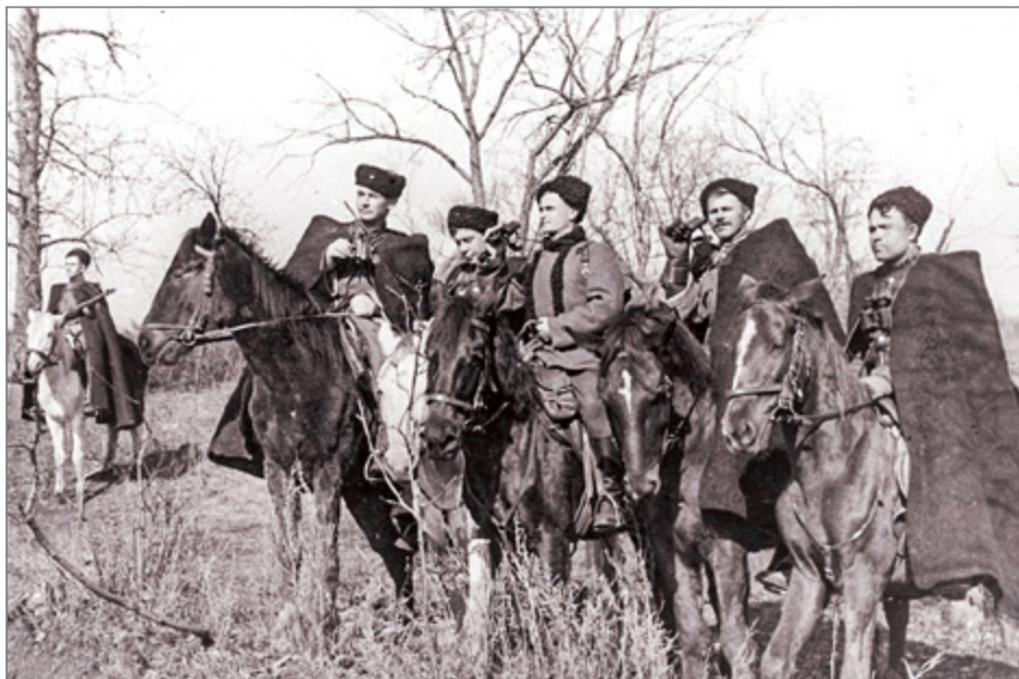
Командиры казачьего гвардейского полка Красной армии изучают местность перед выполнением боевой задачи.

татар, взяв в плен 23 человека, и по моему приказу расстреляли их на месте. Кроме того, было захвачено в плен 45-50 партизан, тоже потом расстрелянных. В итоге этой операции было убито около 600 партизан. Между 10 и 21 марта 1943 г. двумя батальонами полка была предпринята карательная акция против партизан в лесу северо-восточнее Полоцка. Захвачено в плен и расстреляно 7 партизан» 85 .