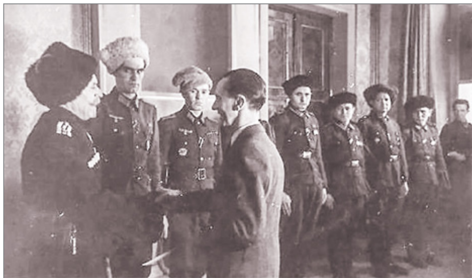
Й. Геббельс вручает награды рейха И. Кононову и донским казакам, воевавшим на стороне Гитлера.

дованием И. Броз Тито. После оккупации Югославии в 1941 г., стоявший во главе русской эмиграции в Сербии генерал М.Ф. Скородумов 71 обратился в штаб германского главнокомандующего с предложением сформировать русскую воинскую часть. 12 сентября он получил письменный приказ о формировании Отдельного русского корпуса из русских офицеров, солдат и казаков, служивших в белогвардейских воинских частях. Многие из этих людей читали «Майн кампф» и отлично знали истинные цели и намерения нацистов в отношении своей родины, но видели в коммунистах гораздо более опасных врагов. Общекубанский чрезвычайный сбор в Белграде принял решение о поступлении кубанских казаков на службу в это воинское соединение. В первые дни формирования Скородумов был смещен и арестован, корпус возглавил генерал Б.А. Штейфон, бывший полковник Генштаба Русской армии, участник Гражданской войны на стороне «белых». Корпус был переименован в «Русскую охранную группу» и подчинен германскому хозяйственному управлению в Сербии. Сразу же по окончании формирования, а иногда не успев пройти военного обучения, части отправлялись в карательные операции против югославских партизан. Действия группы получили превосходные оценки германского командования, в