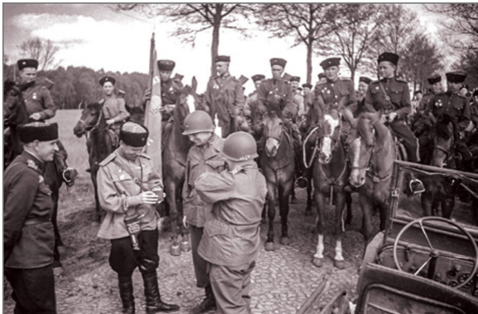
Казачи 3-го гвардейского кавалерийского корпуса на встрече с американскими офицерами в Германии. Снимок сделан во время встречи с союзниками на Эльбе, апрель 1945 г.

Часть казаков, воевавших на стороне фашистов, смогла избежать выдачи в СССР. Они перебрались в зоны оккупации союзников, а потом в Южную Америку и США, как и многие другие сторонники фашизма. Во время «холодной войны» многие из них стали пропагандистами на антисоветских радиостанциях, начали издавать новые антисоветские газеты и журналы, вести активную общественную деятельность, продолжив бороться с Россией новыми методами, разработанными в центрах информационно-психологических операций США и НАТО.