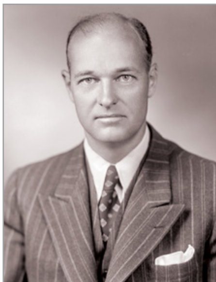
Дж. Ф. Кеннан

Американский дипломат Дж. Кеннан 117 в это время разработал концепцию «политической войны», составной частью которой является организация «комитетов освобождения», возглавляемых политическими беженцами, которым в первую очередь необходимо обеспечить доступ к источникам распространения информации. В 1947 г. «Управление координации политики» начало подбирать политических активистов, которые должны были начать пропагандистскую деятельность против Советского Союза. Были созданы первые обще-