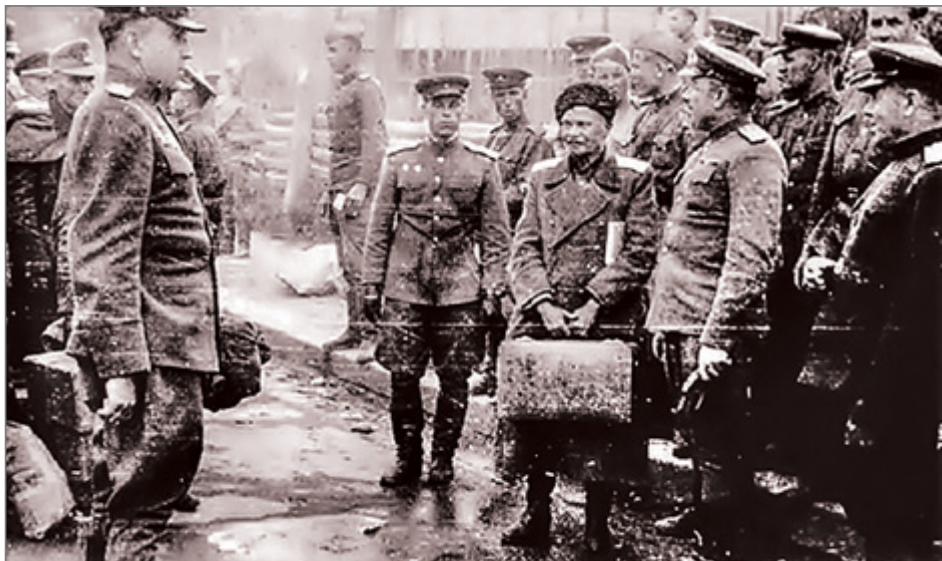
Передача союзниками представителям РККА группенфюрера СС А. Шкуро.

наказания. С рядовыми казаками поступили так же, как с другими приспешниками оккупантов. После рассмотрения дела каждый получал приговор соразмерно со степенью своей вины. В 1955 г. по указу Президиума Верховного Совета СССР «Об амнистии советских граждан, сотрудничавших с оккупационными властями в период Великой Отечественной войны», казаки были амнистированы.