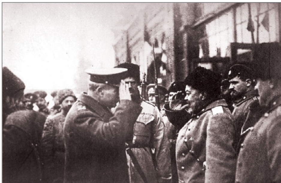
Главнокомандующий Вооружёнными силами Юга России А.И. Деникин и английский генерал Ф. Пуль

Взаимодействие интервентов с белогвардейцами включало в себя не только военную и материальную помощь, но и прямое управление их действиями, в частности установление единоначалия. Под давлением Франции и Великобритании Краснов был вынужден под-