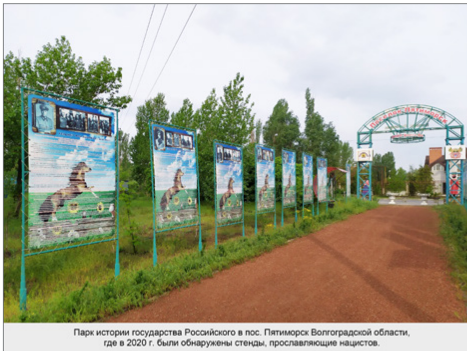
Парк истории государства Российского в пос. Пятиморск Волгоградской области, где в 2020 г. были обнаружены стенды, прославляющие нацистов.

кануне 9 мая 2020 г. обнаружил у центрального входа в это учреждение культуры стенды с фотографиями сотрудничавших с нацистами Краснова, Шкуро, Доманова, фон Паннвица 227 . В парке также были установлены десятки стендов, рассказывающие не о лидерах стран Антигитлеровской коалиции, а... о руководителях и военачальниках стран фашистского блока, включая Гитлера и Муссолини. Как в предыдущих примерах «примирения», фашистский дуче и нацистский фюрер были представлены вперемежку со стендами о героях Великой Отечественной войны. Было написано заявление в поселковую администрацию и прокуратуру, после чего стенды были демонтированы.