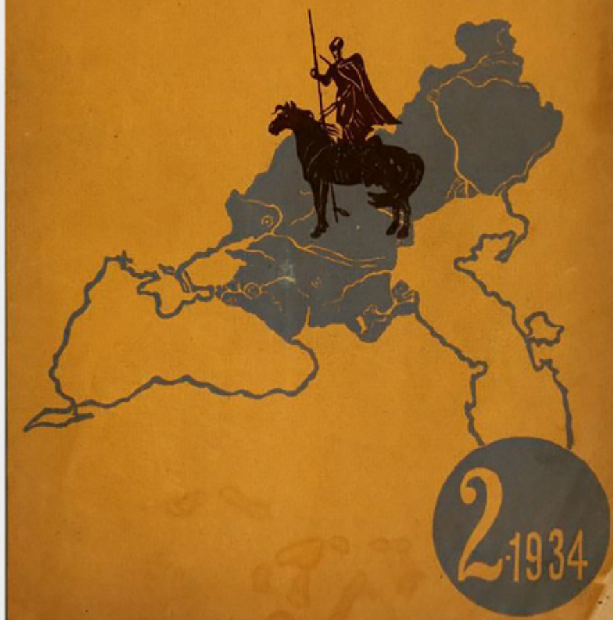
Обложка журнала «Казакія»