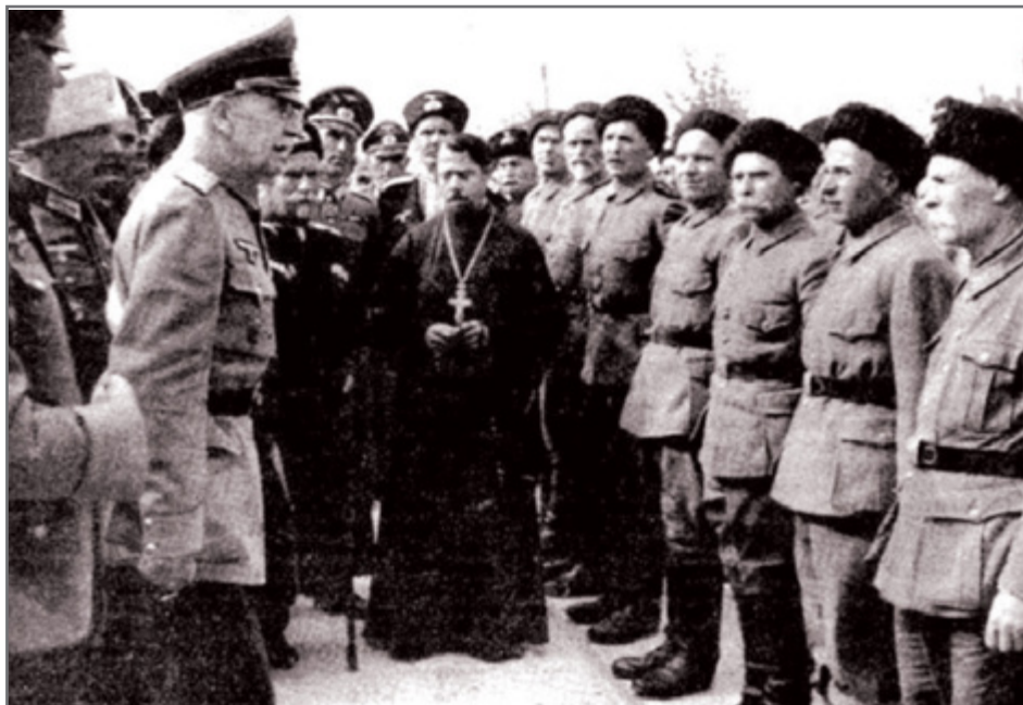
Визит бригаденфюрера СС П.Н. Краснова к ветеранам гражданской войны, сентябрь 1943 г.

серьезных поражений, но и найти ресурсы для войны на два фронта. Казачьи части очень пригодились в этой критической ситуации. Было принято решение о развертывании казачьей дивизии фон Паннвица в кавалерийский корпус, который был зачислен в войска СС. Для этой цели при Главном штабе СС создавался специальный орган – Резерв казачьих войск, начальником которого приказом рейхсфюрера СС Г. Гимmlера был назначен группенфюрер А. Шкуро. «Казачий резерв» на правах штаба национального легиона СС отвечал за вербовку и подготовку казаков для службы в войсках СС, в частях СД и полиции. Казачьи подразделения вместе с частями СС подавляли Варшавское восстание и воевали с англо-американскими войсками во Франции. 5-й запасной полк ГУКВ участвовал в антипартизанских действиях в районах городов Дижон и Лангр, 360-й крепостной полк оборонял Ла-Рошель, 454-й крепостной полк вел боевые действия в составе вермахта в Эльзасе, где был разгромлен американскими войсками.