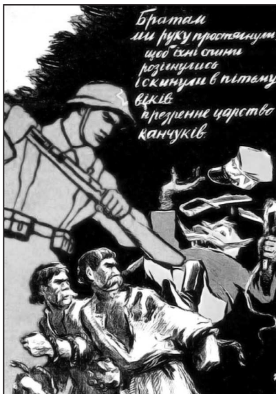
Рис. 3. «Царство канчуков»

из рук. Тем не менее, никакого сочувствия к поверженной армии, защищавшей, кстати, свое государство, у зрителя не может и не должно быть, ведь с выбитой из рук сабли капает свежая кровь, а в рукоять плети (канчука) пальцы офицера вцепились намертво.