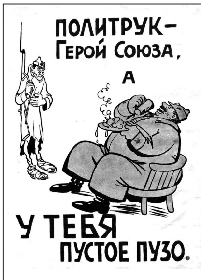
Рис. 17. Финская агитационная листовка

В целом, советскую пропагандистскую кампанию осени 1939 г. можно признать успешной. Ее положительно восприняла армия, гражданское население СССР и население Западной Украины и Западной Белоруссии.