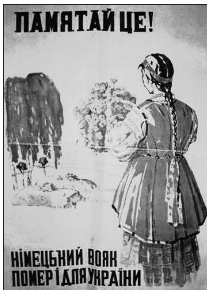
Рис. 14. Помните! Немецкий солдат погиб и за Украину»

«великой Германии». В национал-социалистских плакатах и листовках отчетливо звучал мотив долга перед «избавителями»: «Работая в Германии, ты защищаешь свое отечество! Иди в Германию!», «Украинцы! Включайтесь в европейский фронт обороны против большевизма!» и т.д.