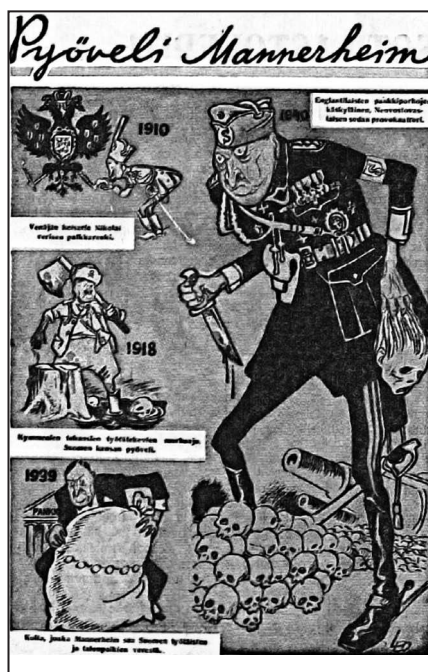
Рис. 16. Мясник Маннергейм»

В условиях тяжелой ситуации, сложившейся на финском фронте в начале 1940 г., пришлось перестраивать пропагандистскую работу в самой РККА, об «освободительной миссии» которой говорить уже не приходилось. Высокий боевой дух финской армии не шел ни в какое сравнение с боевым духом отступающего почти без сопротивления в сентябре 1939 г. Войска Польского. Руководство Политического управления Красной армии было вынуждено перестраиваться «на ходу». 4 февраля 1940 г. в действующую армию была направлена директива ПУРККА за № 29 «О задачах агитационно-пропагандистской работы в связи с финляндской войной». В директиве утверждалось следующее: вместо повседневного разъяснения личному составу, что основной задачей в этой