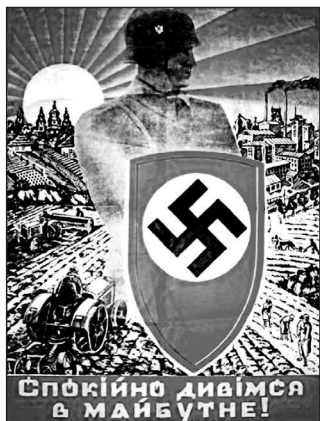
Рис. 15. «Спокойно смотрим в будущее»

«великой Германии». В национал-социалистских плакатах и листовках отчетливо звучал мотив долга перед «избавителями»: «Работая в Германии, ты защищаешь свое отечество! Иди в Германию!», «Украинцы! Включайтесь в европейский фронт обороны против большевизма!» и т.д.