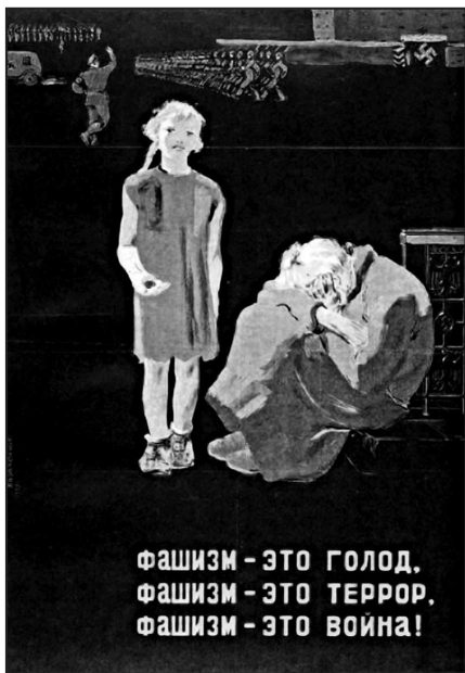
Рис. 8. П. Я. Караченцев «Фашизм – это голод. Фашизм – это террор. Фашизм – это война!»

Характерно, что в советском плакате осени 1939 г. практически не отражена тема германской агрессии против Польши 1 , которая, согласно «Краткому курсу истории ВКП(б)», должна была бы квалифицироваться как война несправедливая, захватническая, имеющая целью захват и порабощение чужих стран, чужих народов. Антифашистские мотивы появляются в советской внешнеполитической пропаганде с середины 1930-х годов,