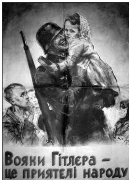
Рис. 13. «Солдаты Гитлера – друзья народа»