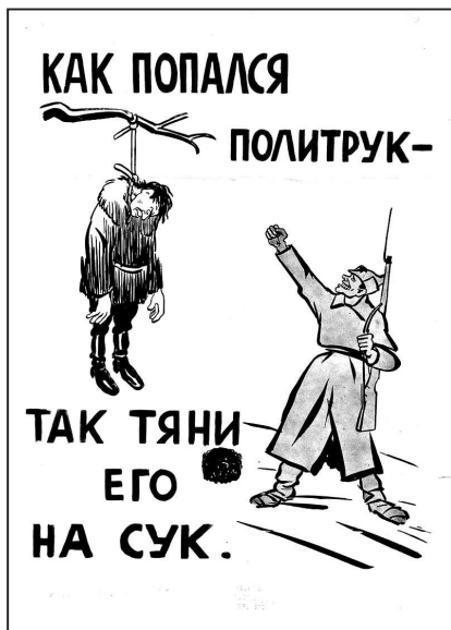
Рис. 18. Финская агитационная листовка