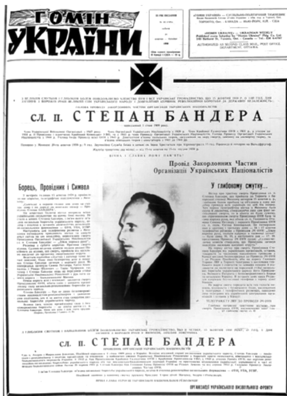
Fig. 2: The front page of Ukrainian Echo 24.10.1959.

Заголовок и заключение содержали поразительную надпись: «С Любящей Памятью к Степану Бандере». Между фотографией и надписями, редакторы сообщили читателям, что траур продлится два месяца, с 15 октября по 15 декабря. Введения к двум статьям были напечатаны на другой стороне фотографии, которая была продлена на шестой странице. Одна из статей была озаглавлена «Борец, Лидер и Символ», а другая была названа «В глубокой печали ...».