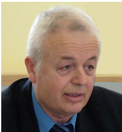
Трендафил Митев , профессор факультета международной политики Национального университета мировой экономики (Болгария).