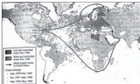
Маршруты движения фашистских подлодок ("Nation of Nations", p. 771)

назвали "идеологическим основанием союзнической борьбы против Третьего рейха", провозглашал свободу морей и торговли, осуждал территориальные завоевания, поддерживал право наций на самоопределение и, таким образом, закладывал основу для конфликта со Сталиным 11 .