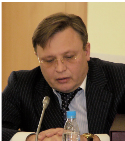
И. И. Сирош , заместитель председателя Комиссии при Президенте Российской Федерации по противодействию попыткам фальсификации истории в ущерб интересам России.