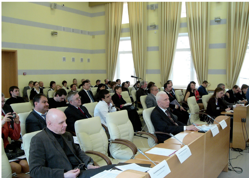
9 апреля 2010 г., РИСИ.