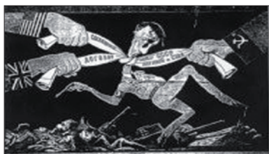
"Восточный фронт" ("The American Promise", p. 645)

Описывая поражение Третьего рейха, американские учебники уделяют особое внимание англо-американской военно-воздушной кампании против военных, промышленных и городских целей, союзнической высадке в Нормандии ("крупнейшее морское нападение в мировой истории") и вторжению в Германию в начале 1945 г. Тот факт, что в июне 1944 г. советские войска выбили фашистов за пределы России, упоминается вскользь 22 .