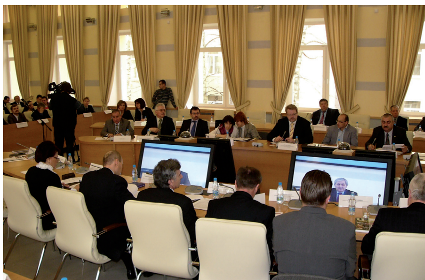
8 апреля 2010 г., РИСИ.