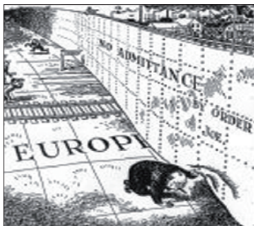
"Железный занавес" ("We The People: A History of the United States", p. 866)

разногласия 27 . Война вывела Соединённые Штаты из мировой депрессии (которой СССР удалось избежать), а Советскому Союзу принесла экономическое разорение и колоссальные жертвы. В учебниках подчёркивается тот факт, что видение послевоенного мира каждой из наших стран отражало следующее противоречие: США хотели построить "открытый мир", основанный на свободном перетоке товаров и идей, а СССР стре-