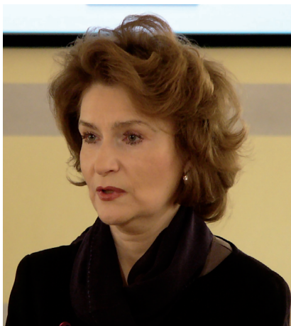
Н. А. Нарочницкая , президент Фонда исторической перспективы.