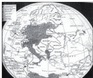
Европейский театр военных действий ("The American Promise", p. 637)

Несмотря на то, что во всех американских учебниках истории говорится об убийстве нацистами шести миллионов евреев и представлены фотографии американских солдат в лагерях Дахау и Бухенвальд, только в одном упоминается об освобождении Аушвица советскими солдатами 26 . Не менее важно то, что ни в одном из учебников нет информации о зверствах нацистов против евреев и партизан на Восточном фронте Второй мировой войны.