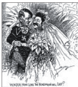
"Свадьба" ("The American Century", p. 499)

Обычно в критическом ключе говорится о пакте о ненападении, подписанном Сталиным и Гитлером, который "дал возможность Третьему рейху напасть на Польшу" 8 . Пакт Молотова – Риббентропа от 23 августа 1939 г. характеризуется как акт, избавивший Гитлера от войны на два фронта и позволивший Советскому Союзу захватить Западную Польшу, страны Балтии, некоторые территории Румынии и Финляндии 9 .