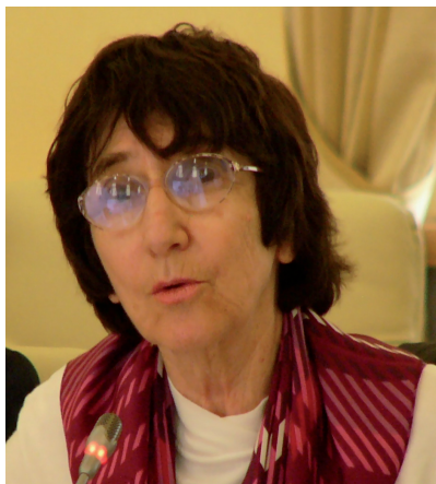
Кэрол Финк , профессор латинского языка и литературы исторического отдела Университета штата Огайо (США).