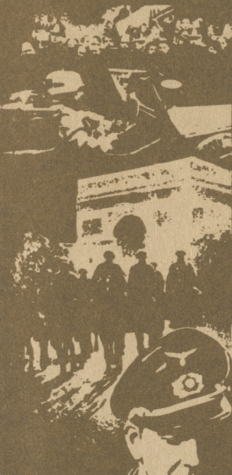
Unterwerfung Europas 1939/41