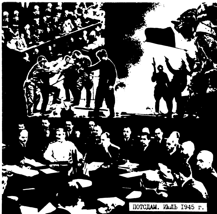
ПОТСДАМ. ИЮЛЬ 1945 г.