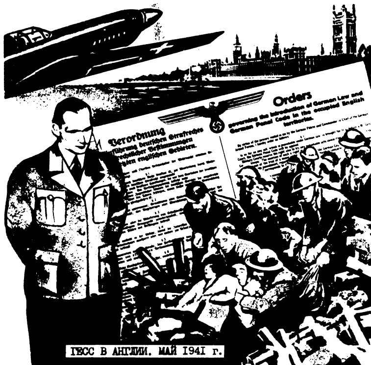
ГЕСС В АНГЛИИ. МАЙ 1941 г.