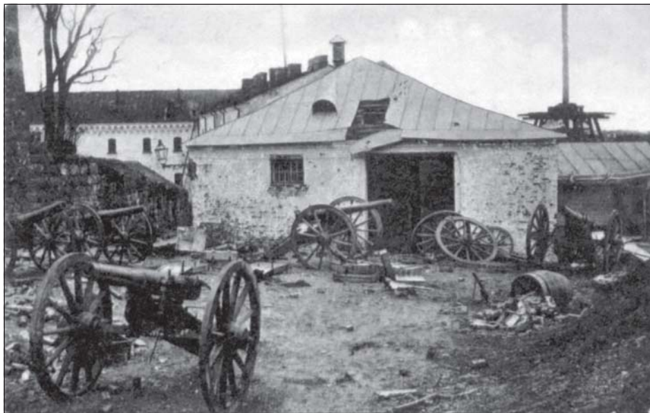
Двор Выборгского замка после взятия Выборга белыми войсками.