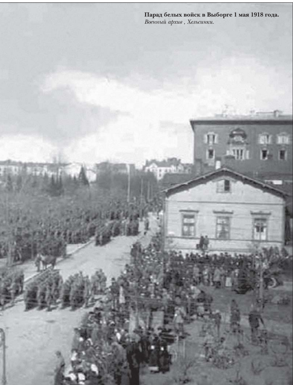
Парад белых войск в Выборге 1 мая 1918 года.