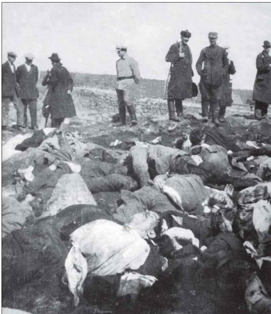
Место массового расстрела в Анненских укреплениях 29.04.1918 года.

Апрель 1996 года.