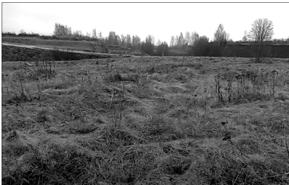
Место массового расстрела в Аннинских укреплениях. Осень 2012 года.