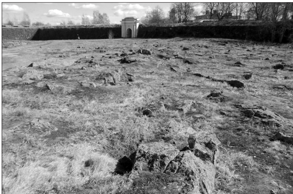
Место массового расстрела 29.04.2012 г.