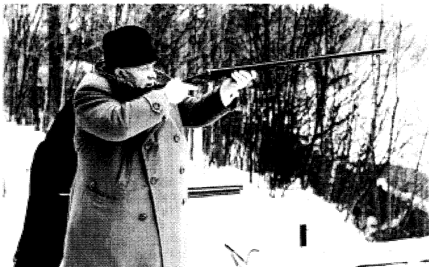
Вооружен и опасен. Хрущев любил рисковать в международной политике, но еще больше любил охоту