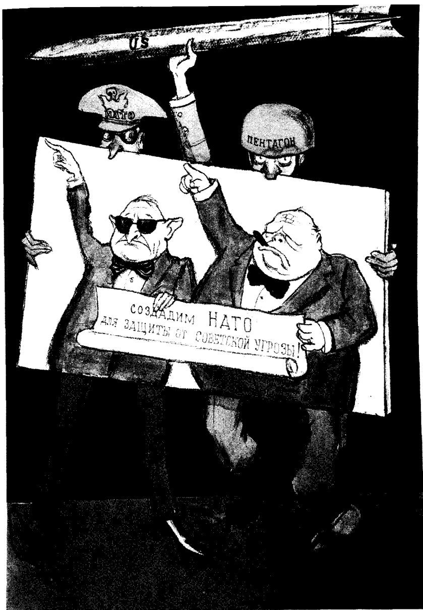
На советской карикатуре 1949 г. Гарри Трумэн и Уинстон Черчилль изображены как вдохновители создания НАТО. За ними прячутся зловещие фигуры поджигателей войны из Пентагона