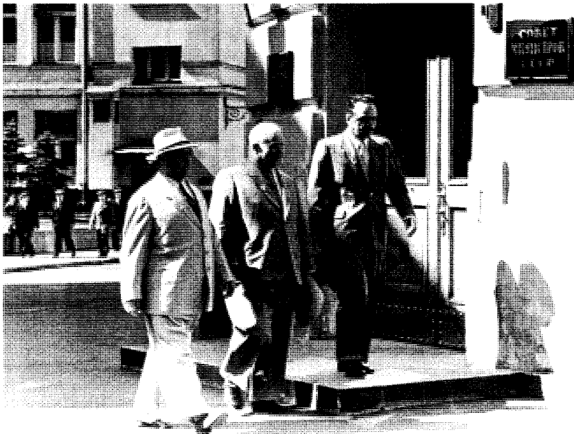
Никита Хрущев, Анастас Микоян и Георгий Маленков идут на работу в Кремле (1954 г.)