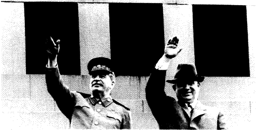
Иосиф Сталин и его будущий разоблачитель Никита Хрущев на трибуне Мавзолея Ленина (1949 или 1950 г.)