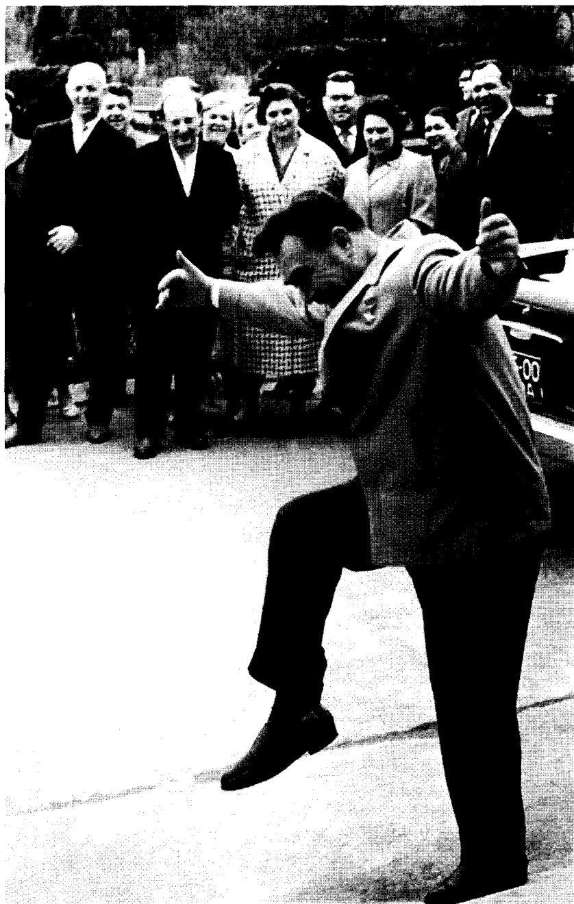
Брежнев говорил: «Обаяние – это очень важный фактор в политике». Он практиковал этот принцип от души, пока позволяло здоровье