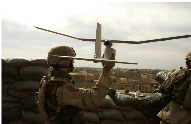
Использование БПЛА — отличительная черта современных войн