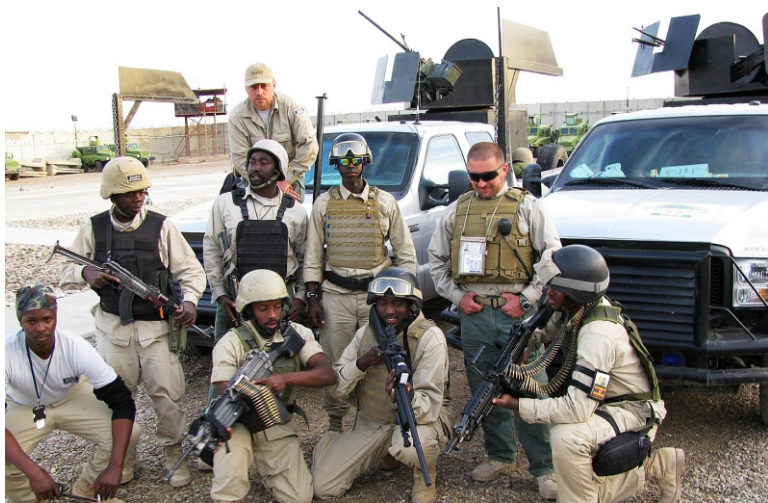
Охрана ЧВК "EOD Technology" на американской военной базе Шилд в Багдаде