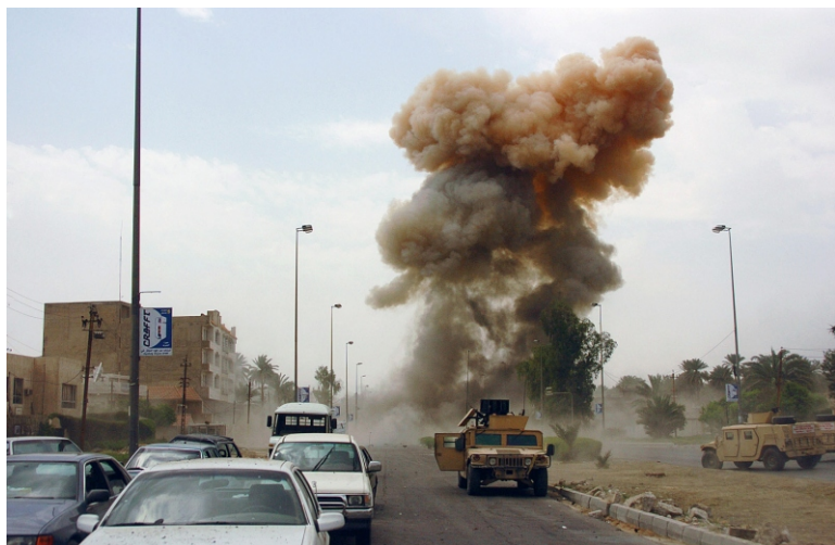
Камера зафиксировала момент подрыва второго СВУ по прибытии солдат на место первого взрыва