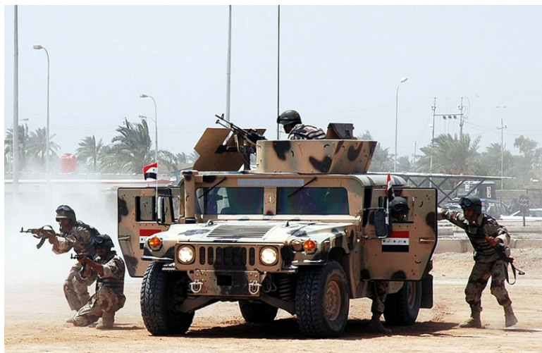
Военнослужащие иракских вооруженных сил