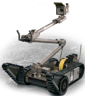
Американский робот "iRobot PackBot" производства компании "iRobot". Применялся для обнаружения мест установок и удаления СВУ в Ираке