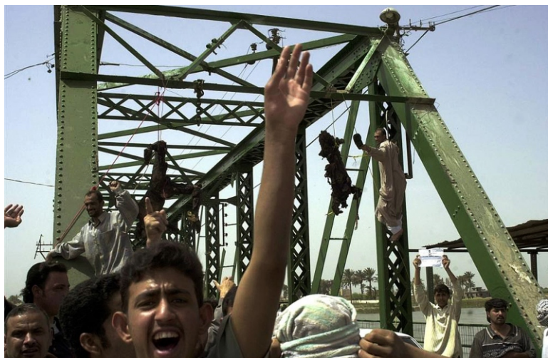
Тела сотрудников ЧВК "Blackwater" после инцидента в Фаллудже 31 марта 2004 года