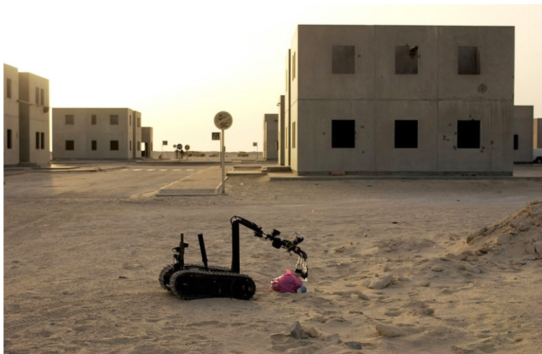
"Irobot" в действии