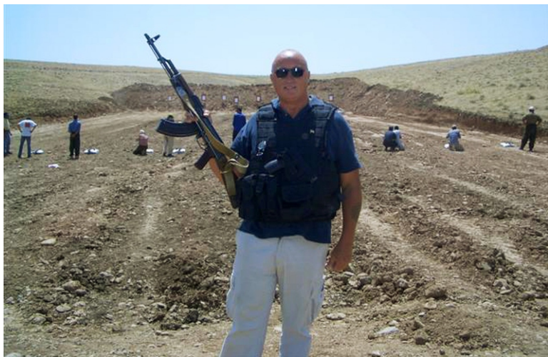
Командир группы британской охранной компании "Erinyes" в Ираке летом 2004 года.