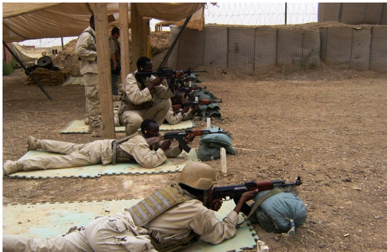
Стрелковая подготовка охраны ЧВК "EOD Technology" на американской военной базе Махмудия