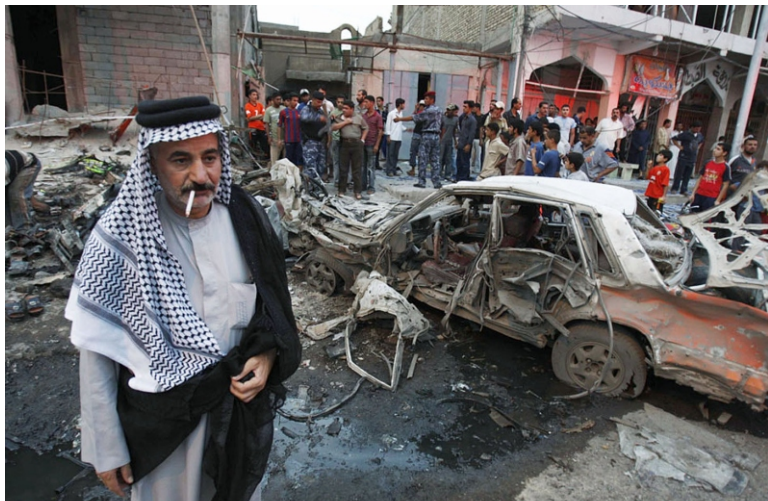
Последствия теракта в поселении езидов 14 августа 2007 года. Теракт признан крупнейшим за всю историю Ирака. Тогда погибли более 500 человек