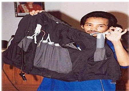
Шахид с подготовленным взрывным устройством