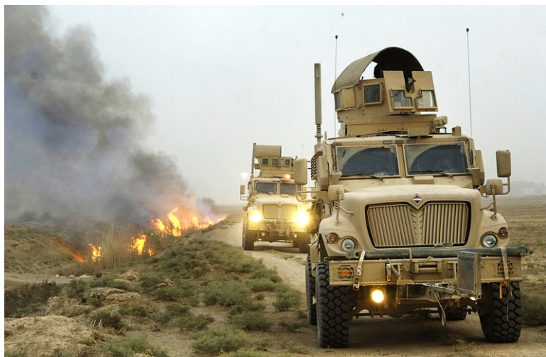
Бронетранспортер "International MaxxPro" производства "Navistar International Corporation" в Ираке. Поступил на вооружение в 2007 году. Имеет повышенную защиту от СВУ (сайт "Defense Industry Daily")