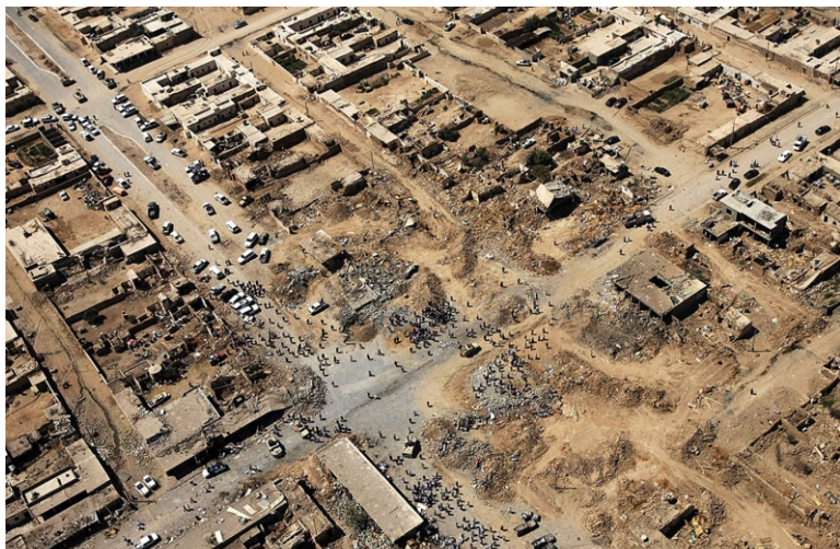
Произошедший 14 августа 2007 года взрыв был настолько мощным, что уничтожил большую часть расположенных в поселении зданий