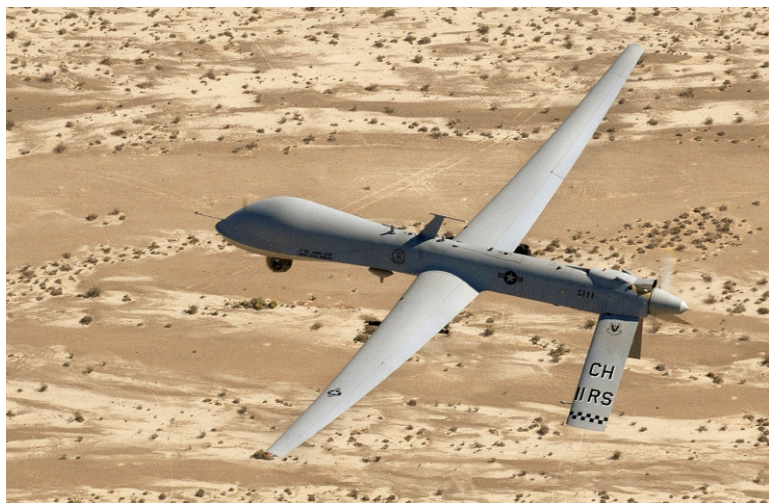
Ударный БПЛА "Predator"