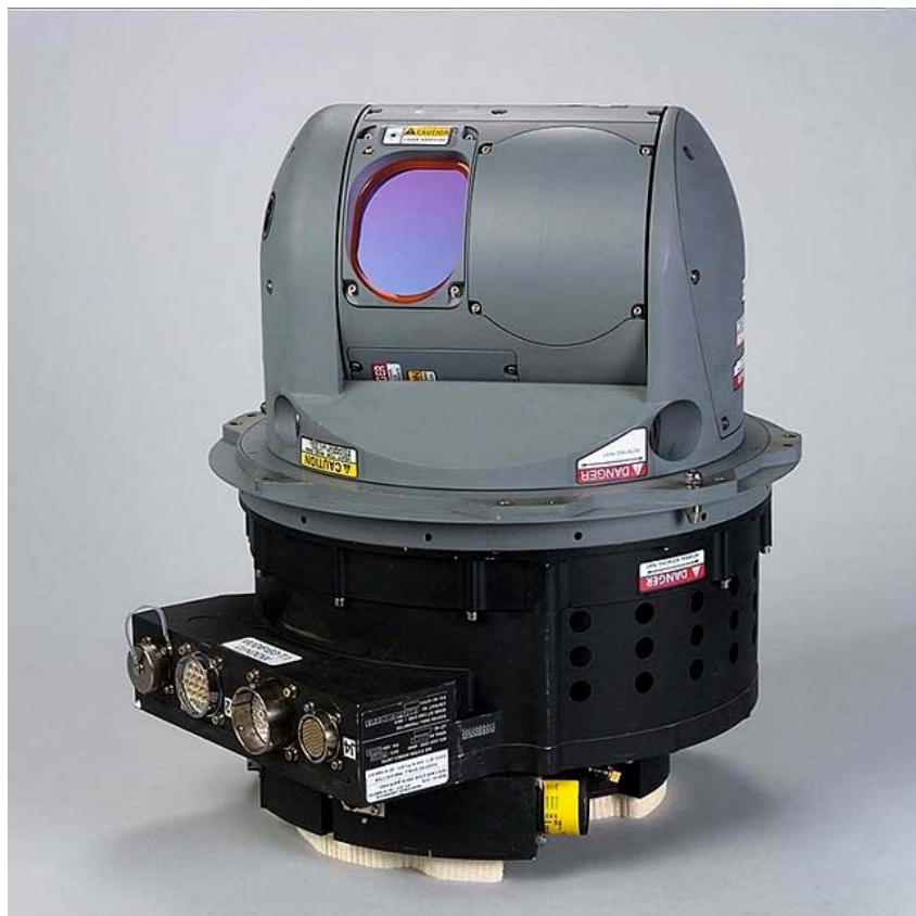
ФОТО 10. Элемент БКО AN/AAQ-24(V) компании NorthropGrumman // www.flightglobal.com )

Насколько велик интерес к БКО, демонстрируют сообщения о контрактах на такого рода системы. В начале марта 2016 г. Объединенные Арабские Эмираты вели переговоры об оснащении восьми своих военно-транспортных самолетов C-17A комплексами LAIRCM (large aircraft infrared countermeasures) компании Northrop Grumman (обратите внимание на тот факт, что относительно новые ВТС были приобретены ОАЭ, видимо 42 , без БКО, а планы устано-