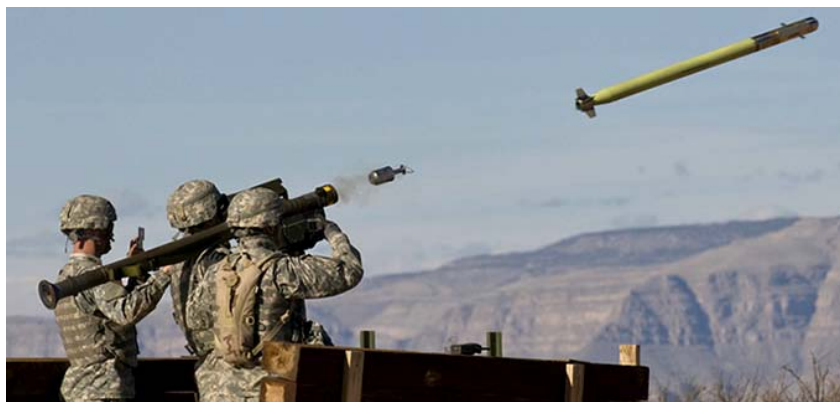
ФОТО 1. Пуск ЗУР комплекса Stinger-RMP

Производство FIM-92В осуществлялось в ограниченном количестве (600 единиц, в отличие от базового варианта, который был выпущен серией более 15 000 единиц), первые две модификации производились до 1987 г., когда их сменил FIM-92С, разработанный с 1984 г., запущенный в серию в 1987 г. и поступивший в войска в 1989 г. Также существуют варианты FIM-92D — с большей помехоустойчивостью, а с 2002 г. — FIM-92G, представлявшая улучшенную версию FIM-92D.