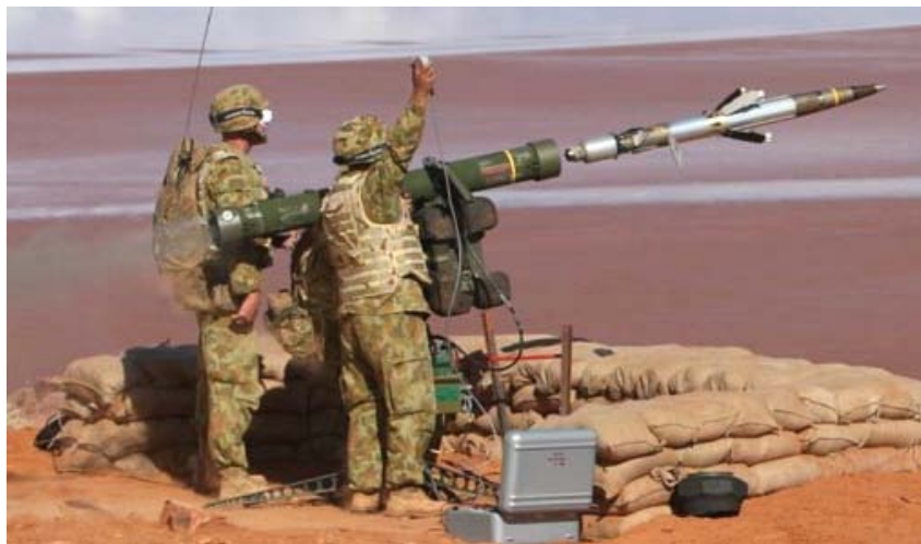
ФОТО 4. Шведский ПЗРК RBS-70

Как сообщается в публикации «Вестника ПВО», «единственным примером применения ПЗРК RBS-70 в реальных боевых действиях служит ирано-иракская война 1980–1988 гг. В вооруженных силах Ирана RBS-70 заполнил нишу между китайским вариантом советского ПЗРК «Стрела-2» и ЗРК средней дальности американского производства «Хок». Появление RBS-70 на полях сражений произошло в январе-феврале 1987 года. Он был представлен в варианте с размещением элементов комплекса на шасси автомобилей «Лендровер». Высокая мобильность этих зенитных систем позволила организовывать засады на наиболее вероятных маршрутах движения иракских боевых самолетов. Считается, что именно комплексами RBS-70 была сбита большая часть из потерянных Ираком 42–45 самолетов» 16 .