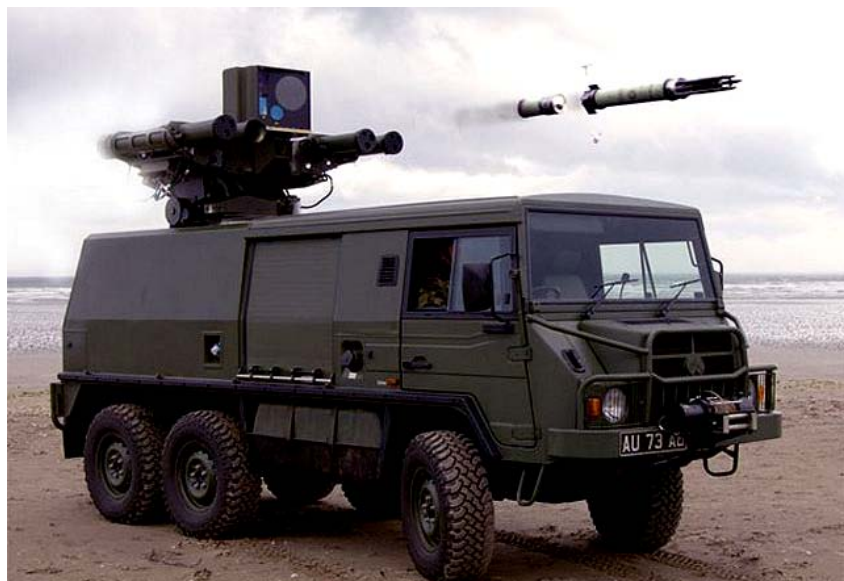
ФОТО 3. ПЗРК Starstreak , установленный на шасси Pinzgauer

в 2,2 килограмма, со взрывателем двойного действия (ударным и дистанционным), дальность действия до 3500 метров, досягаемость по высоте до 2500 метров, а скорость 1,5М. Комплекс использовал радиокомандную систему наведения MCLOS (Manual command to line of sight), в котором оператором джойстиком ракета велась до цели, с тем что на начальном участке использовалось также ИК-наведение, которое могло применяться на ближних рубежах и без радиокомандного способа. В Афганистане данный ПЗРК показал свои недостатки, так как из-за большого веса и способности поражать главным образом цели с низкой скоростью его применение было малоэффективно. Данные недостатки подтвердились затем в ходе войны на Фолклендах, где из 95 запусков британцами лишь в девяти были зафиксированы попадания в цель, а этим же ПЗРК и аргентинское спецподразделение сбilo один британский Harrier GR3. Столь же малоэффективен этот ПЗРК оказался и в Кувейте в 1991 году. Система наведения данного ПЗРК позволяла применять его и против легкобронированных наземных целей.