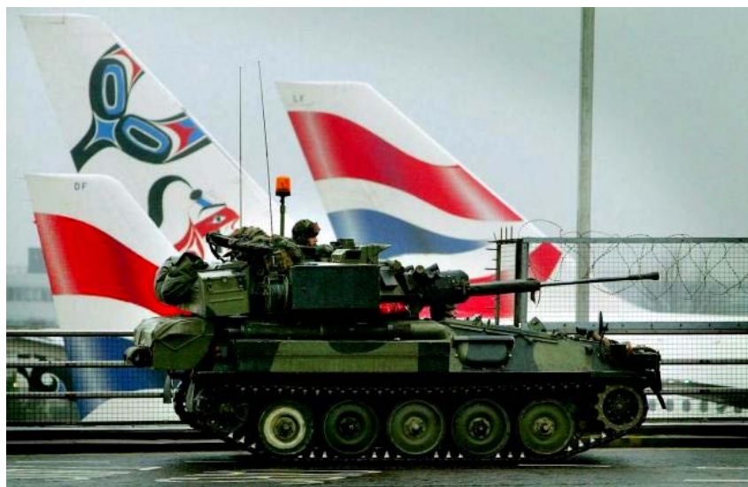
ФОТО 7. Необычная картина — БРМ Scimitar британской армии на патрулировании в районе 4-го терминала лондонского аэропорта Хитроу в период ожидавшейся террористической атаки (снимок датируется 11.02.2003)

В 2003 г. там же в Хитроу были развернуты армейские подразделения, включая бронетехнику для предотвращения, как предполагали, атаки со стороны «Аль-Каиды», но никаких более конкретных данных о возможной угрозе или иной информации относительно этого события не сообщалось.