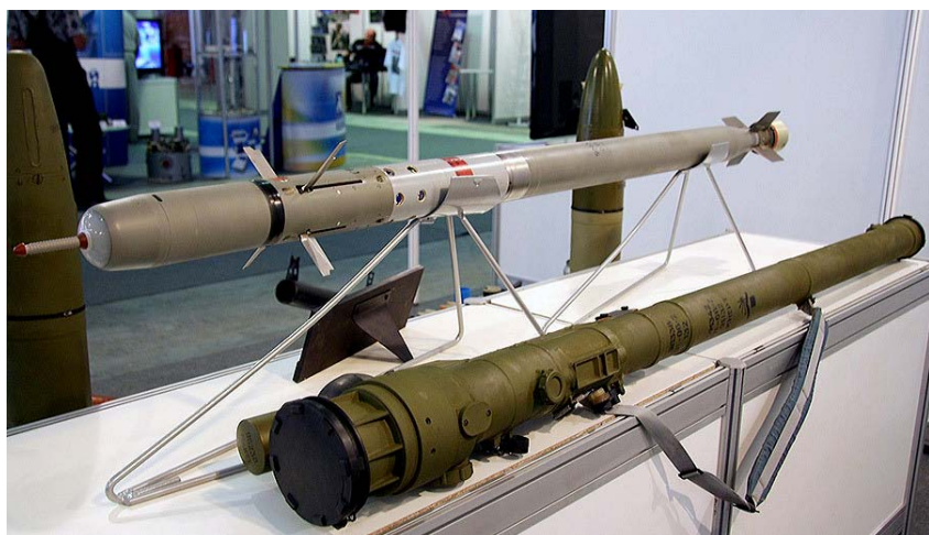
ФОТО 2. ПЗРК 9К333 «Верба» — пусковой механизм 9П521 и ракета 9М366

раля 1991 года в Кувейте один американский истребитель-бомбардировщик F-16 был сбит ПЗРК «Стрела-3», а 21 сентября 1991 года югославскими ПЗРК «Стрела-2» хорватская ПВО сбила два югославских легких штурмовика J-21 Jastreb. В Боснии в сентябре 1995 г. современный французский истребитель «Mirage 2000» был сбит ракетой ПЗРК «Игла» сербских сил ПВО в районе Пале, а в Чечне данным ПЗРК 19 августа 2002 года был сбит вертолет Ми-26.