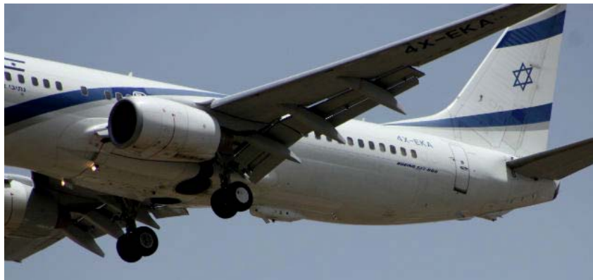
ФОТО 11. Модуль комплекса C-Music компании Elbit Systems, установленный (по центру фюзеляжа, на фото — справа от левой стойки шасси) на гражданском Boeing-737-800 национальной компании El Al

В июне 2013 г. израильская компания Elbit Systems представила комплекс C-Music (commercial multi-spectral infrared countermeasures; также используется название Sky Shield), установленный на гражданском Boeing-737-800 национальной компании El Al, который будет использоваться на определенных маршрутах. Исполнительный директор компании-разработчика Bezahel Machlis на Парижском авиасалоне заявлял 19 июня 2013 г., что интерес к комплексу очень большой и исходит как от военных, так и от гражданских 44 . В апреле 2014 г. сообщалось о завершении испытаний системы.