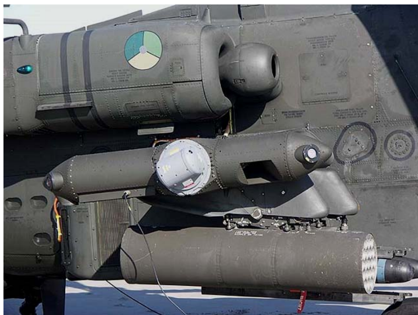
ФОТО 9. БКО AN/AAQ-24 компании Northrop Grumman , установленный на ударном вертолете AH-64 Apache

Программа рассчитана на принятие решения о производстве установочной партии БКО к 2018 г., испытания и оценку в 2019 г. и начало полномасштабного производства в 2020 г. Предполагается приобретение комплексов в количестве 1076 единиц. Ими будут оснащены вертолеты армейской авиации и некоторое количество самолетов. Разрабатываемый комплекс значительно легче — его вес должен быть в пределах 120 фунтов против 300 у используемой в настоящее время системы 41 .