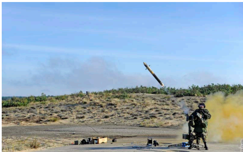
ФОТО 5. Французский ПЗРК Mistral

Особенностью комплекса является необходимость применения с носимой платформы (треноги), что снижает его мобильность и гибкость применения, в первую очередь негосударственными вооруженными формированиями. В то же время его технические характеристики способствовали широкому распространению.